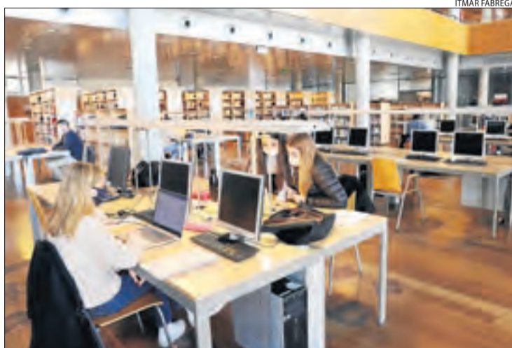
Les biblioteques de la UdL també van reobrir.