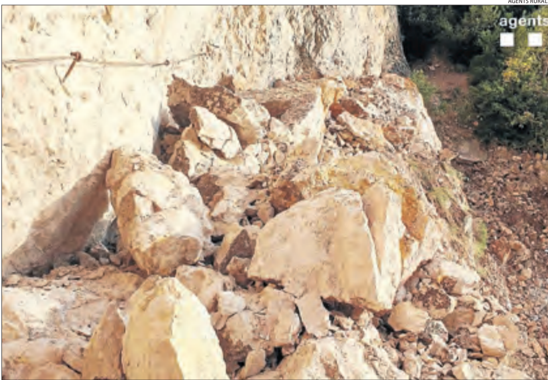
Algunes de les roques que es van desprendre van quedar al camí en un tram de 25 metres de llarg.

Des de la Fundació Catalunya-la Pedrera, titular del Congost, van assenyalar que el camí és públic i que ha de primar la seguretat de l'espai natural de Mont-rebei.