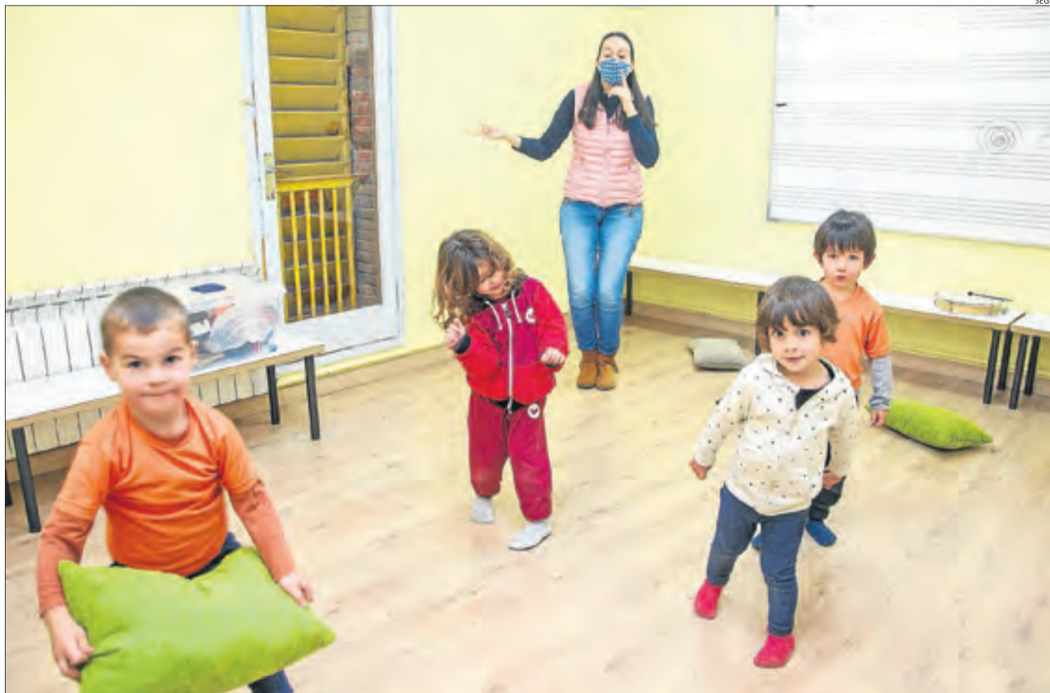
Quatre alumnes ahir en una de les classes de l'Escola Municipal de Música de Tàrraga.