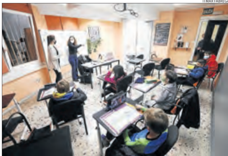
Una aula de l'acadèmia Inlingua.

D'altra banda, les biblioteques públiques van reobrir ahir amb un aforament del 50%. La Universitat de Lleida (UdL) va fer el mateix amb les seues. L'horari d'aquesta setmana és de 9 a 19 hores de dilluns a divendres, i la de la facultat de Lletres estarà operativa també el cap de setmana de 9 a 21 hores. A partir del dia 30 la resta de biblioteques de la universitat aplicaran aquest horari i l'ampliació d'aforament fins al 70% està prevista en la tercera fase del pla de reobertura, el dia 21. La docència continua sent virtual, excepte les pràctiques i les activitats d'avaluació. Les classes seran presencials una altra vegada després de les vacances de Nadal.