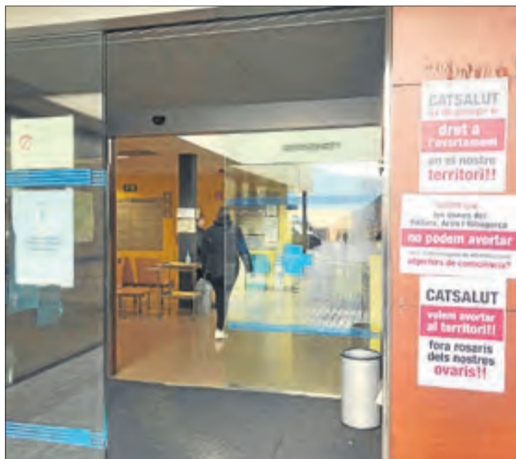
Cartells a favor de l'avortament voluntari en un CAP del Pallars.

La mesura té com a objectiu solucionar la falta d'opcions a les comarques lleidatanes a l'hora d'avortar de forma voluntària i se suma a l'anunciada la setmana passada per la consellera Alba Vergés, que va assegurar que abans que acabi l'any es traslladaran facultatius no objectors als hospitals de Vielha i Tremp perquè atenguin les demandes d'avortaments farmacològics