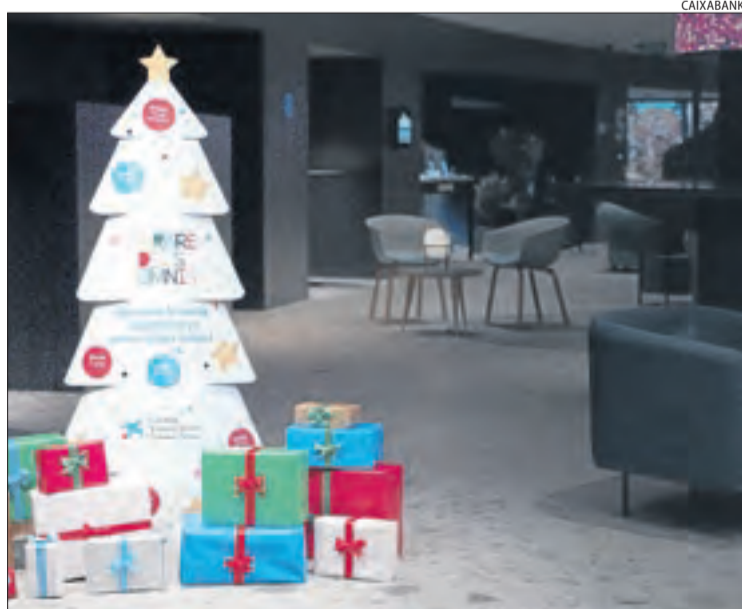
'L'arbre dels somnis' és en 60 oficines de CaixaBank de Ponent.

Així mateix, és la primera vegada que a nivell estatal CaixaBank ha posat a disposició d'aquesta iniciativa les seues 4.000 oficines (repartides entre 2.000 poblacions diferents) amb l'objectiu d'arribar fins a la llar de més de 25.000 nens i nenes en situació de vulnerabilitat. A Espanya hi participen més de 400 entitats socials de totes les comunitats autònomes.