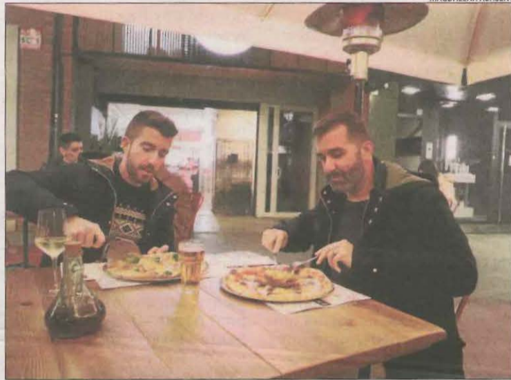
Dos lleidatans sopen una pizza en un restaurant dilluns passat.