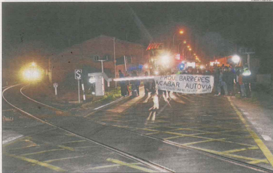
Els manifestants davant del pas de la C-13, just abans de passar un dels combois de la línia.