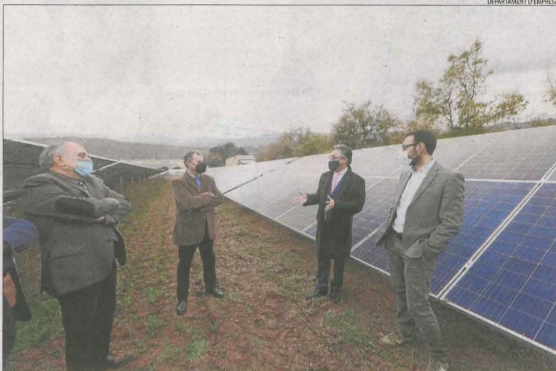
Tremosa va presidir ahir la inauguració d'una nova planta fotovoltaica construïda a Talarn.

A Lleida hi ha 175 aerogeneradors en servei.