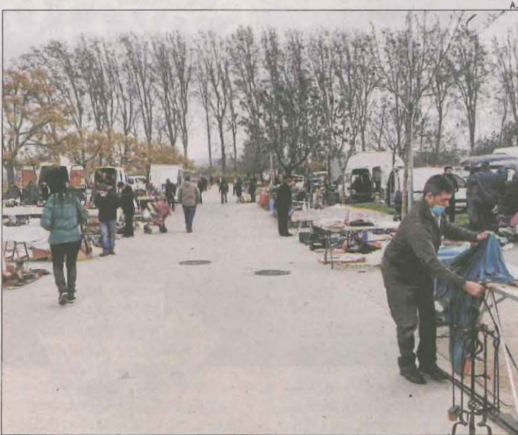
El mercat va obrir a les vuit del matí i va tancar a les 14.00 hores.