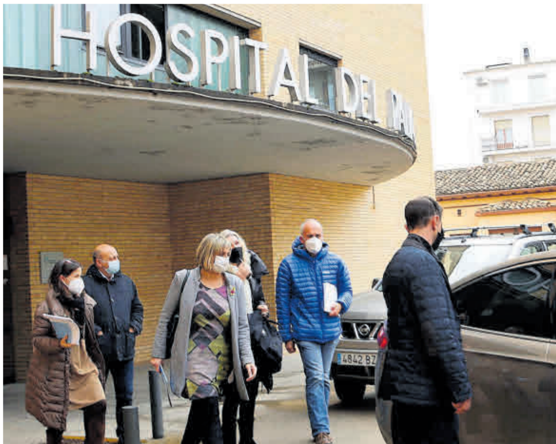
La consellera de Salut, Alba Vergés, al sortir de l'Hospital de Tremp, ahir.

Ara com ara, el balanç de morts s'eleva a 55 residents, prop del 40% del total d'avis que vivien en aquest centre. D'aquests, només 11 van morir a l'Hospital de Tremp. La pràctica majoria va morir a la residència. Vergés va aclarir que aquestes persones van ser tractades amb 20 bombes d'oxigen, que es van instal·lar al