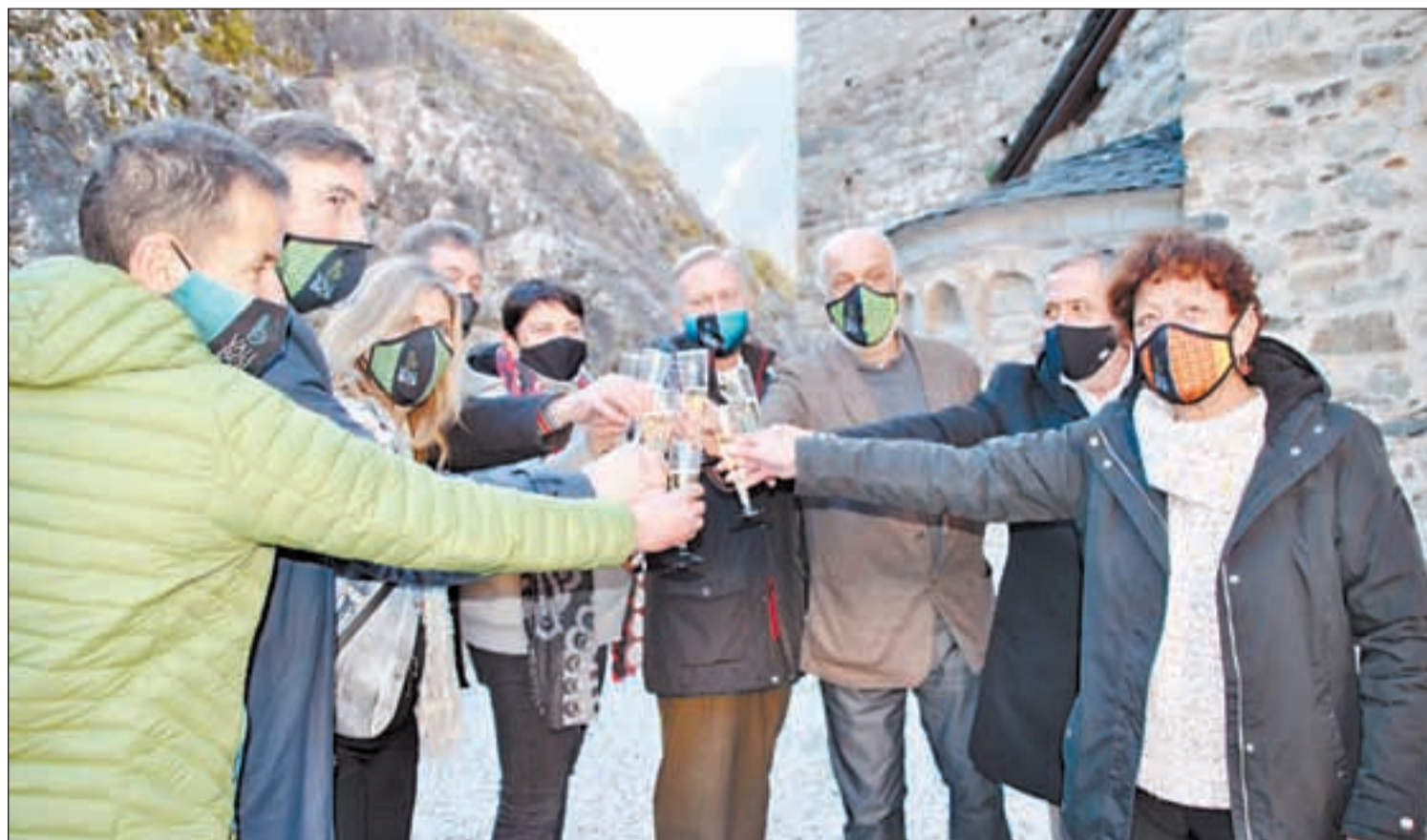
Brindis por el aniversario de la declaración de la Unesco, con la vista puesta en los nuevos retos para las nueve iglesias

La Vall de Boí brinda por los veinte años de Patrimonio de la Humanidad del románico