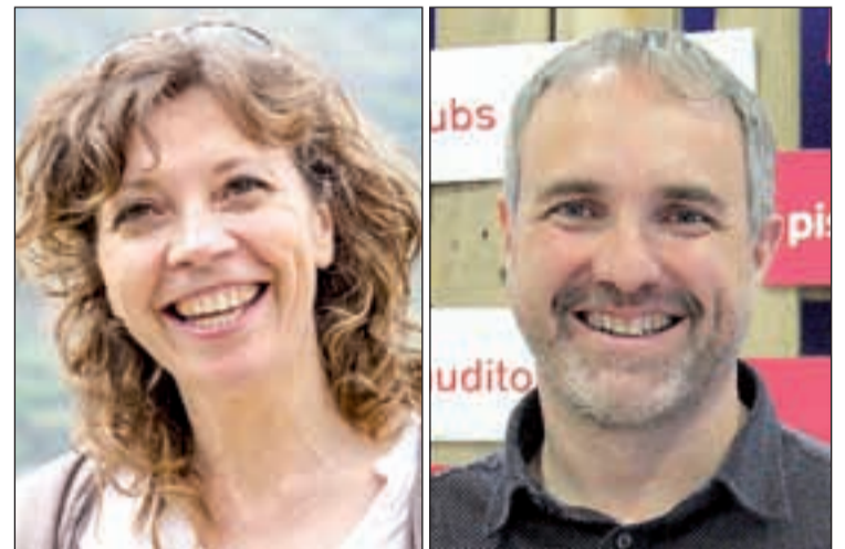
La diputada pel Pirineu i l'alcalde de la Seu d'Urgell

Els candidats poden presentar les seves candidatures fins aquest dijous i serà des de l'11 fins al 13 de desembre quan hi haurà les votacions. En aquest sentit, segons estableix el reglament, cada afiliat podrà votar a dos candidats i, en funció del nombre de vots que rebí cadascú, s'adjudicarà el primer lloc, el segon o el tercer. A partir del quart, serà la direcció qui acabi de dissenyar la llista buscant l'equilibri territorial.