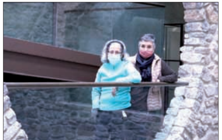
Ha invertit 95.000 euros amb material de protecció

L'entitat porta invertits 95.000 euros amb EPI's, PCR's i material de desinfecció per protegir les llars i els usuaris. Les persones que interessades a col·laborar amb la causa, ho poden fer a través de bizum, amb el codi 00978, o per transferència bancària a la pàgina web de l'entitat.