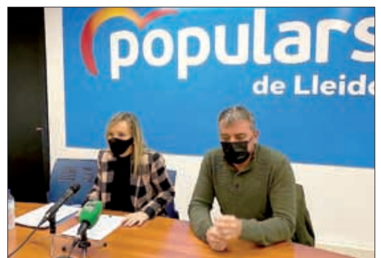
Els populars a Lleida van fer ahir una valoració dels comptes

Així mateix, argumenten que el govern de Pedro Sánchez presenta els "pressupostos més antisocials de la història, precisament perquè obvia l'escenari en què es mouen una gran part de ciutadans davant els efectes devas-