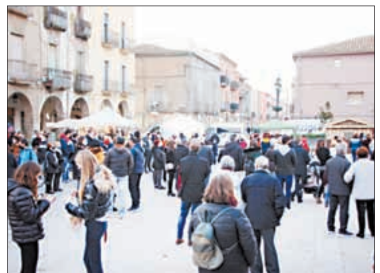
Imatge del mercat que s'ha celebrat a Almacelles

Així mateix, cal destacar que era igualment el seu agraïment pel manteniment d'aquest mercat de Nadal, pel suport que les fires i mercats d'aquesta mena representen per als comerciants ambulants.