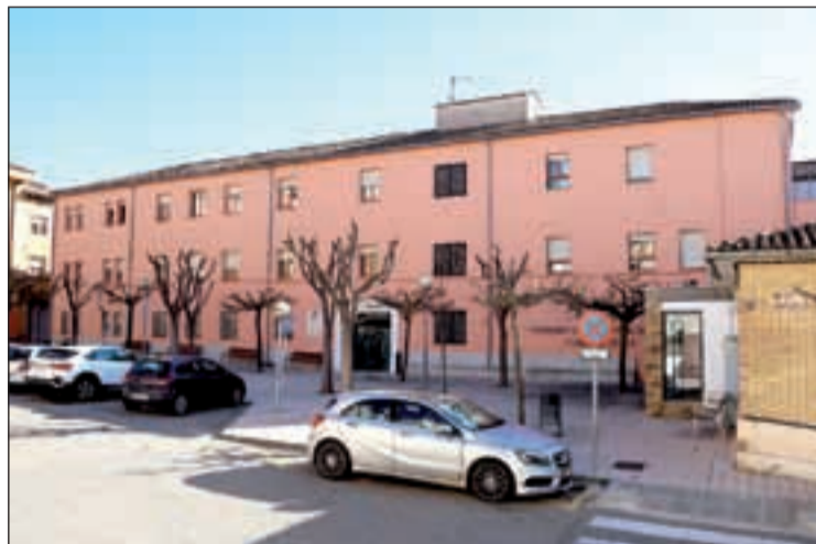
Imatge recent de la residència Fundació Fiella