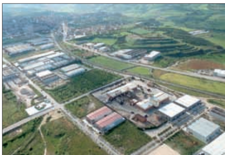
Imatge àrea del polígon de Cervera