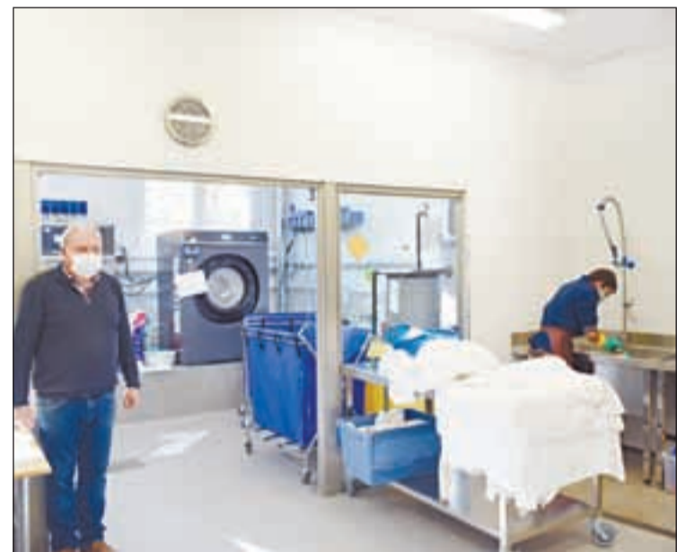
FOTO: Càritas Urgell / Aposten per una economia social i sostenible

CET Grapats està situada a la nau del grup situada a l'avinguda Guillem Graell de la Seu d'Urgell, s'hi donen serveis de bugaderia, lloguer de vaixelles, serveis de paqueteria i missatgeria Ecològica, i disposa d'un punt de recollida de paqueteria per a compres online; i també disposa d'una botiga per a la venda de mobles i objectes de segona mà.