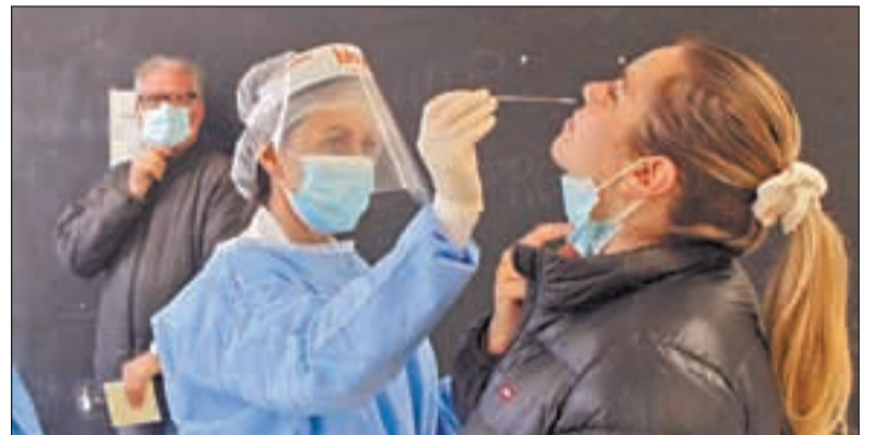
Una de las pruebas que se efectuaron en Almenar

Ayer se realizaron en la demarcación, concretamente, 130 pruebas en Sort, 220 en el Pont de Suert, 320 en la Poble de Segur, 396 en Tremp, 285 en Almenar y 104 en Lleida. Las pruebas se hacen a mayores de 16 años asintomáticos.