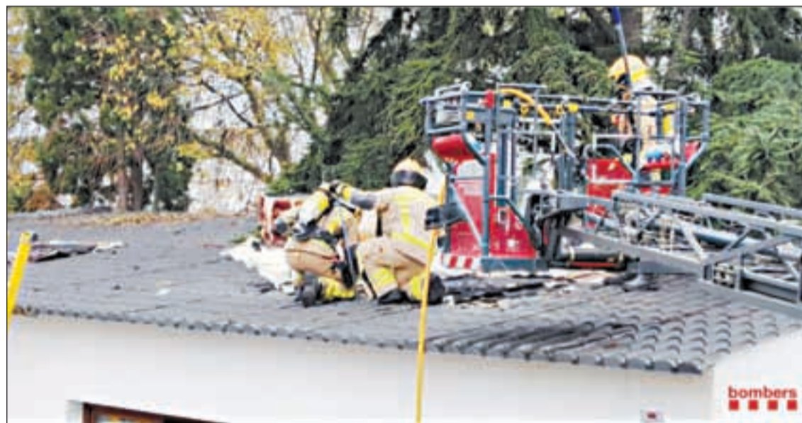
Moment en què els Bombers de la Generalitat apagaven l'incendi de xemeneia d'Alcarràs

Un contenidor soterrat de matèria orgànica que es trobava a la plaça Catalunya de Torregrossa es va cremar ahir per un incendi que es va originar en el seu interior. En aquest sentit, els serveis d'emergències van ser alertats pels veïns a les 18.30 hores i van ahir dues dotacions dels Bombers de la Generalitat que van apagar l'incendi. D'altra banda, els efectius del cos es van desplaçar a la plaça de la Pedrera de la Pobla de Segur en ser alertats, a les 19.57 hores, que s'estava cremat un contenidor que finalment va quedar calcinat.