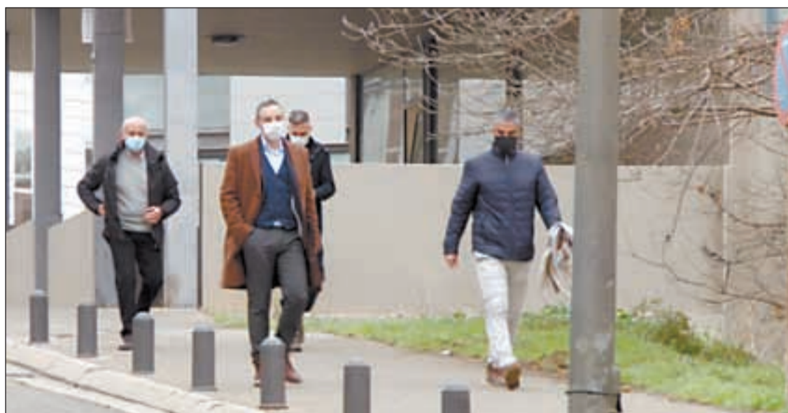
Imatge de quatre dels cinc policies que van declarar ahir als jutjats de Lleida

Els investigats només van respondre les preguntes del jutge perquè la fiscalia no els hi va fer cap i perquè es van negar a respondre l'acusació particular. Segons va explicar Llauredó, els policies van reconèixer ser al centre de votació de la Mariola, però van negar les acusacions i van dir que van usar una "mínima força" contra la gent i que van ser els concentrats els que els van agredir i tirar objectes. Les seves declaracions, però, "són totalment contradictòries a la prova gràfica", va assegurar Llauredó. A