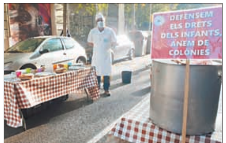
El sector del lleure es va manifestar ahir

El diari també detalla que una altra de les peticions del text és poder ampliar l'horari d'obertura fins a la mitjanit a partir del 4 de desembre i que es permeti el servei a les barres, sempre que es