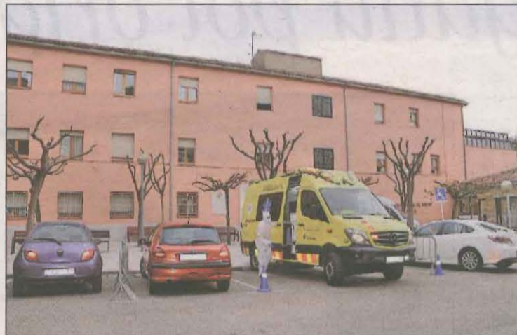
La residència de Tremp, amb una ambulància al davant

El Departament de Salut va acordar intervenir la residència de gent gran de la fundació Filella-Sant Hospital de Tremp el passat 28 de novembre després que