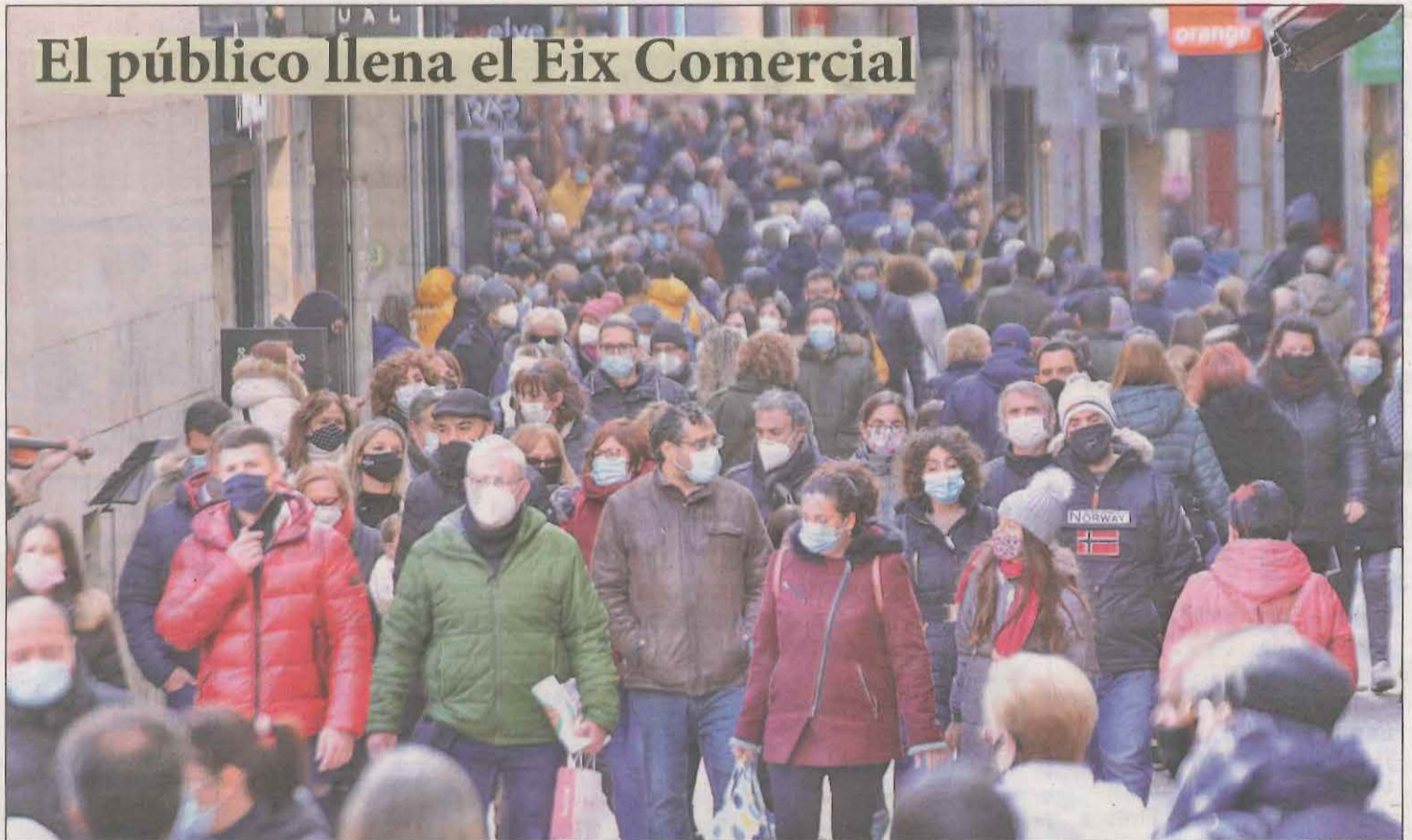
El Eix Comercial vivió ayer, último día del puente, una jornada de gran afluencia de gente por segundo día consecutivo

"Es el mejor regalo de cumpleaños", afirma la primera persona que recibe la vacuna de Pfizer