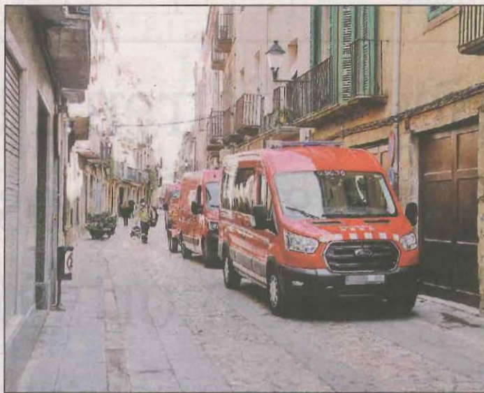
Diversos cotxes del cos aparcats davant el centre

Els Bombers de la Generalitat segueixen donant suport en les tasques de desinfecció de la residència Mare Janer de Cervera, amb un brot actiu de Covid-19, que segons les darreres dades de la Paeria, afecta 24 dels 53 interns, així com 5 dels 40 treballadors del centre de la capital de la Segarra. De moment, l'evolució dels positius és lleu i molts no presenten símptomes.