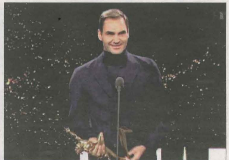
El tenista Roger Federer recibió un premio en Suiza

El tenista Roger Federer (39) afirmó que no está recuperado al cien por cien y que su participación en el Abierto de Australia es una carrera contra el tiempo. "Esperaba que estaría al cien por cien pero a día de hoy no lo estoy. Tengo curiosidad por saber si el torneo comenzará el 8 de febrero porque por supues-