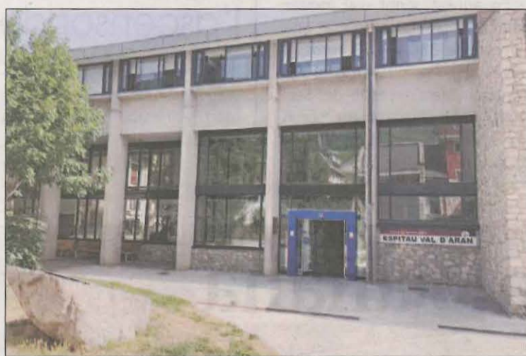
Imatge d'arxiu de la façana de l'Espitau Val d'Aran

L'Ajuntament de la Pobla invertirà 30.000 euros per fomentar el comerç local durant les compres de Nadal i ajudar a pal·liar els efectes econòmics. Sota el lema "Compra a la Pobla, hi guanyem tots", injectarà 18.095 euros, repartits proporcionalment entre tots els comerços, bars, restaurants, perruqueries i centres de salut i estètica. Els establiments participants rebran un talonari amb 100 butlletes en premis ocults que repartiran entre tots els clients que facin compres per un valor superior al que cada negoci estableixi.