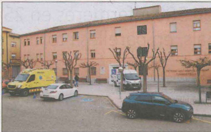
Edifici de la Residència Fiella de Tremp