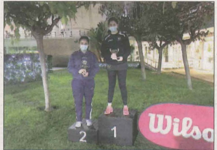
La jugadora subió a lo más alto del podio