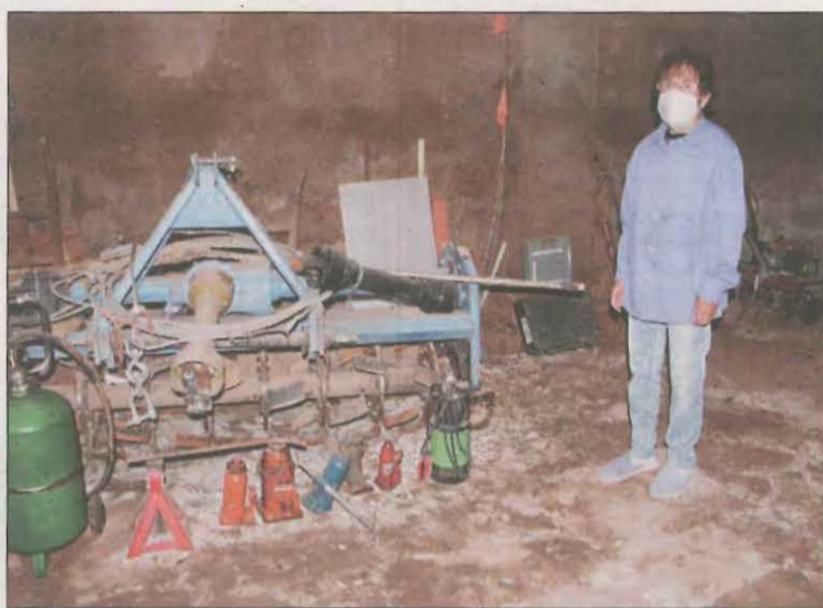
Una veïna de l'Albi al seu magatzem encara afectat per l'aigua

l'estat espanyol per atendre les necessitats dels ajuntaments, mentre va reconèixer que les ajudes arriben molts mesos després de tots els desperfectes ocasionats per la depressió en altura de