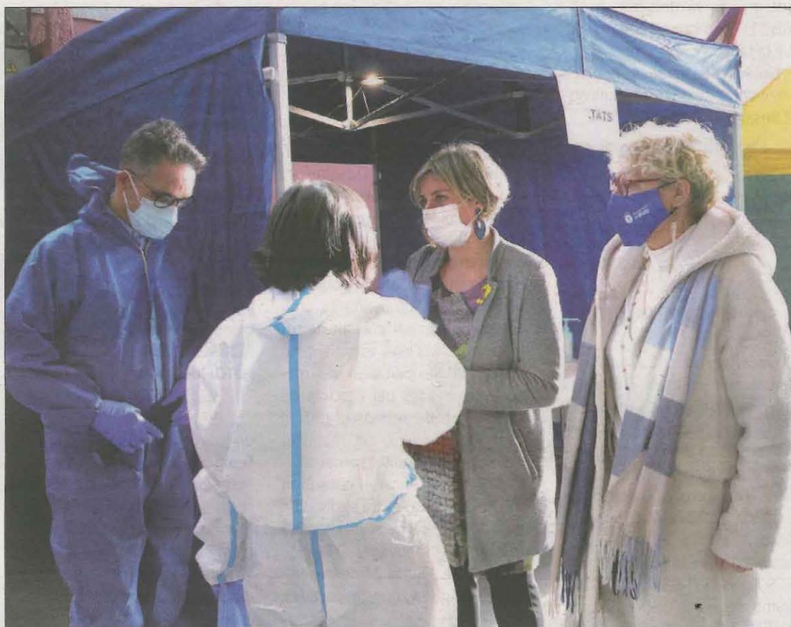
Imatge de la reunió de les institucions que va tenir lloc ahir a Tremp per analitzar la situació

55 persones ja han perdut la vida des de l'inici del brot a la residència