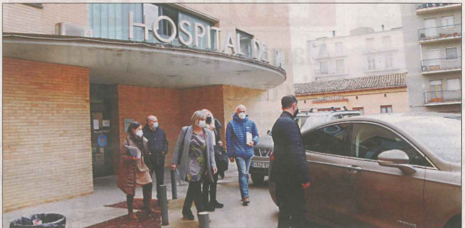
La consellera compareció ayer en Tremp para dar explicaciones sobre la situación en el geriátrico, con 55 muertes

Hay 120 personas en cuarentena y se está estudiando no aplicar la flexibilización en la movilidad prevista por Salut para el fin de semana.