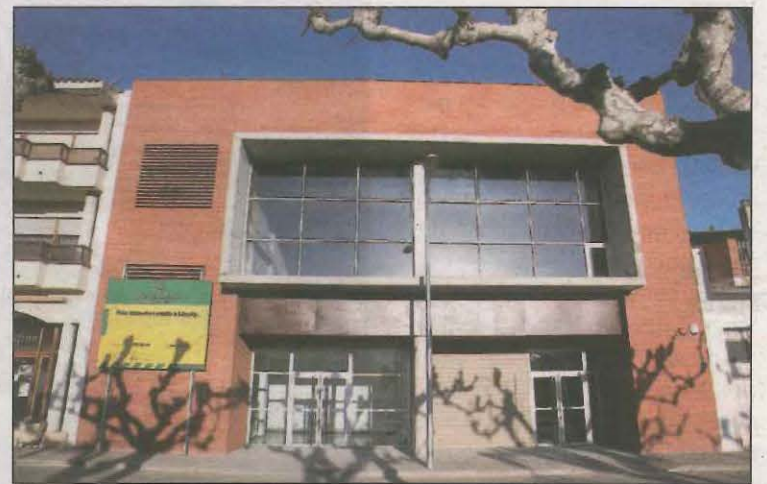
S'ha tancat el consultori mèdic per un cas

Ahir es va tancar el consultori mèdic per un cas entre els facultatius. Totes les urgències i consultes han estat derivades al CAP de Mollerussa. Fins al 24 de desembre es tanquen zones esportives,