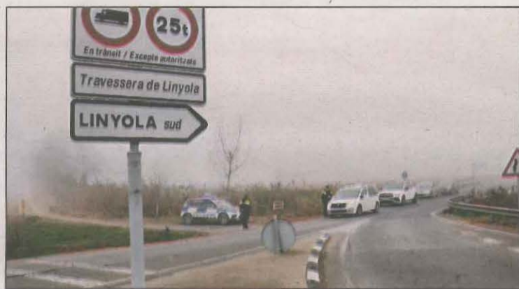
Es vol evitar que el rebrot s'estengui a la resta de la comarca

L'Ajuntament de Linyola (Pla d'Urgell) demana a la població que eviti "desplaçaments innecessaris" fora del municipi amb l'objectiu de frenar el brot de covid-19 que afecta més de 150 veïns, segons fonts municipals. Coincidint amb el primer cap de setmana de confinament comarcal, els Mossos d'Esquadra han començat a realitzar controls als accessos de la població que s'allargaran durant tot el cap de setmana. Ser-