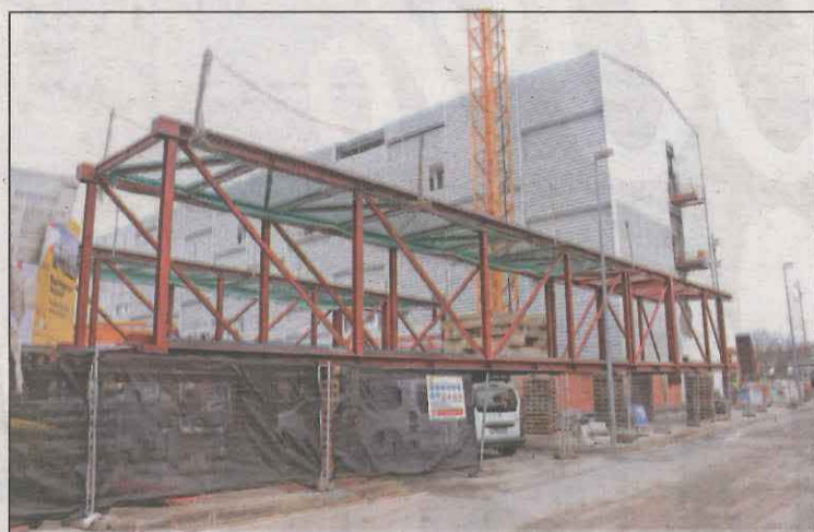
La passarel·la unirà l'Arnau amb el nou edifici

Especialment de cara els dies de Nadal, el coordinador de la unitat Covid va demanar que to-