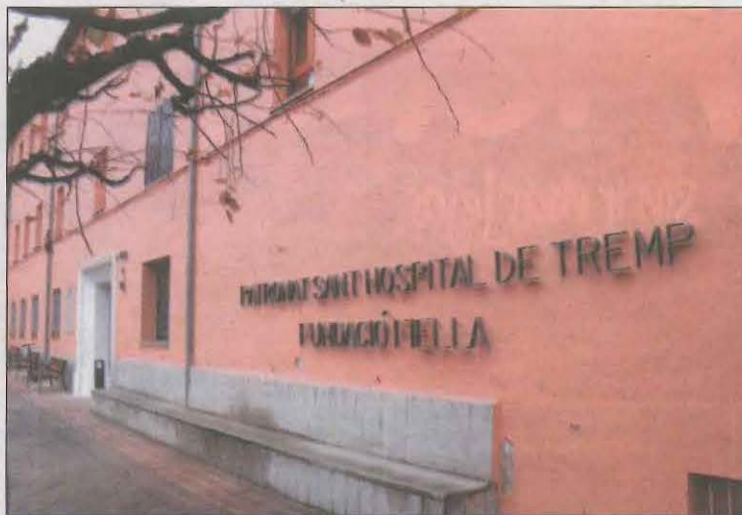
Exterior de la residència Fiella de Tremp

Ara per ara, la residència Fiella de Tremp es manté sense cap resident positiu de covid-19, després que aquest diumenge