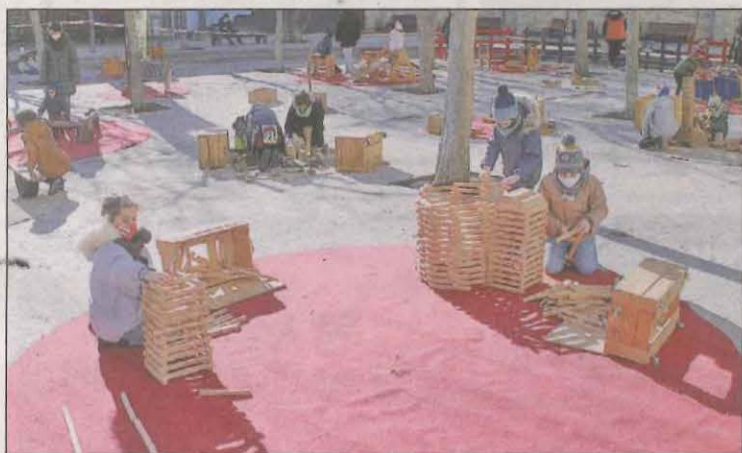
Los pequeños disfrutarán de juegos

'Reactivan' la moción para proteger los vestigios de la Guerra Civil