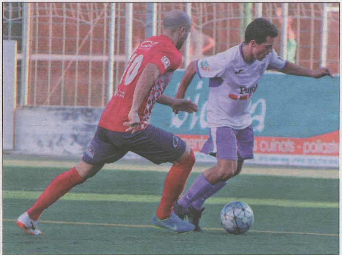
Se podría dar un escenario en el que acabará solamente la liga de Primera Catalana

Los equipos argumentan, entre otras cosas, que teniendo en cuenta el riesgo epidemiológico actual, parece complicado alcan-