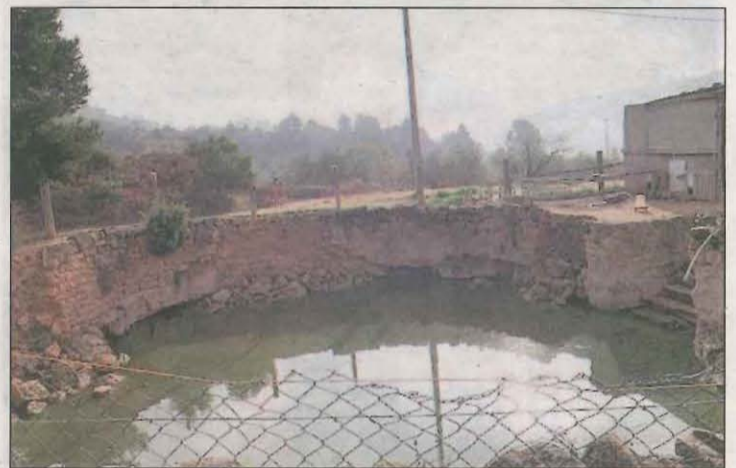
Es preveu que es puguin realitzar en dos mesos

El conductor d'un turisme va sortir il·lès ahir després de xocar contra un porc senglar al quilòmetre 12 de la carretera LP-3322, al terme municipal de Linyola. Els fets van ocórrer a les 18.10 hores de la tarda i segons van explicar fonts dels Bombers de la Generalitat només es van haver de lamentar danys materials.