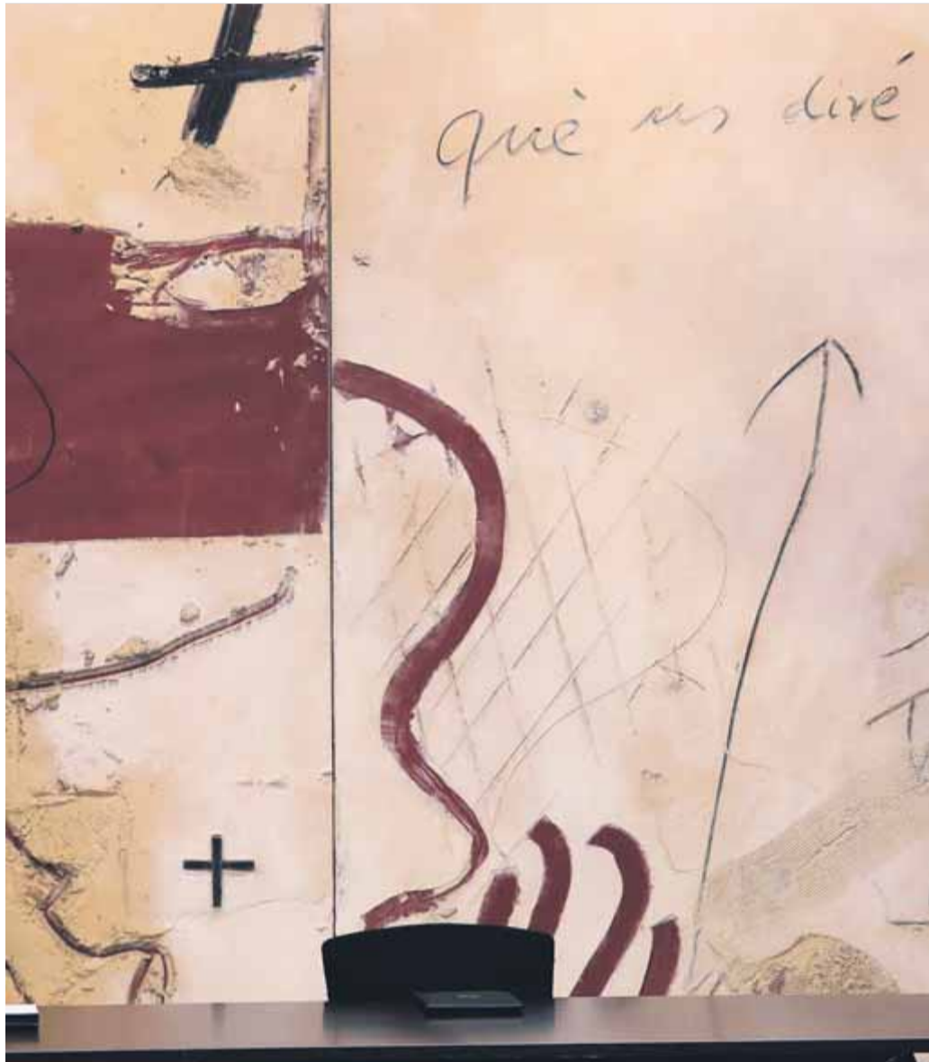
La cadira del president en el Consell Executiu s'ha deixat buida

D'una banda, fonts de Vicepresidència destaquen el lideratge assumit per Aragonès des del primer