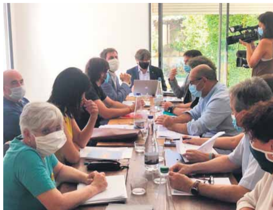
Perpinyà va ser escenari al juliol d'una reunió presencial del consell de govern del CpR