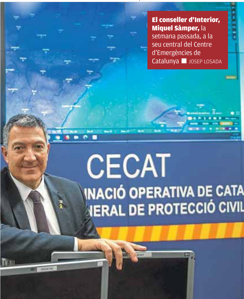
El conseller d'Interior, Miquel Sàmper, la setmana passada, a la seu central del Centre d'Emergències de Catalunya ■ JOSEP LOSADA

d'aquestes característiques, amb una doble acusació: la pública del ministeri fiscal i l'acusació via defensa del mossos per part dels lletrats de la Generalitat. El propietari del procediment penal és la víctima, i per tant estem a les mans de la capacitat que tingui el lletrat de