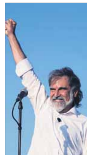
Jordi Cuixart, president d'Òmnium

doners, on compleix una pena de nou anys de presó arran de la sentència del procés i de l'1-O. Igualment, Cuixart ha recordat totes les persones que planten cara als estralls de la pandèmia de Covid-19: “Orgull de país i, sobretot, més consciència que mai que els ciutadans tenim el deure d'arribar allà on no arribin les institucions.” Cuixart creu que “normalitat” també vol dir tenir un bon govern, imprescindible per sortir de la triple emergència en la qual ens trobem: “sanitAria, social i democràtica.” ■