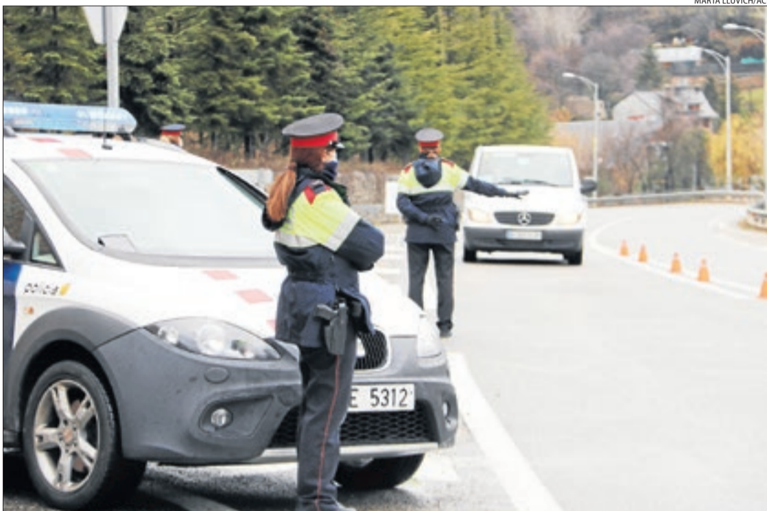
Un control dels Mossos a l'Eix Pirinenc, N-260, a prop del nucli urbà de Sort.

El tancament municipal provoca l'absència de visitants i el sector ho viu amb "angoixa i sense final a la vista" || La restauració té un 30 per cent de locals oberts i algunes reserves a partir de dilluns