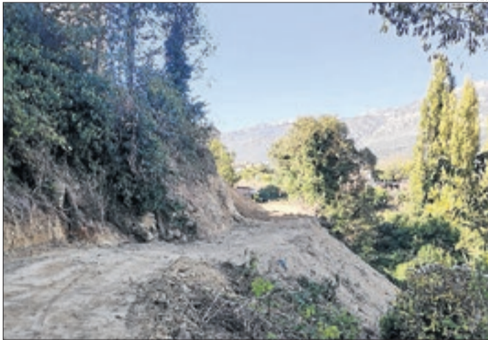
Nou vial que connectarà amb la font del Pedró.

El consistori invertirà 28.000 euros a adequar la zona