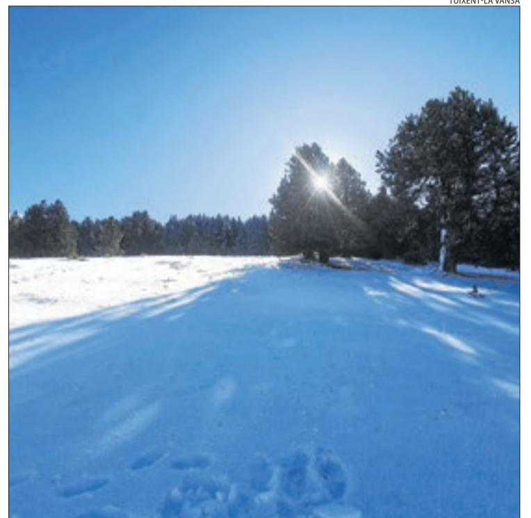
La neu va continuar caient al Pirineu. A la imatge, Tuixent.