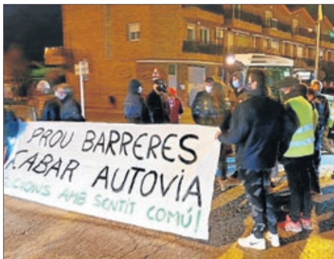
Els manifestants van tallar de nou la C-13 a Tèrmens.

a plataforma Prou Barreres , demanen la paralització del projecte i reivindiquen altres alternatives per suprimir el pas a nivell de la carretera, com allargar l'autovia de Balaguer a Lleida, la qual cosa evitaria la construcció dels dos passos elevats, que consideren "noves barreres" en la població i una inversió innecessària.