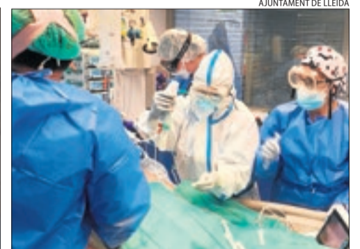
Imatges extretes del vídeo de la Paeria, amb sanitaris atenent malalts de Covid a l'hospital Arnau de Vilanova.

plantes de la Covid, a l'interior de l'hospital, la Paeria demana "reflexionar sobre les conseqüències i la importància dels actes per lluitar contra la Covid". "És igual si ets negacionista o estàs contra la gestió de la pandèmia, perquè hi ha un fet innegable que el coronavirus existeix i està destrossant l'economia, la salut física i psíquica