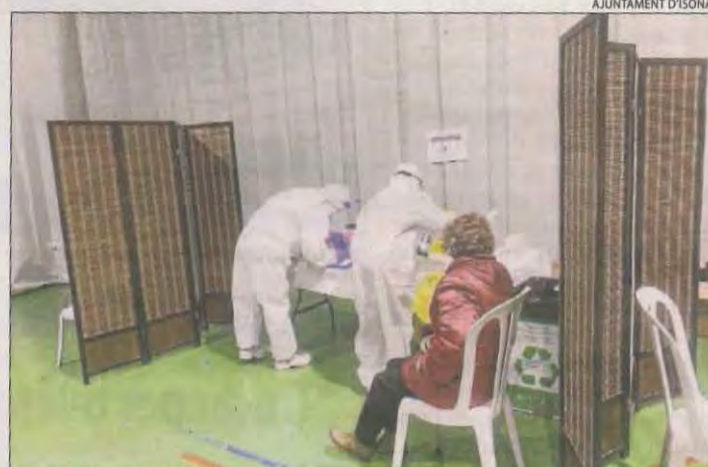
A Isona també es van fer aïr tests massius.