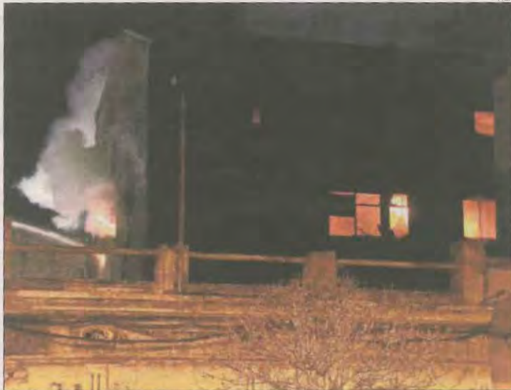
Vista de les flames des de l'exterior de la nau okupada.

| BADALONA | Almenys 17 persones van resultar ferides, cinc de les quals greus, en un esfeïdor incendi declarat minuts abans de la nou de la nit d'ahir en una nau industrial okupada entre els barris de Gorg i de Sant Roc de Badalona. Les flames van afectar principalment les plantes superiors d'aquestes instal·lacions i, al tancament d'aquesta edició, els bombers encara no havien pogut controlar-les. Gairebé una trentena de dotacions estaven treballant a última hora de la nit d'ahir en aquest incendi.