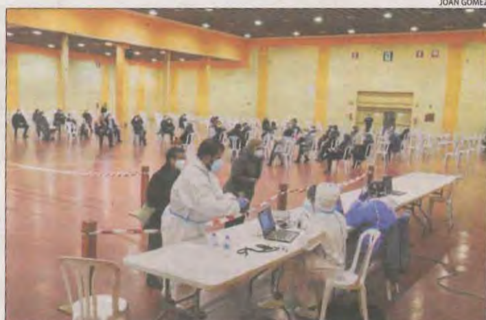
El dispositiu al Pavelló Firal de Mollerussa per al cribratge.