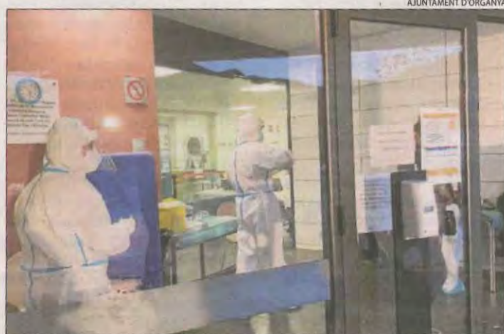
A Organyà es van fer proves al consultori mèdic.