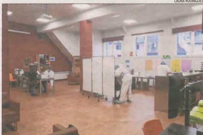
Proves al centre de joventut Antara de Vielha.