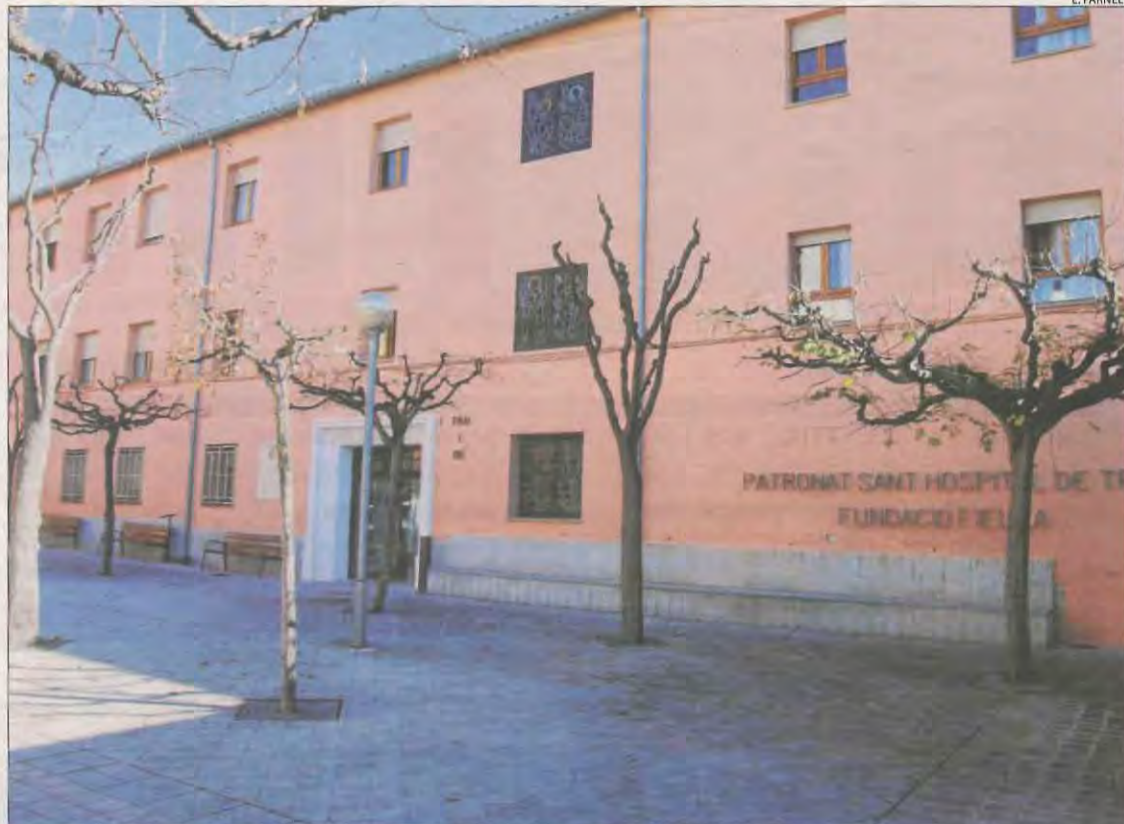
Imatge d'arxiu de la residència de Tremp, la setmana passada.

Fonts de Salut van apuntar ahir que des del passat 20 de novembre s'han derivat 19 residents a l'Hospital Comarcal del Pallars, a Tremp. Van afegir que la situació actual del centre "no és gens fàcil" i que qualsevol decisió "s'ha pres seguint tots els protocols sanitaris". No