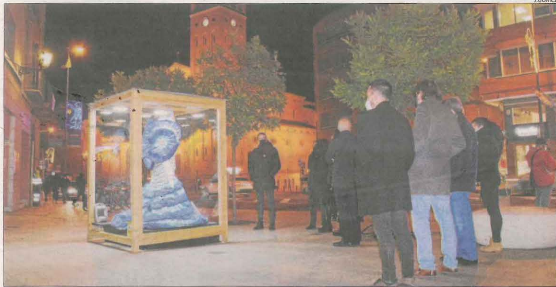
La corporació local va visitar ahir la nova exposició.