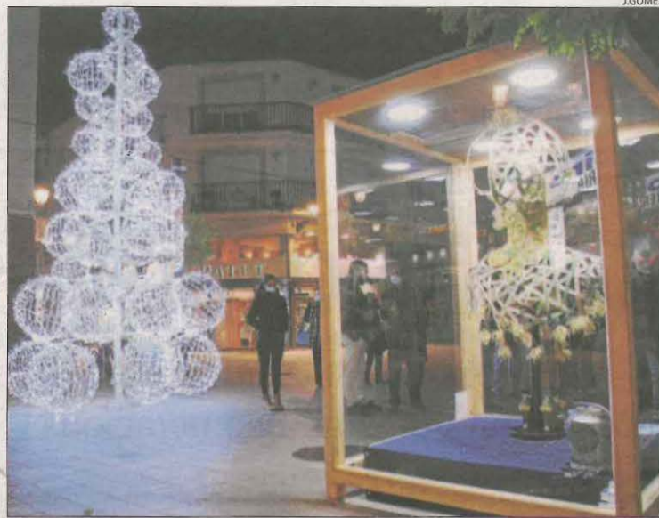
El públic ja pot admirar els dissenys, ubicats al centre.