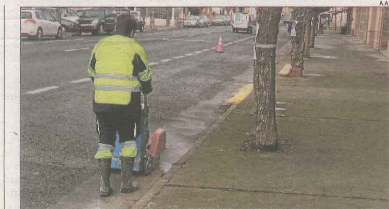
Els treballs previs a la travessia de l'N-230 a Alfarràs.