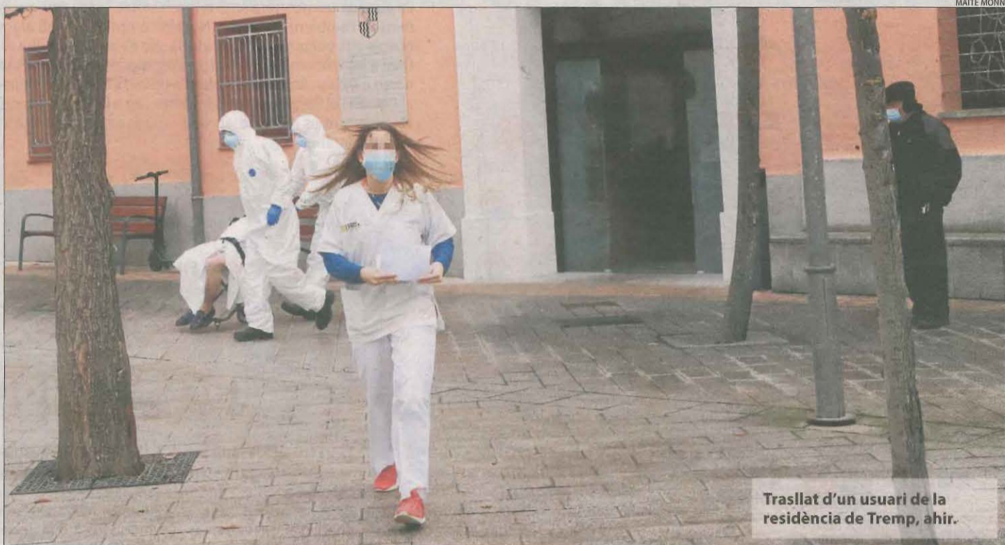
Trasllat d'un usuari de la residència de Tremp, ahir.

Quatre de cada cinc difunts a la residència de la Fundació Fiella a Tremp van morir dins del mateix centre. Són 44 persones, davant les 11 que van morir a l'hospital comarcal, situat a escassos metres. Així ho va explicar ahir la consellera de Salut, Alba Vergés, a l'assegurar que el geriàtric està equipat per prestar-los assistència i que traslladar-los o no són "decisions clíniques".