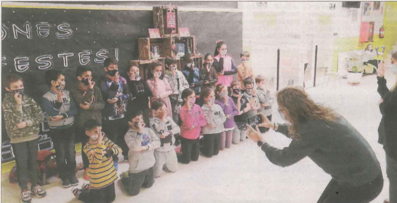
Els alumnes de l'escola Comtes de Torregrossa, a Alcarràs, han cantat la melodia de 'La Marató' en llenguatge de signes.

Encara que moltes propostes se celebraran diumenge vinent, coincidint amb l'emissió del programa, Ponent ja ha recaptat més de 5.500 euros per contribuir en la lluita contra el virus. Entre aquestes activitats destaquen les organitzades per Club Caminants de Sudanel, que ha aconseguit 1.407 euros amb una caminada, una xocolatada i un sorteig de cupons de regal en establiments locals.