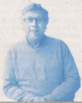
Els partits de dreta i extrema dreta estan tolerant el messianisme feixista

H om es pregunta: com és possible que joves d'entre 20 i 30 anys s'emmirallin amb la simbologia nazi, s'hi manifestin, en facin la salutació i combreguin apassionadament amb la seua criminal ideologia? Com deia aquell qui no coneix la seua història està condemnat a repetir-la, en podria ser un motiu molt genèric. La sociologia, la psicologia, la psiquiatria i fins i tot l'antropologia tenen moltes explicacions plausibles per a aquest fenomen: la reproducció ideològica i maneres de fer de l'entorn familiar o, per contra, com una forma de rebel·lió contra la classe social d'origen, fins al fet d'haver-se criat i educat en el massa poc o en el massa de tot. El més desconcertant, però, és que aquests individus es manifestessin, enmig d'una concentració de Vox a favor de la Constitució (que baixi Déu i ho vegi!) el dia de la Constitució! És surrealista! Quan la Constitució la defensen amb tanta vehemència els partits de dreta i d'extrema dreta m'ensumo que, passats els anys, hi han trobat el vestit a mida per continuar operant com si a la pràctica res important no hagués canviat des de les posicions de poder que tenien amb El Fuero de los Españoles del