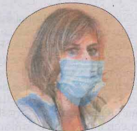
Consellera de Salut de la Generalitat

«Vam estar pendent des de l'inici de Tremp, però no vam intervenir fins que va quedar sense direcció»