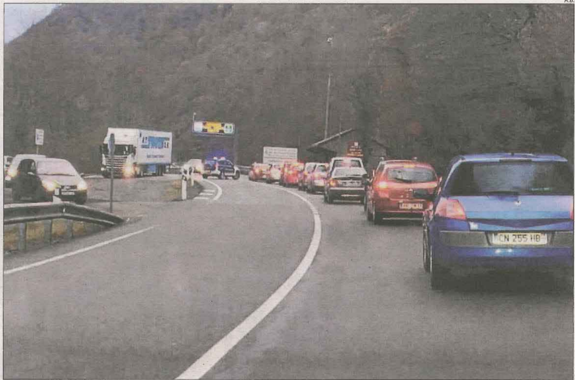
Cues de conductors francesos ahir a Eth Portilhon que no van poder passar a la Val d'Aran.