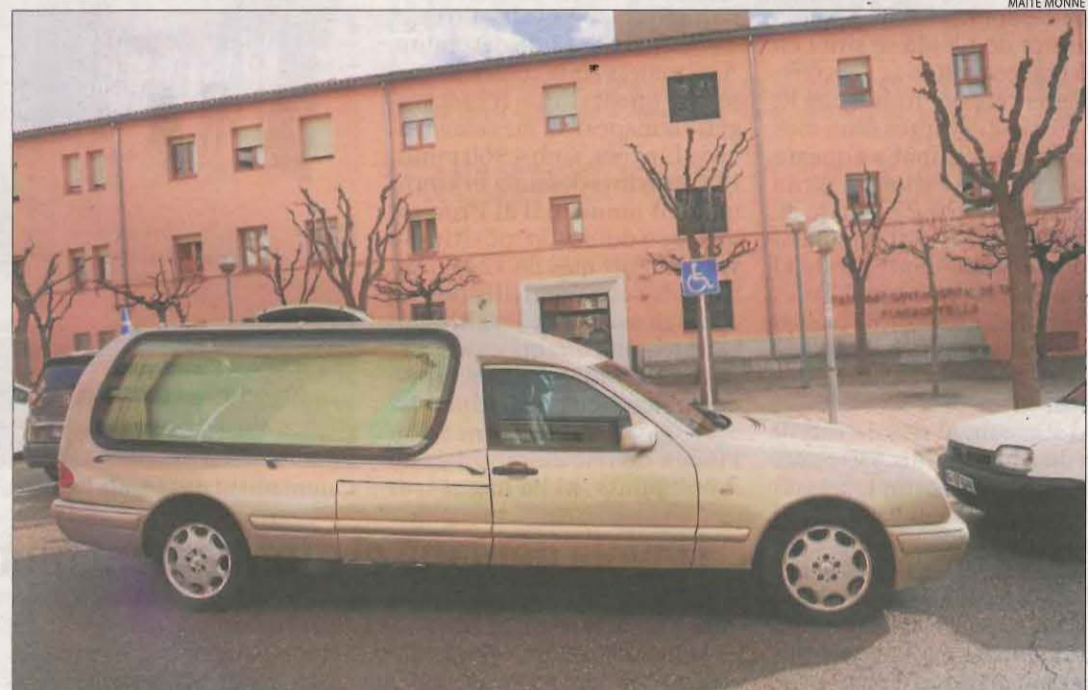
Un cotxe de morts, ahir a les portes de la residència de la Fundació Fiella a Tremp.

D'altres es van preguntar "qui es responsabilitza de la situació" i van qualificar el succeís com "una cosa molt forta" i "poc agradable". Així mateix, van apuntar que la situació és "dura", creuen que "hi ha ha-