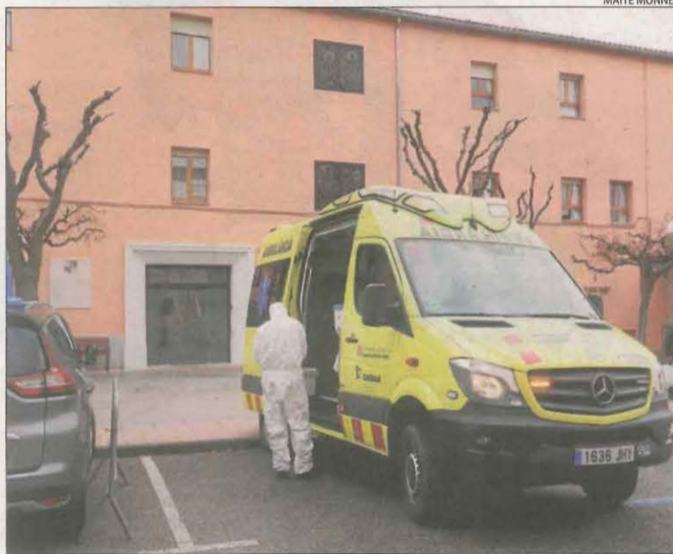
Una ambulància per traslladar un resident a l'hospital.

Un total de 44, davant 11 a l'hospital i Salut ho atribueix a "decisiones clíniques"