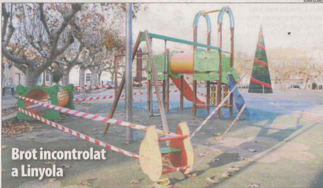
Brot incontrolat a Linyola

El 12,2% dels lleidatans, unes 53.000 persones, ha generat anticossos del coronavirus, segons la quarta onada de l'estudi de seroprevalença que va fer públic ahir el ministeri.