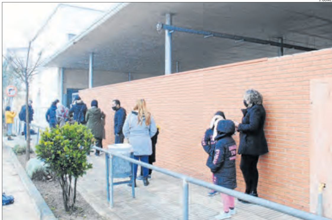
Les famílies de Linyola fent cua per poder participar en el cribratge al col·legi.

Així mateix, l'alcalde del municipi va reiterar que el consistori s'ha coordinat amb els Mossos d'Esquadra i el Procicat perquè la mobilitat comarcal, en vigor aquest cap de setmana a tot el conjunt de Catalunya, no s'apliqui a Linyola. També va voler agrair la tasca que duen a terme els voluntaris de Creu Roja Pla d'Urgell, que porten a terme diferents tasques de sensibilització entre els veïns i també reparteixen mascaretes. El primer edil va apuntar que el brot "ja ha començat a ser frenat", però va subratllar que la situació encara "continua estant descontrolada".