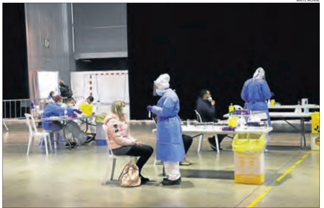
Una dona se sotmet a un test ràpid en el cribatge dut a terme ahir a les Borges.

Una vegada s'hagi finalitzat la campanya de vacunació a les residències, serà el torn del personal dels hospitals, centres sanitaris i sociosanitaris. Després es prepararà l'estratègia per a la resta de població.