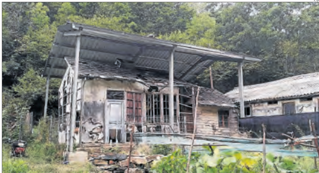
L'hospital de cartró, protegit de la intempèrie per una coberta de xapa.

La compravenda arriba després de més d'un any de converses entre l'ajuntament i Endesa sobre com assegurar la conservació de l'hospital de cartró. Després de temptejar la possibilitat d'una gestió conjunta, el consistori va optar finalment per plantejar la compra de l'immoble. L'empresa, per la seua part, va accedir a valorar