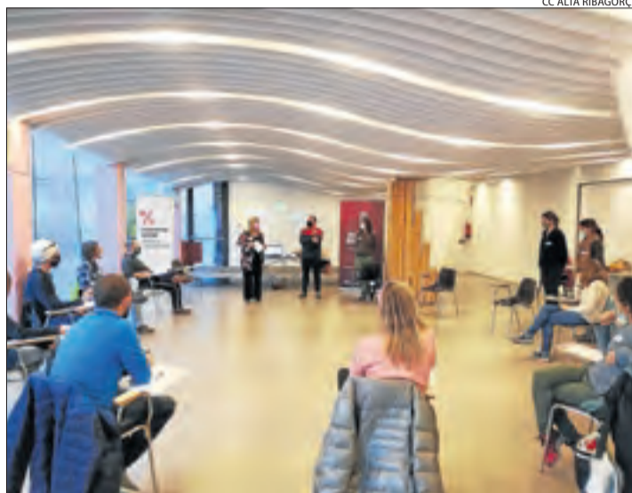
Presentació del projecte aquesta mateixa setmana.

Els elegits rebran una formació i acompanyament per dissenyar les respectives campanyes de comunicació i micromecenatge, necessaris per assolir l'objectiu de finançament