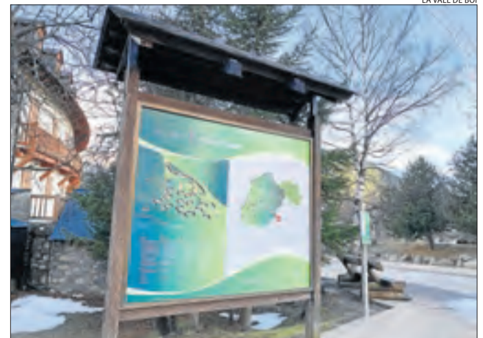
El plafó que ja s'ha instal·lat al Pla de l'Ermita.