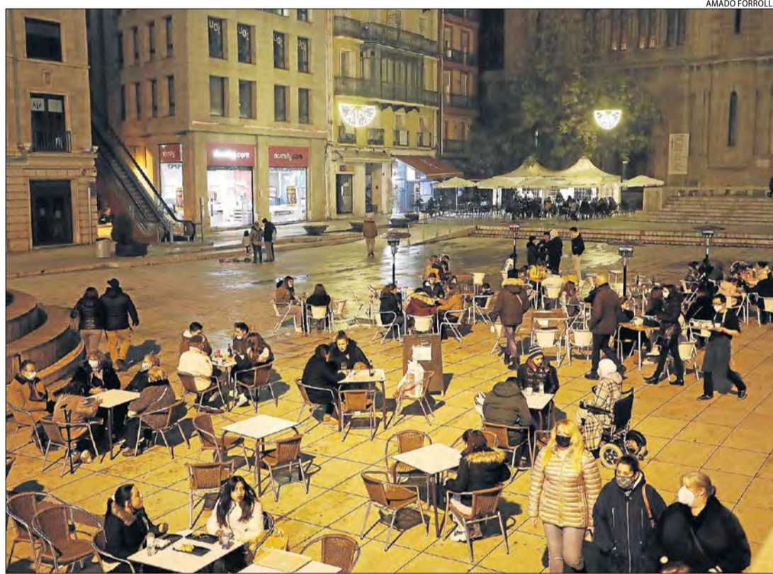
Terrasses ahir pràcticament plenes a Sant Joan. Demà només podran obrir quatre hores i mitja.

Així mateix, el tancament comarcal també va impedir que clubs d'esquí del Jussà poguessin practicar a les seues pistes de referència al trobar-se al Sobirà. L'alcalde de la Pobla de Segur, Marc Baró, va remarcar la necessitat de flexibilitzar la mobilitat per "atendre els clubs" i permetre l'accés a pistes. Diversos alcaldes del Sobirà també van denunciar que es van fer controls de Mossos a Sort que prohibien l'accés a la comarca i a les pistes. L'alcalde de Rialp,