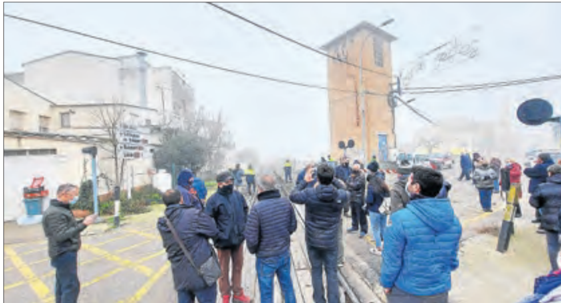
Unes cinquanta persones es van manifestar al costat de la via durant el tall de la infraestructura.

L'incident va afectar cinc usuaris que viatjaven al comboi, que va quedar aturat a l'estació de Tèrmens. Ferrocarrils va habilitar tres taxis i un bus per