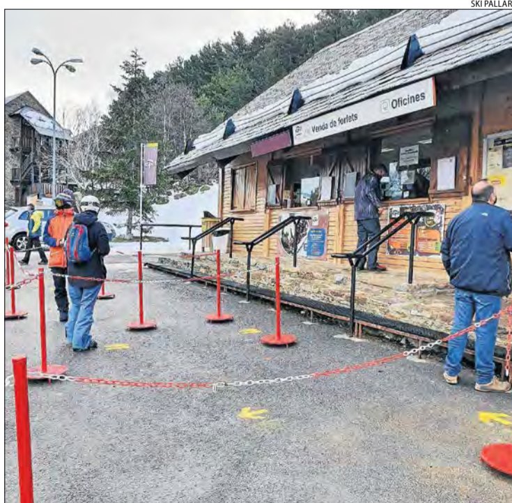
L'afluència d'esquiadors ahir a Espot va ser mínima.