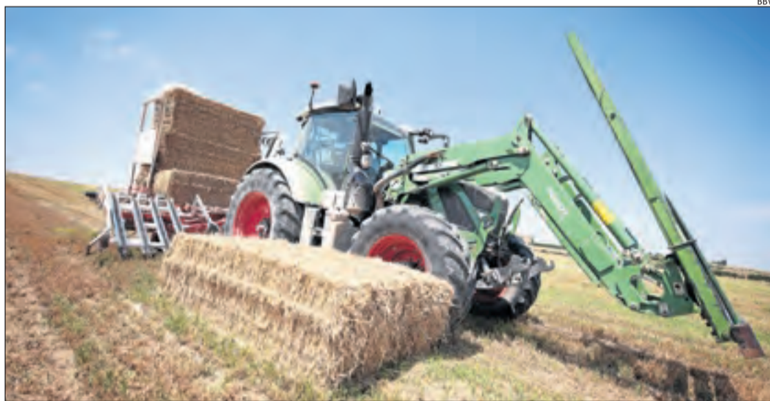
Abans de la crisi, ja ofería solucions per fomentar la tecnificació de l'activitat.

Davant la crisi de la Covid, els bancs són part de la solució. En el cas de BBVA, al març va posar a disposició de pimes i autònoms fins a 25.000 milions en línies de crèdit, alhora que ha donat suport a través de línies ICO avalades per l'Estat. En especial, l'entitat està compromesa amb el sector agro i fa costat a agricultors, ramaders, cooperatives i tots els productors. Per això, ha engegat diverses mesures amb l'objectiu de garantir la solvència de les pimes i empreses. Aquestes se sumen a les que ja ofería abans de la crisi. Solucions que s'adapten a l'estacionalitat, així com propostes específiques per impulsar la tecnificació de l'activi-