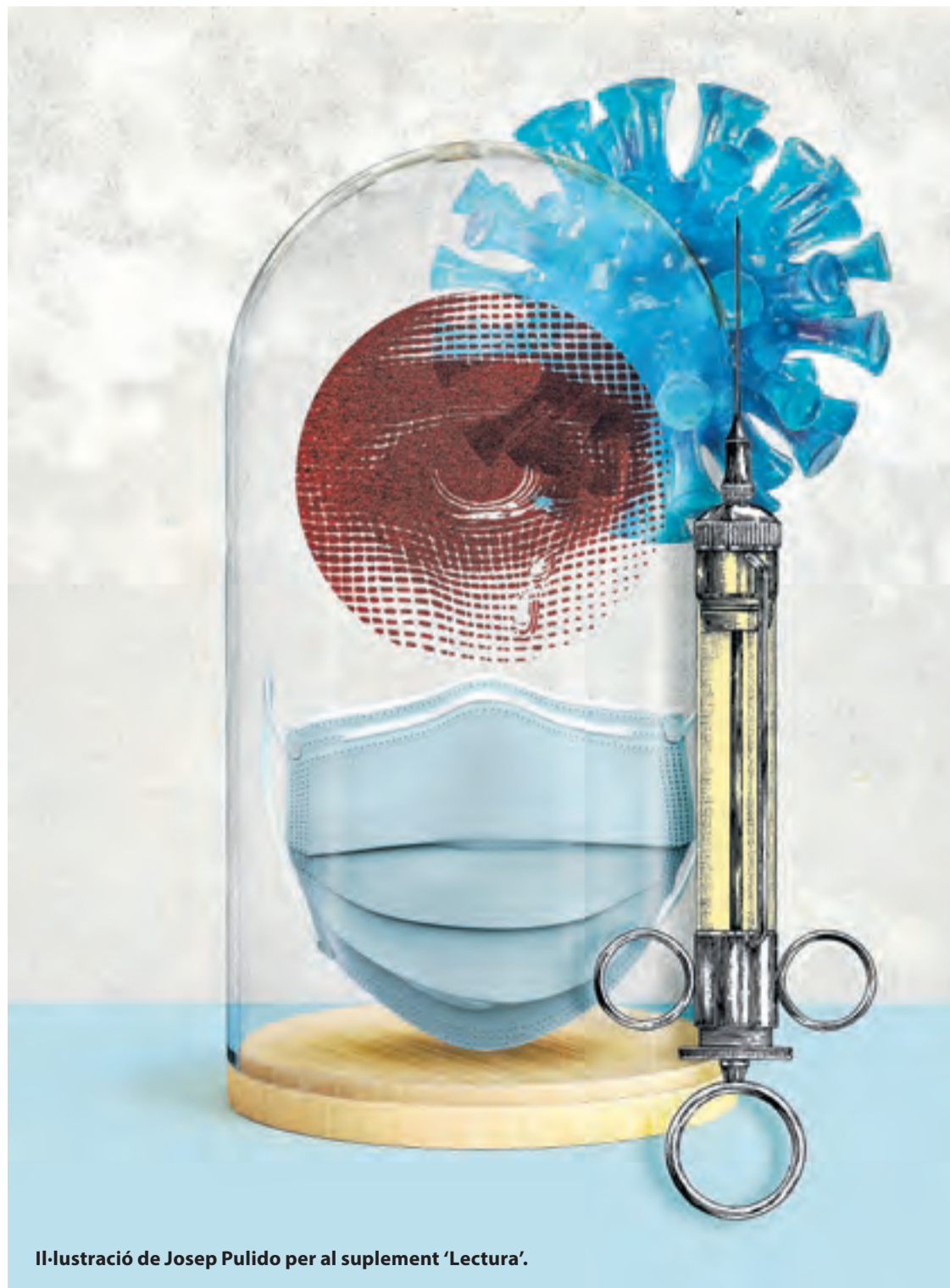
Il·lustració de Josep Pulido per al suplement 'Lectura'.

Queden quatre dies perquè acabi un any atípic marcat per la pandèmia de coronavirus, que va obligar a decretar l'estat d'alarma || L'arribada, avui, de la vacuna, una de les poques notícies esperançadores del 2020