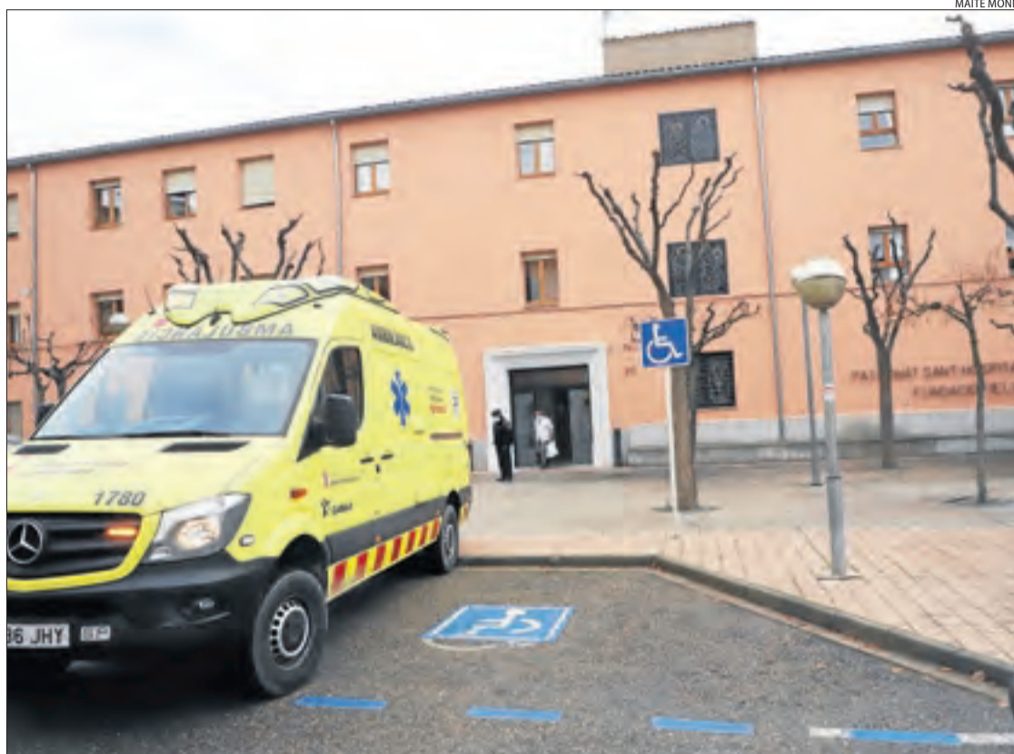
Imatge recent d'una ambulància estacionada davant la residència de Tremp.

Salut ha obert un expedient sancionador i Fiscalia investiga si hi va haver homicidis imprudents