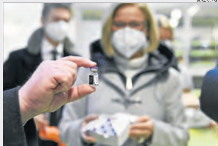
Un dels envasos de la vacuna repartits ahir a tota la UE.

Comença la vacunació || Avui a les 16 hores, al geriàtric públic de la Pobla de Segur i a Balàfia I