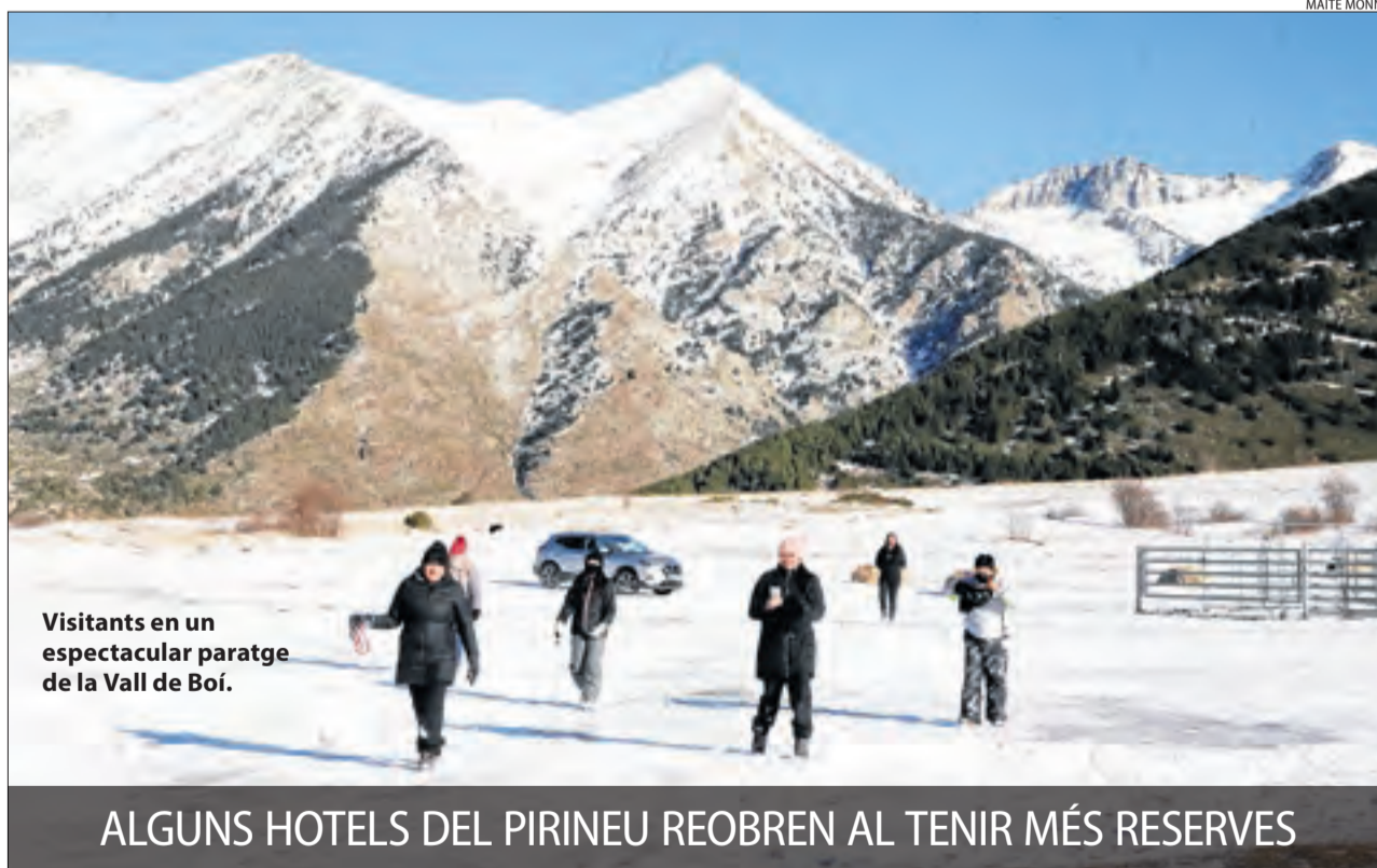
Visitants en un espectacular paratge de la Vall de Boí.

ALGUNS HOTELS DEL PIRINEU REOBREN AL TENIR MÉS RESERVES