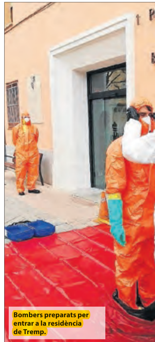
Bombers preparats per entrar a la residència de Trep.