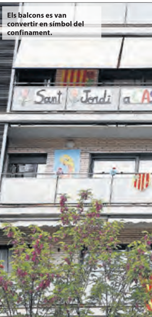
Els balcons es van convertir en símbol del confinament.

Per al poeta T.S. Eliot, "l'abril és el mes més cruel". I així va ser. La tancada forçosa no aconseguia doblegar la corba i va se-