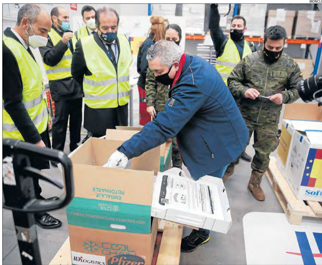
Personal de Pfizer i BioNTech entrega les dosis a tècnics de l'Agència Espanyola de Medicaments.

"Estem començant a girar la cantonada d'un any difícil. Aquesta campanya serà un commovedor moment d'unitat", va destacar en un vídeo