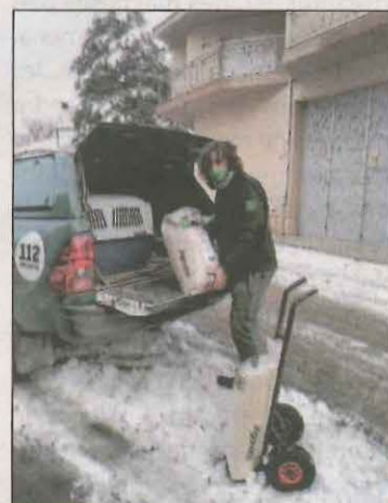
Agro Pijuan va donar dos sacs de blat a Tàrraga

des del consistori de la capital de l'Urgell van recordar que en episodis de neu i fred, els ocells silvestres ho passen malament i tenen dificultats per alimentar-se. És per això que si es deixa menjar d'ocells, llavors o molles de pa a la finestra o jardí, se'ls hi pot salvar la vida durant aquests dies complicats.