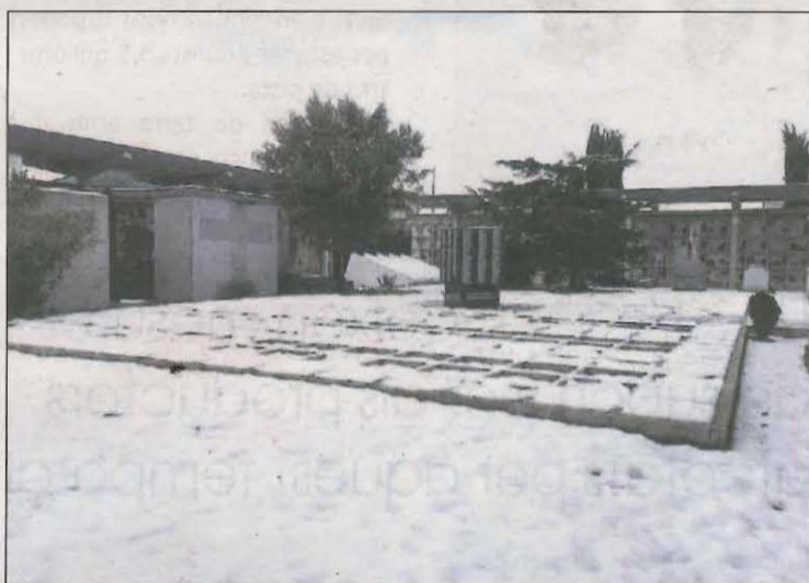
La neu que hi ha acumulada al cementiri de Lleida

Així mateix, mentre duri l'onada de fred i les gelades, les brigades municipals i els diferents equips (Il·net, Jardineria, Protecció Civil, Brigada d'Acció Immediata) estendran fundents per la capital del Segrià per tal d'evitar la formació de possibles plaques de gel i minimitzar riscos d'accidents de trànsit i de caigudes de vianants.