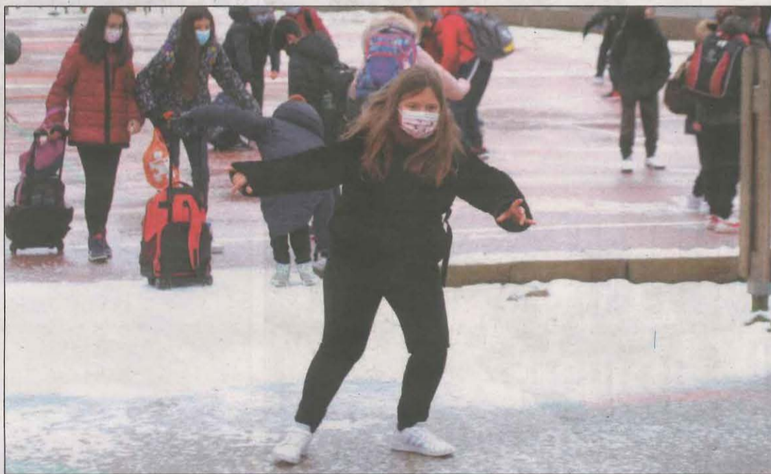
Les plaques de gel van provocar més d'una relliscada durant l'arribada a l'escola

En total a Catalunya, a causa del temporal Filomena un total de 53 escoles i instituts de les comarques de Ponent, Camp de Tarragona, Terres de l'Ebre i Girona no van poder obrir ahir, fet que va afectar 3.182 alumnes. Pel que fa al transport escolar, es van suspendre en 14 comarques.