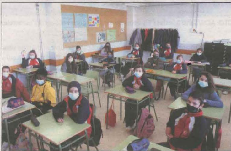
Aula del Manuel de Montsuar ahir, ben calefactualada

Pel que fa avui, s'espera que la situació sigui més favorable i la majoria d'escoles puguin tornar a obrir. De moment, els Consells Comarcals del Segrià, la Noguera, la Segarra, el Pla d'Urgell i l'Urgell han anunciat que reprendran el transport escolar avui mateix. També ho faran els municipis de les Garrigues excepte les rutes del Cogul, la Pobla de Cérvoles i el Vilosell. Al Pallars Jussà ho decidirà cada conductor avui a primera hora, depenent com estiguin les carreteres.