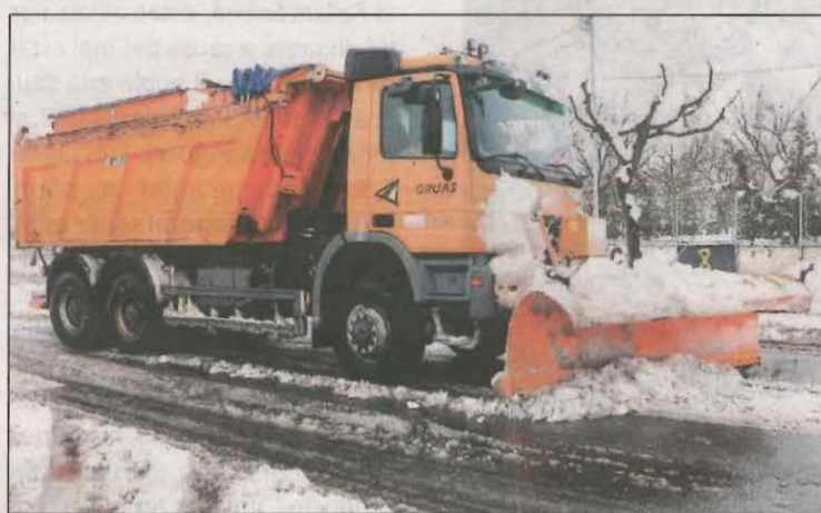
Imatge d'una màquina llevaneu netejant la calçada a Tàrraga

El conseller del Departament d'Interior va remarcar que no es pot relacionar aquesta mort amb el temporal Filomena. A la incidència hi van treballar efectius del SEM, dels Bombers i dels Mossos.