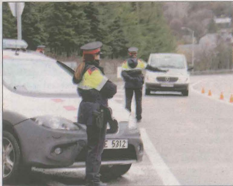
Imatge d'arxivi d'un control dels Mossos a Sort

Des de CCOO expliquen que hi ha un grup de mossos que està finalitzant el curs de Trànsit, però consideren que "la seva incorporació no serà suficient per cobrir la manca de personal que hi ha a l'especialitat". Durant el confinament de la Cerdanya i el Ripollès s'ha disposat dels agents en pràctiques, però, tot i això, no s'han pogut cobrir els serveis mínims, segons el sindicat. A més, aques-