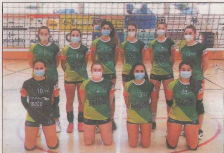
El equipo de 1ª Catalana del club leridano

El Autoescuela Motocar Balàfia Vòlei regresa a la competición con un triunfo