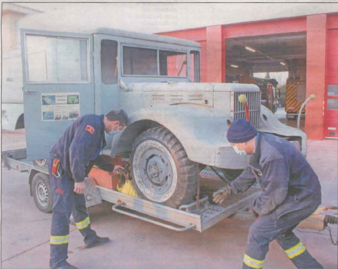
El Dodge WC51 se fabricó en Detroit y participó en la Segunda Guerra Mundial

Los Bombers restauran un camión del año 1945 que ‘luchó’ contra Hitler