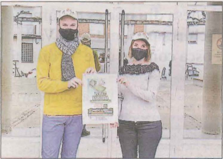
El consistori s'adhereix a la campanya d'Afanoc

suposa la renovació del material bàsic que permet millorar les condicions de la instal·lació de cara als seus usuaris. La gent gran és un dels pilars a on el consistori i la fundació privada volen seguir cooperant i, en aquest cas, per invertir en millorar un dels espais d'oci de dia amb més tradició per aquest sector de la societat al municipi de Vielha.