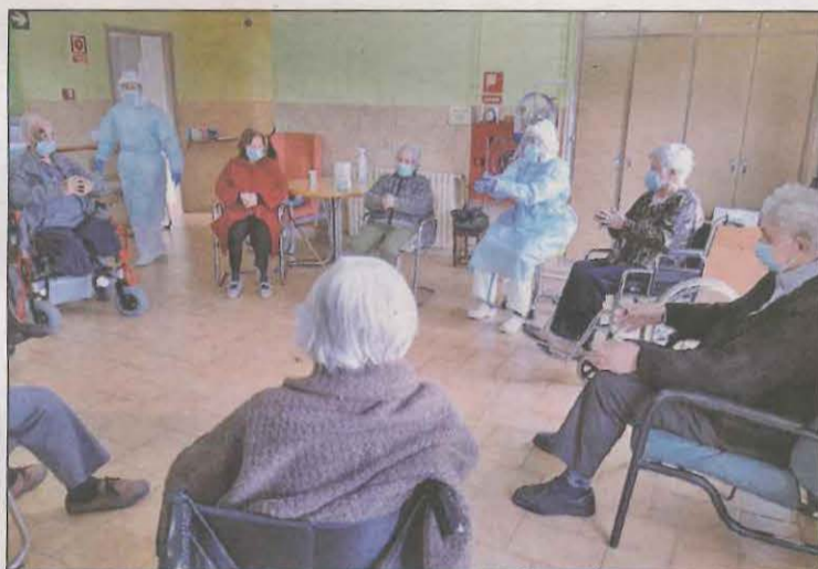
Actualment, el brot té 86 casos actius

La residència Hospital Pere Màrtir Colomé de Solsona ha registrat una nova mort i la xifra total de víctimes s'eleva a 21 des que es va detectar el brot de Covid-19 a finals de desembre. És la segona mort que es registra en les últimes 48 hores. Ahir dilluns es va fer un cribratge a tot el personal de la residència, incloent-hi part dels treballadors que van donar positiu el 8 de gener. Segons informen des del centre, els professionals que estaven de baixa per Covid-19 s'estan reincorporant de forma progressiva. Concretament, una dotzena de treballadors ja