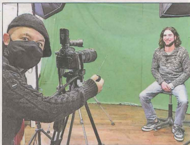
Una de les persones que participa al projecte

La teulada d'una casa de Tremp va esfondrar-se ahir de forma parcial i va acabar cedint part de la coberta de l'immoble, que va acabar caient al carrer, tot i que no va haver-se de lamentar danys ni afectacions personals. Pel que fa als fets, van succeir ahir a les 16.00 hores al carrer Ramon Soldevila i van treballar-hi tres dotacions.