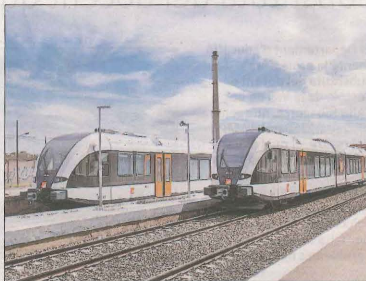
Imatge d'arxiu de dos trens de FGC a l'estació de Balaguer

Aquest és el primer pas que s'ha realitzat després que al desembre el Govern encarregués a Ferrocarrils la millora dels serveis ferroviaris de la línia Lleida-Manresa, que acumula anys de queixes i demandes de millora per part dels alcaldes afectats per la