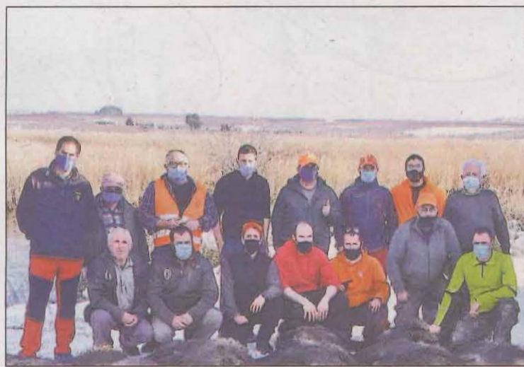
Els caçadors que van participar a la batuda

Un grup de caçadors de Torres de Segre (Segrià) van abatre la setmana passada a l'entorn de l'embassament d'Utxesa 34 porcs senglars, una xifra rècord al municipi en un control biològic com aquest. L'actuació, que es va dur a terme amb l'objectiu de reduir la població d'aquesta espècie al terme municipal, va comptar amb l'ajuda de gossos, la coordinació dels Agents Rurals i la supervisió de tècnics de l'Ajuntament de Torres de Segre. La batuda es va fer a la zona del 'Mirador elevat del 19' d'Utxesa, una zona on habitualment es concentra un nombre elevat de porcs senglars. La disminució intencionada del nivell de l'aigua va facilitar l'acció destinada a controlar la superpoblació d'aquesta espècie.