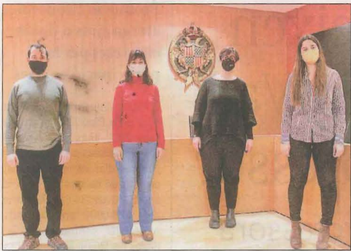
Salla es va incorporar ahir a la plantilla de l'ens