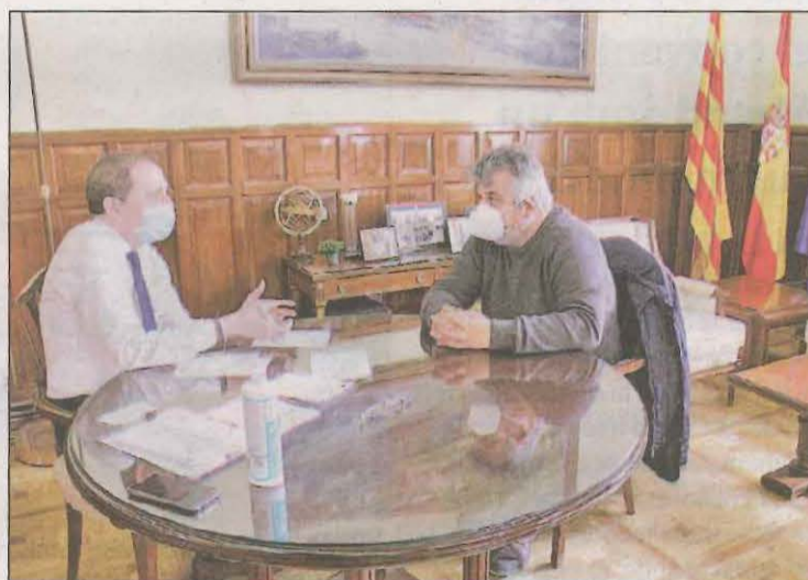
Imatge de la reunió d'ahir a la subdelegació