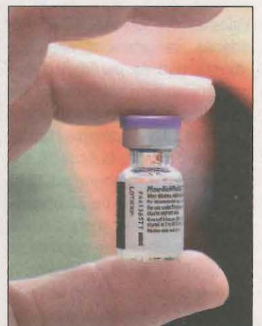
La vacuna de la farmacèutica Pfizer

no n'especifica el percentatge ni el nombre. El conveni recorda que la CE va acordar que països de l'entorn europeu es poguessin beneficiar dels contractes subscrits pels estats membres amb les farmacèutiques, i que l'acord "reconeix el dret dels Estats membres participants a revendre les dosis de vacuna a tercers països".