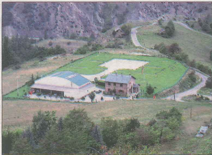
Imatge d'arxiu de l'heliport de Tírvia, al Pallars Sobirà