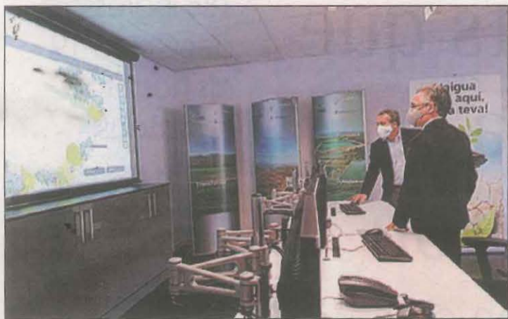
El conseller d'Empresa va visitar ahir Tàrrrega