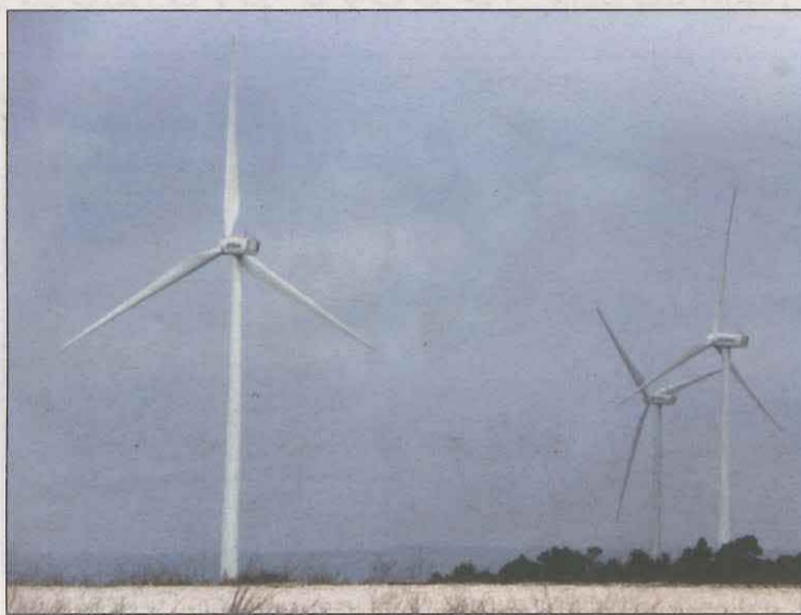
Imatge d'arxiu de molins de vent a Talavera, la Segarra

Lleida ACN La Denominació d'Origen (DO) Costers del Segre i la Ruta del Vi de Lleida van fer públic ahir un manifest conjunt en què denuncien la "massificació" de centrals eòliques i solars a les comarques lleidatanes. En el text, defensen "la transició energètica cap a les energies renovables" i en aquest sentit, demanen a les administracions "un model de planificació responsable, amb una visió global del territori que respecti el valor paisatgístic i mediambiental i que valori les activitats lligades al territori". La DO Costers del Segre i la Ruta del Vi de Lleida apleguen una quarantena de cellers, i una seixantena d'entitats d'entornisme públiques i privades, respectivament.