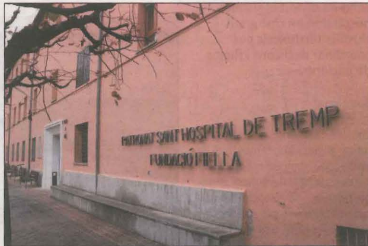
Façana de l'entrada de la residència Fiella de Tremp

Cal recordar que la Fiscalia va obrir diligències el 22 de desembre per investigar si la direcció del centre hauria comès delictes d'homicidi imprudent per la mort de 61 residents i també un delictes contra la seguretat en el treball. Ho va fer