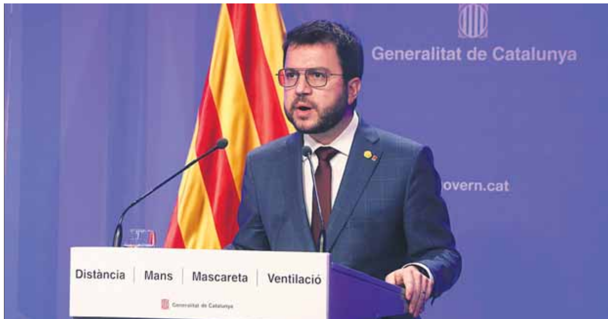
Pere Aragonès, en la seva compareixença del dia 20, després de decretar l'ajornament de les eleccions

L'espiral de retrets, declaracions, rèpliques i acusacions diverses sobre quan s'acabaran fent les eleccions catalanes i qui és el responsable, o responsables, de la situació d'incertesa que s'ha generat al voltant de la cita electoral no només està lluny de remetre, sinó que s'aviva per moments. Ahir va ser el vicepresident del govern en funcions de president, i alhora candidat d'ERC, Pere Aragonès, l'encarregat de afegir llenya al foc quan, aprofitant una entrevista a TV3, va assenyalar l'existència d'una “operació d'estat” per afavorir una victòria del PSC. Segons la seva tesi, en aquesta tessitura, els socialistes serien els encarregats de dictar l'estratègia a seguir, com ara la impugnació judicial del decret d'ajornament, mentre “uns altres fan la feina”, una referència que perfectament podria anar adreçada al TSJC. Per la seva banda, la consellera de la Presidència, Meritxell Budó, va centrar la seva crítica en la situació de provisionalitat que ha suscitat la resolució d'aquest mateix tribunal. “La campanya comença la setmana que ve, sense cap garantia sobre la data de les eleccions. I això és una vulneració del dret a la parti-