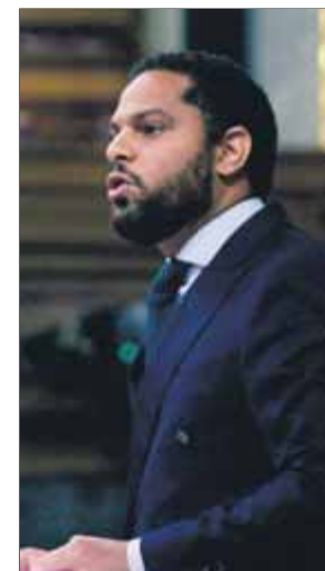
Ignàcio Garriga és candidat de Vox al Parlament

oferir "el manual del perfecte delinqüent", perquè "ensenyava amb evident pedagogia pràctica i legal a cometre altres delictes" com ara el d'usurpació (article 254 del Codi Penal), danys (263 i següents), estafa (248 i següents), atemptat contra l'autoritat i desobediència (550 i següents) i desordres públics (557 i següents). Vox no ha ocultat mai que té la il·legalització de l'independentisme com a objectiu, però al Congrés va quedar sol al setembre quan la seva proposició de llei no va rebre ni el sí del PP i Cs, que es van abstenir. ■