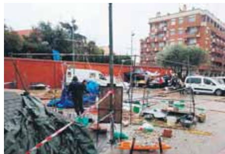
Vidres trencats a Sabadell, arbres caiguts a Argentona i parades malmeses al mercat d'Olesa de Montserrat són alguns dels rastres que ha deixat la fogonada

arribar als 114,8 km/h i a Alguairó (Segrià) i Cervera (Segarra) els cops de vent van assolir els 107,6 km/h. La rapidesa del pas del front va fer que les quantitats de pluja recollides fossin molt menors i no van arribar al 10 l/m 2 en cap indret, en alguns, en forma de calamarsa.