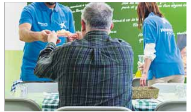
Voluntaris de La Caixa fent activitats al menjador social El Tupí, a Vic, en una imatge d'arxiu

fer caure a sobre de cotxes en diversos municipis. Es van haver de retirar els vidres de l'aparador d'una botiga a Sabadell (Vallès Occidental), on també van volar les banderes de la ciutat i d'Espanya a l'edifici de l'ajuntament. A Olesa de Montserrat (Baix Llobregat) les ventades van causar destrosses al mercat setmanal. ■