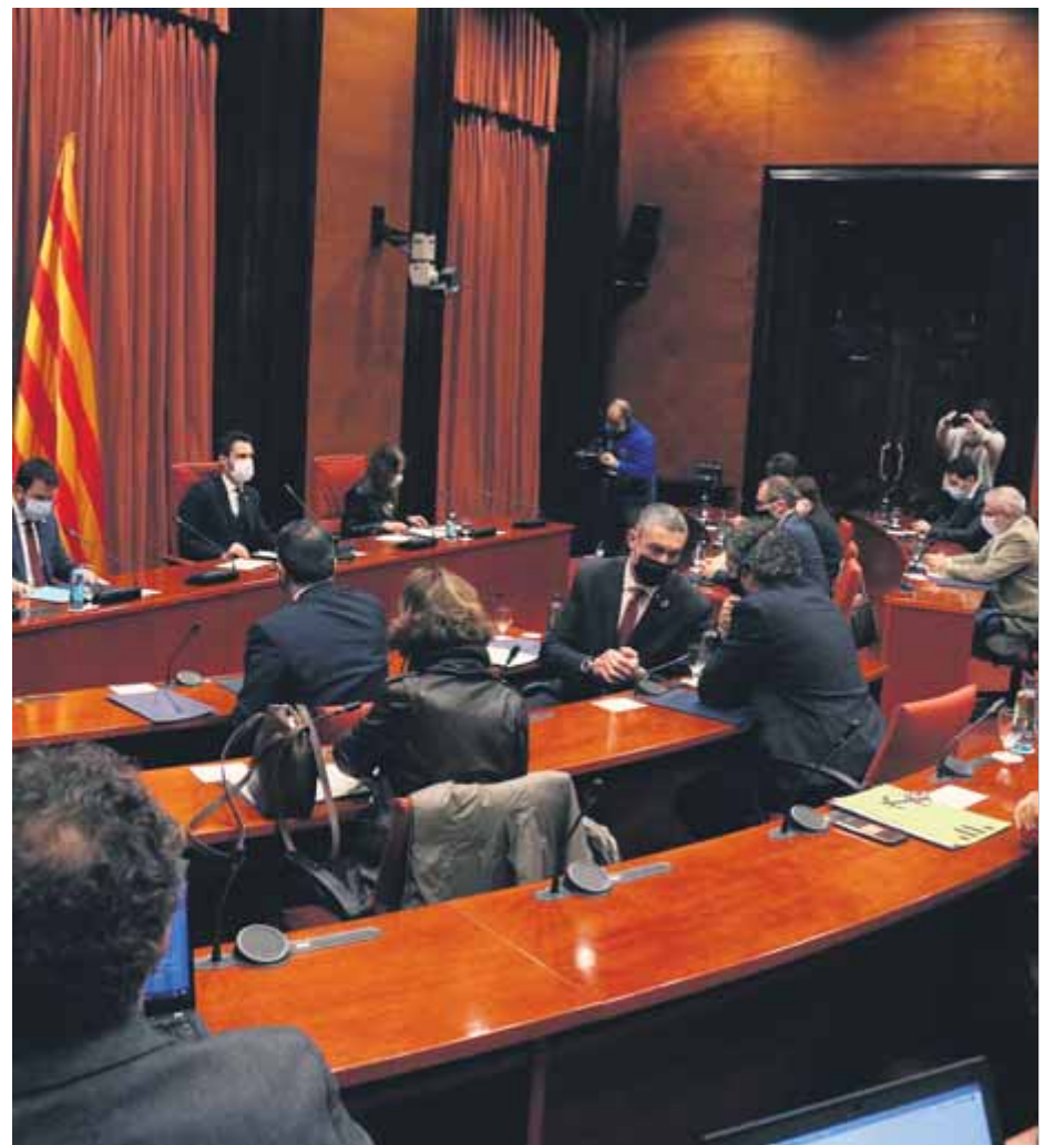
La taula de partits, reunida divendres passat al Parlament

El parer de la majoria del TSJC, però, és que no s’ha de demorar l’exercici del dret de sufragi, especialment perquè no hi ha president de la Generalitat, el Parlament està dissolt i la convocatòria alternativa és “tres mesos i mig després”, el 30 de maig. Hi afegeix que en el fet de mantenir les eleccions el 14-F “s’ha valorat que hi ha un interès públic molt intens en la celebració de les eleccions suspeses, perquè si no se celebren s’obre un període prolongat de provisionalitat que afecta el normal funcionament de les institucions democràtiques”. En la resolució s’insisteix força en la situació política actual, que qualifica de “bloqueig i precarietat institucional que afecta la legitimació del govern, fet que és rellevant amb la crisi sanitària que obliga a adoptar deci-