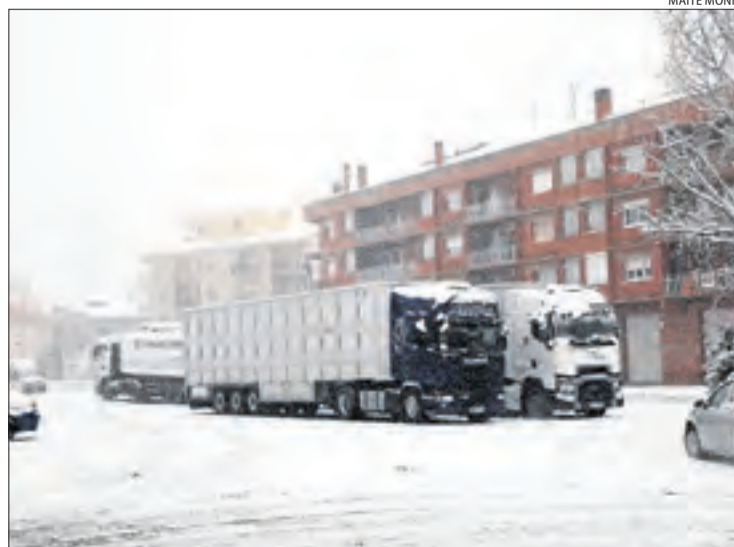
Camions aparcats a Bellpuig.