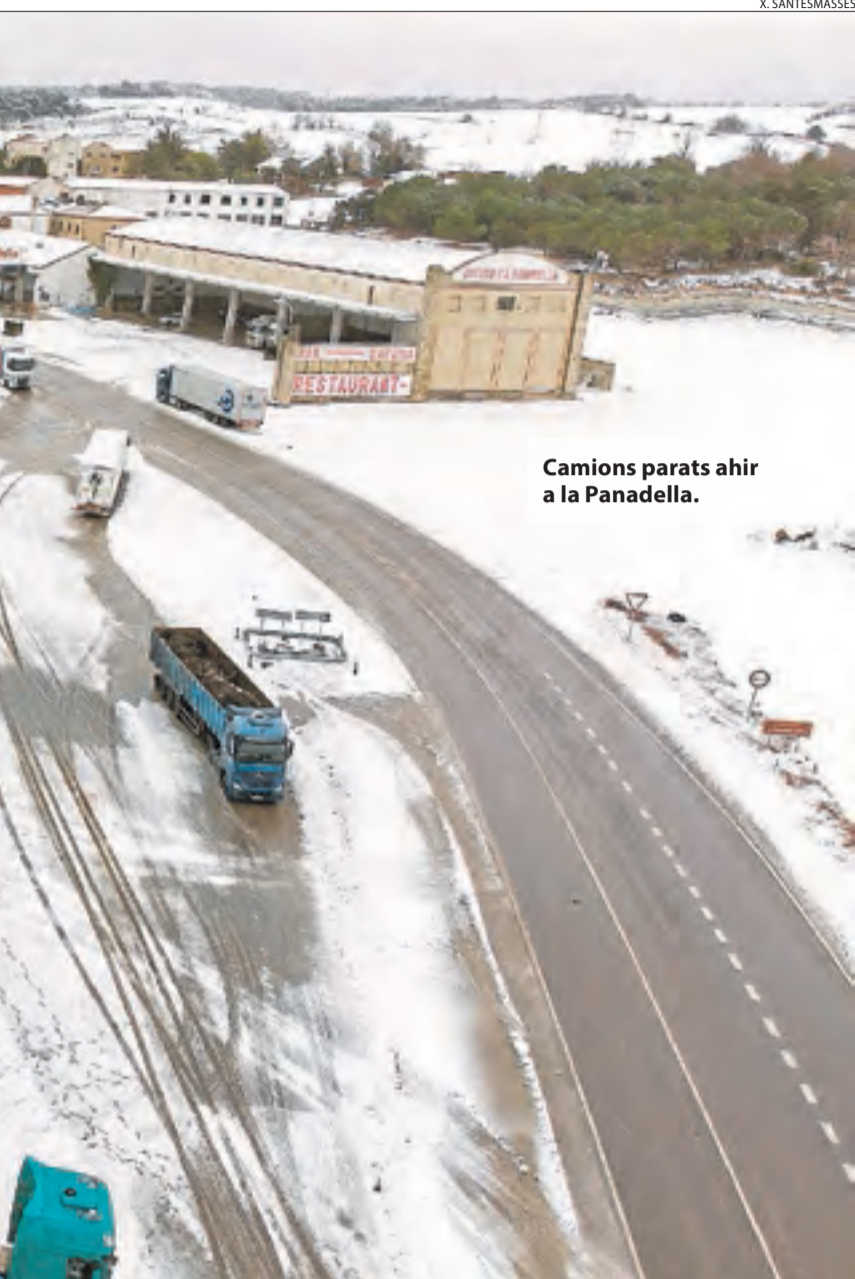
Camions parats ahir a la Panadella.