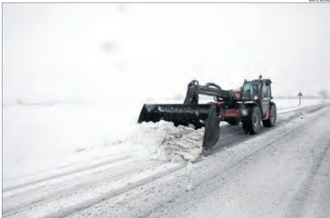
La circulació per les carreteres de Lleida va ser molt complicada i es va haver de retirar la neu.