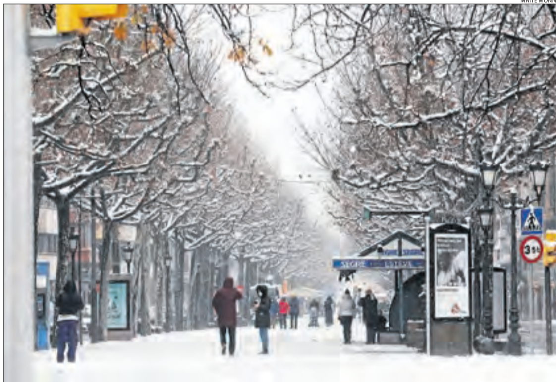
Imatge de la rambla Ferran a Lleida ciutat, que ahir va aparèixer coberta de neu.

■ En el conjunt d'Espanya, Filomena va deixar ahir quatre víctimes mortals. Madrid es va quedar totalment paratitzat, amb milers de vehicles atrapats a les carreteres de la comunitat i l'aeroport de Barajas tancat.