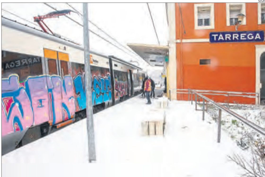
El tren de la línia de Manresa que va parar ahir a Tàrrrega al migdia procedent de l'Hospitalet.