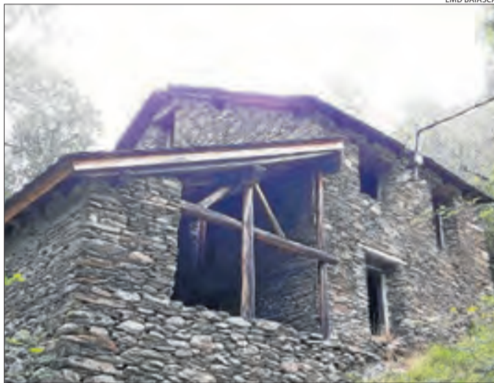
L'antic edifici que acollia el molí, la serradora i la central.

BAIASCA | L'EMD de Baiasca ha donat llum verda a la rehabilitació de la coberta de l'edifici de l'antic molí de farina, serradora i central hidroelèctrica. Es tracta d'un edifici que és patrimoni comunal de l'EMD i que el 2020 va ser declarat Bé Cultural d'Interès Local (BCIL). L'objectiu de la població és consolidar la teulada per