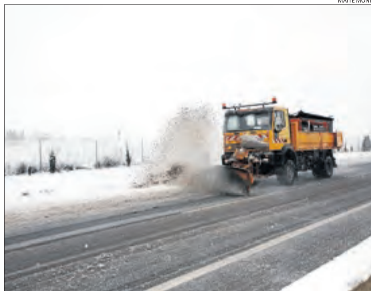
Una màquina llavanen ahir al matí a l'LI-11.