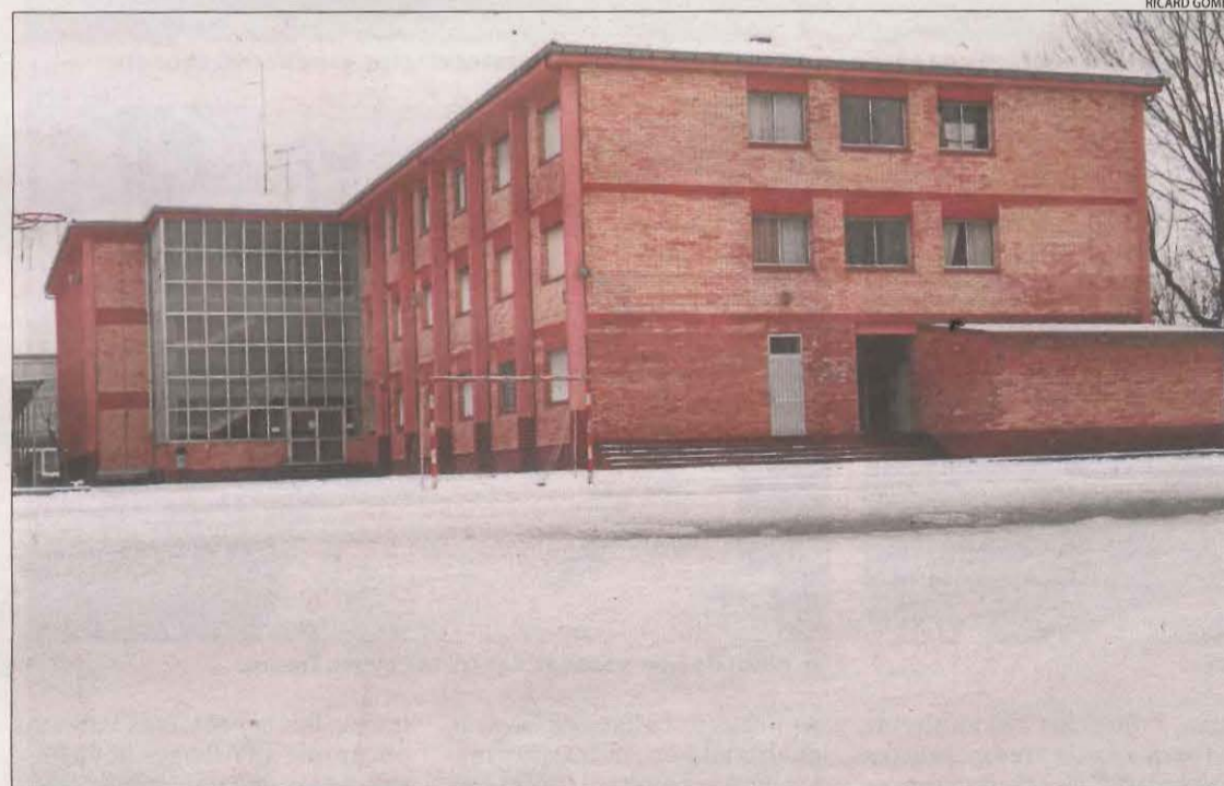
El pati de l'institut Terres de Ponent de Mollerussa, cobert ahir de neu.