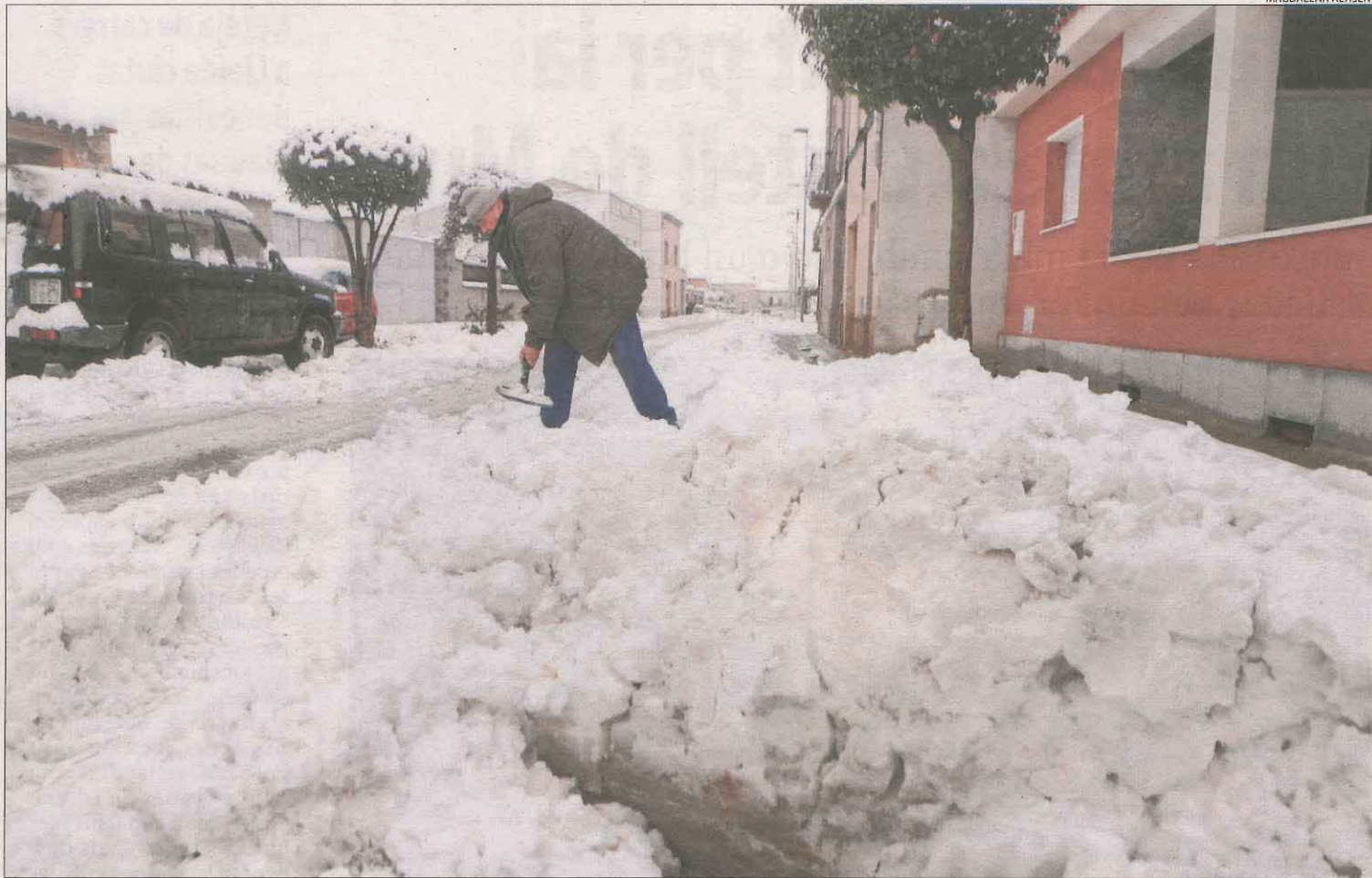
Anglesola. Els veïns van agafar rasclets i pales per retirar la neu acumulada a les vores per facilitar la mobilitat.