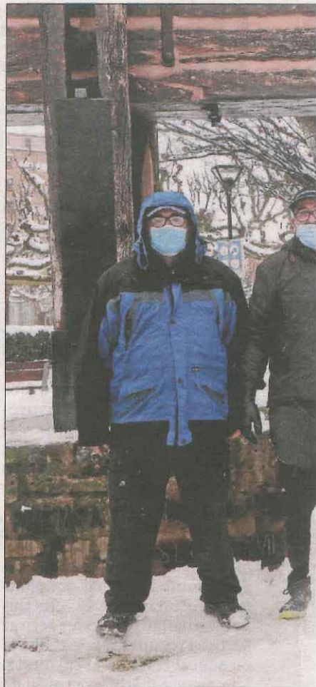
Les Borges Blanques. Els veïns de la cap...