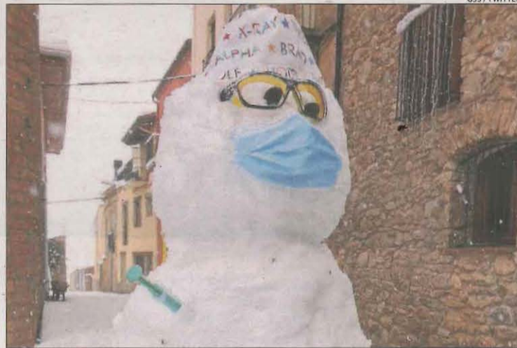
Un ninot de neu 'vacunat' contra la Covid a Tremp.

X. RODRÍGUEZ / REDACCIÓ LLEIDA | El temporal va començar a amainar ahir, encara que durant la jornada va continuar nevant. Això va provocar talls de llum en diversos municipis i va obligar a tancar 11 carreteres, entre les quals la C-14 a Tàrrrega, i a circular amb cadenes per més de cent trams de vies de Lleida. Filomena ha deixat, entre dissabte i ahir, fins a mig metre de neu en municipis com la Pobla de Cérvoles o el Vilosell i gairebé 60 centímetres a l'Alta Ribagorça. Malgrat que el temporal Filomena ja va a la