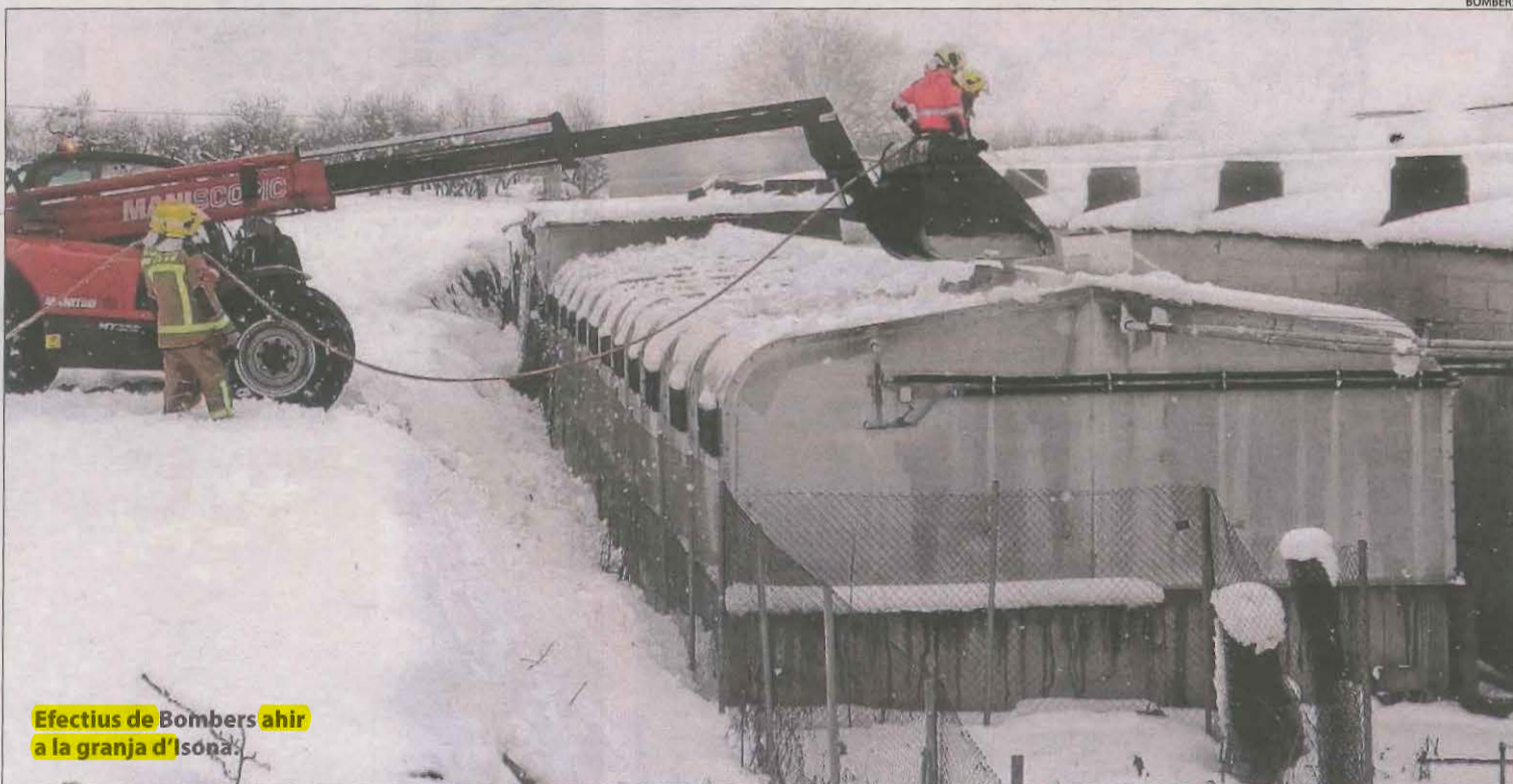
Efectius de Bombers ahir a la granja d'Isona.

A Mollerussa, els Bombers van traslladar dos persones d'edat avançada al CAP mentre que en localitats com Cubells i Bellaguarda van ajudar a traslladar material sanitari. També amb les vacunes per a la Covid (més informació a la pàgina 12).