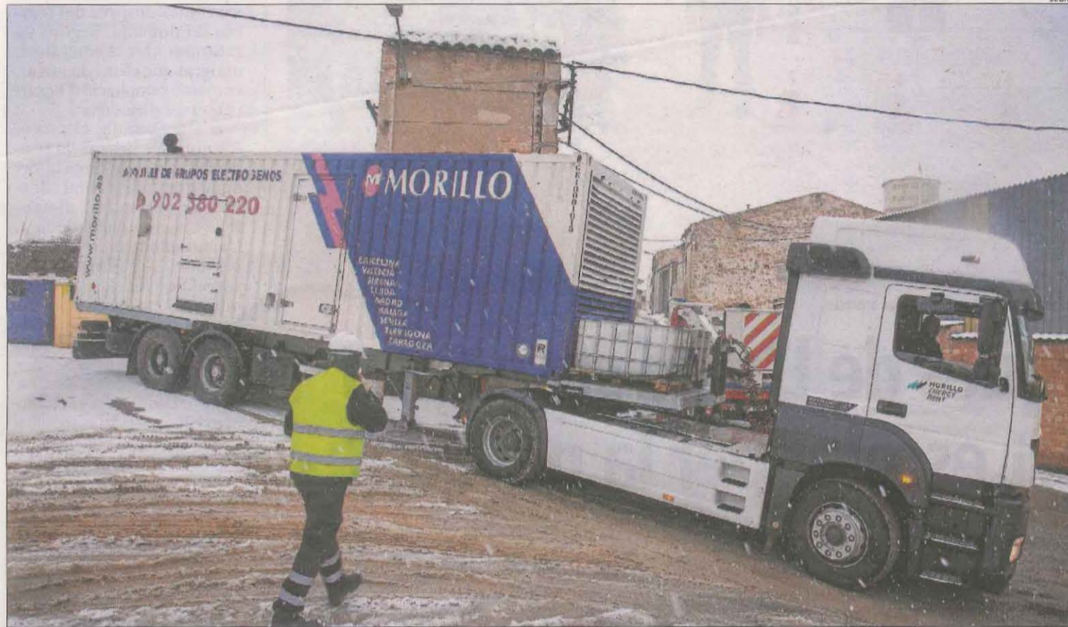
L'arribada d'un dels tres grups electrògens a Agramunt, on una avaria va deixar sense subministrament elèctric gairebé 690 abonats.

El temporal deixa fins a mig metre de neu en municipis de les Garrigues