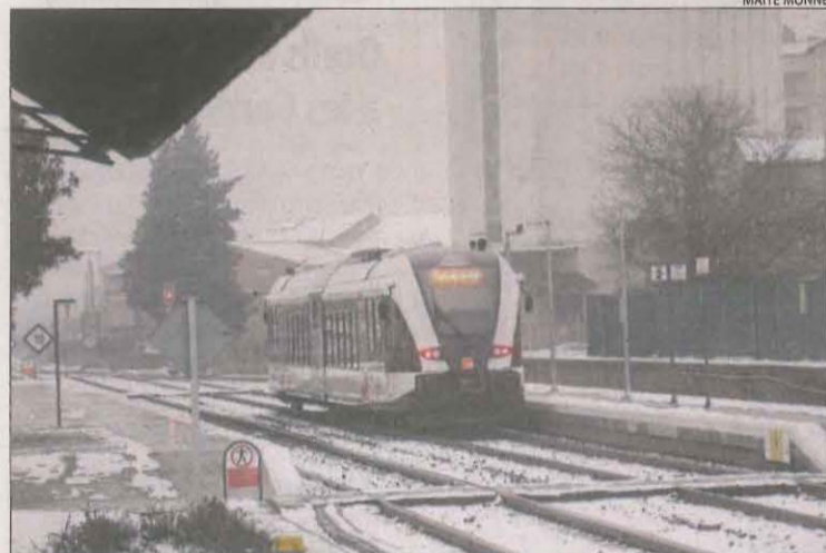
Un tren parat ahir a l'estació de Balaguer.