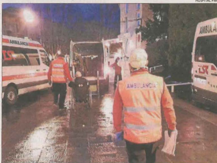
El trasllat d'un dels usuaris de la residència de Solsona.