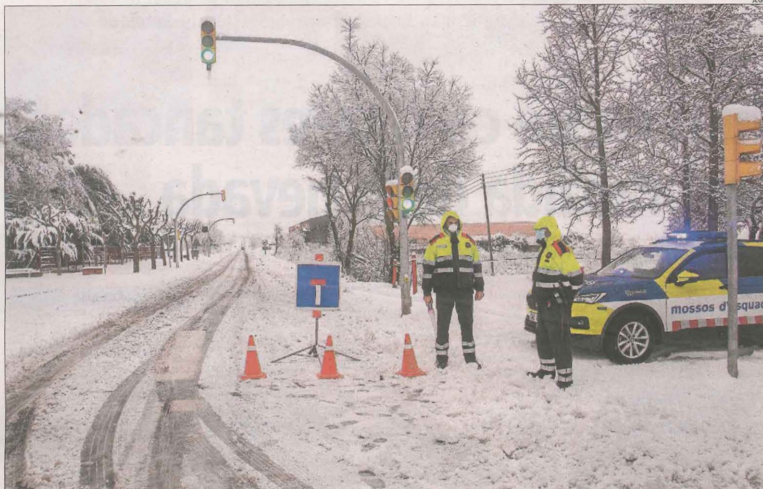
Imatge de la C-14 a Tàrrrega, que ahir al matí va estar tallada al trànsit.