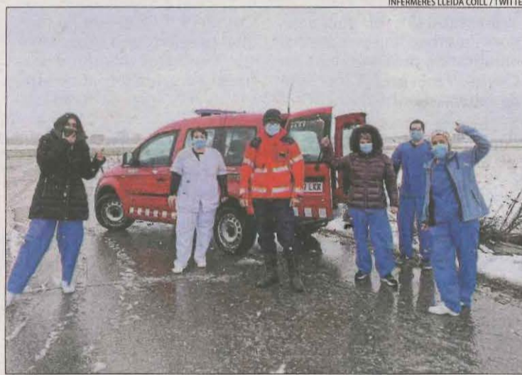
L'equip de vacunació en ruta cap a la residència de Bellvís.

El risc de rebrot a les comarques de muntanya va descendir ahir 123 punts i es va situar en 954. Malgrat tot, continua sent l'indicador més elevat de totes les regions sanitàries. Pel que fa al pla, el risc va disminuir 31 punts fins als 435, la taxa més baixa. Per la seua banda, la velocitat de contagis (Rt, que mostra quantes persones infecta cada positiu) també va anar ahir a la baixa, encara que es manté per sobre d'1 a les dos regions. En aquest sentit, al Pirineu va ser ahir d'1,39 i al pla, d'1,12.