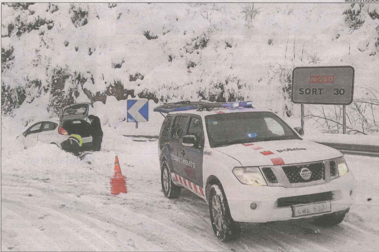
Port del Cantó. A Sort, els Mossos d'Esquadra van ajudar un vehicle que va quedar atrapat a causa de la neu.