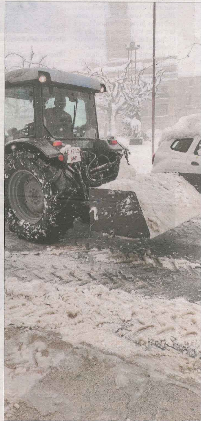
La Granadella. Voluntaris van ajudar en les tasques de neteja.