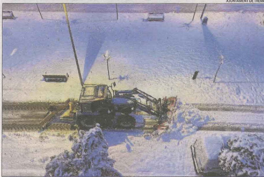
Tremp. Una màquina llevaneu va treballar des de primera hora del matí.

LLEIDA | Veïns, alcaldes, serveis d'emergències, treballadors municipals i pagesos es van arremangar ahir per col·laborar en la retirada de neu que es va acumular a les carreteres, camins, camps i carrers de Lleida a causa del temporal Filomena. Els consistoris van fer crides als veïns perquè van col·laboressin en les tasques de neteja. Una crida que va tornar a demostrar la solidaritat de la ciutadania, que va sortir amb pales, rasclets i tractors.