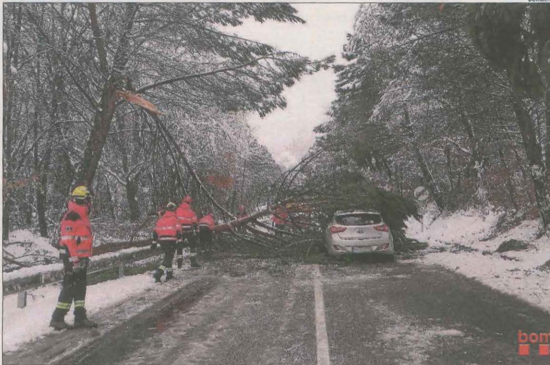
Efectius dels Bombers van treballar ahir en la retirada d'una branca caiguda a la C-13 a Castell de Mur.

Així mateix, una persona va haver de ser traslladada a l'hospital Arnau de Vilanova per intoxicació després de produir-se una mala combustió d'un braser en un habitatge a Alcoletge. L'avis va tenir lloc a les 23.31