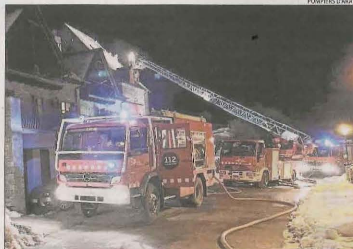
L'incendi es va produir a la matinada.