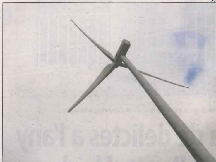
Un dels molins que ja funcionen al municipi de Talavera.

Garrigues s'han mobilitzat davant de la proliferació de projectes de parcs eòlics i solars pel seu impacte paisatgístic. També organitzacions agràries denuncien que els alts lloguers que paguen els promotors d'energies renovables desbanquen arrendataris