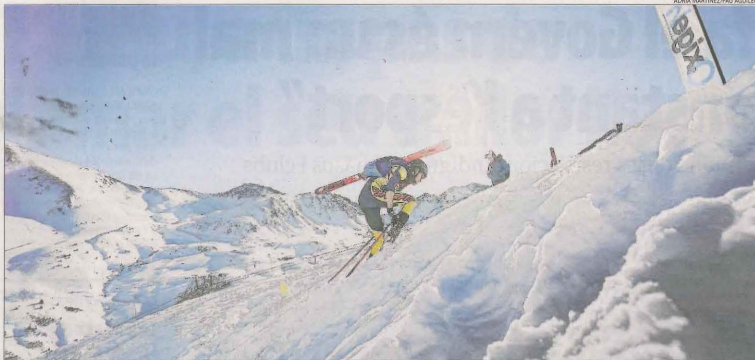
La modalitat de relleus va obrir ahir el Campionat d'Espanya, que es va celebrar sobre abundant neu a Boí Taüll.