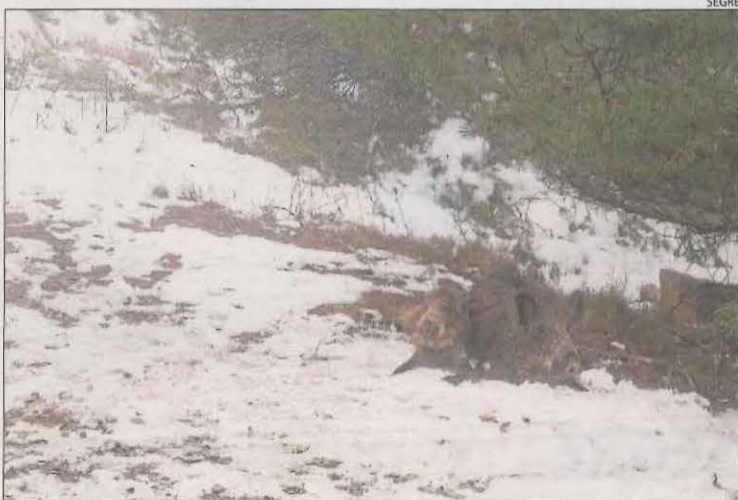
Imatge dels dos animals.