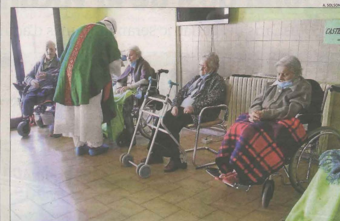
El bisbe Novell va oficiar ahir una missa a la residència d'ancians de Solsona.