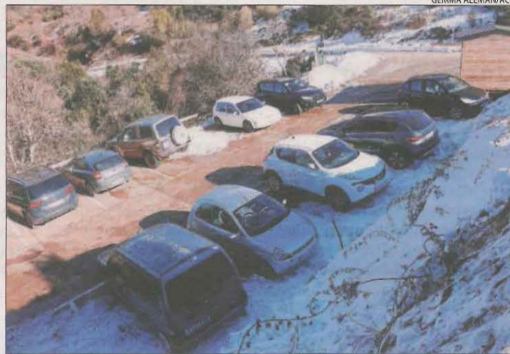
Aparcament a la falda del Montseny, ple de cotxes.

La tercera onada de l'epidèmia de Covid està tornant a posar en un compromís els hospitals catalans, que ahir tenien ingressades 2.630 persones amb coronavirus, un total de 133 més que dissabte, de les