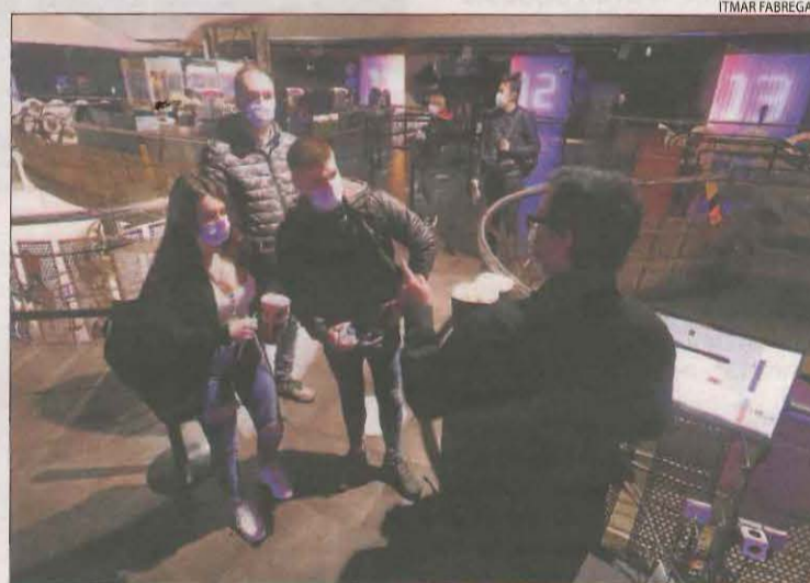
Espectadors ahir a punt d'entrar a les sales del JCA.

Pau Casals o els voltants del Centre Històric ja estaven plenes abans de les 13.00 perquè els clients no volien quedar-se sense taula.