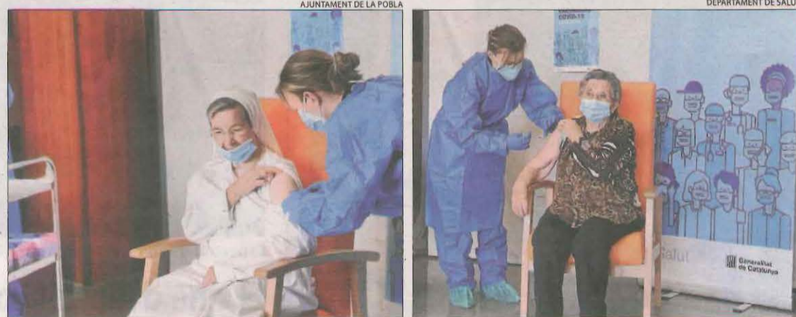
Una empleada de la residència de la Pobla i Leocàdia Peña reben la segona dosi.

és el que ens interessa com a població". Vilanova també va dir que després de la primera dosi ningú va tenir cap reacció adversa. "Només una mica de dolor a la zona de la injecció, com passa amb altres vacunes", va afirmar.