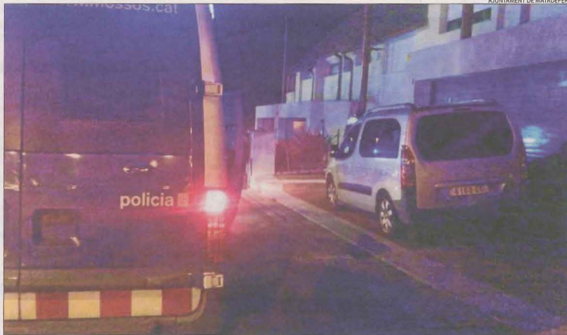
Imatge del carrer on es feia una festa il·legal a Matadepera.

En un altre ordre de coses, malgrat el confinament municipal que està vigent a Catalunya des del dia 7 de gener, els visitants no han deixat d'omplir el Montseny per veure la neu que va deixar el temporal Filomena, segons van denunciar els alcaldes de la zona.