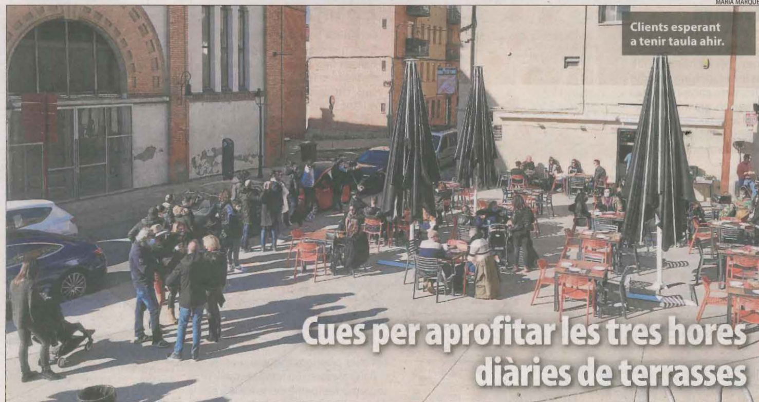
Clients esperant a tenir taula ahir.

Cues per aprofitar les tres hores diàries de terrasses