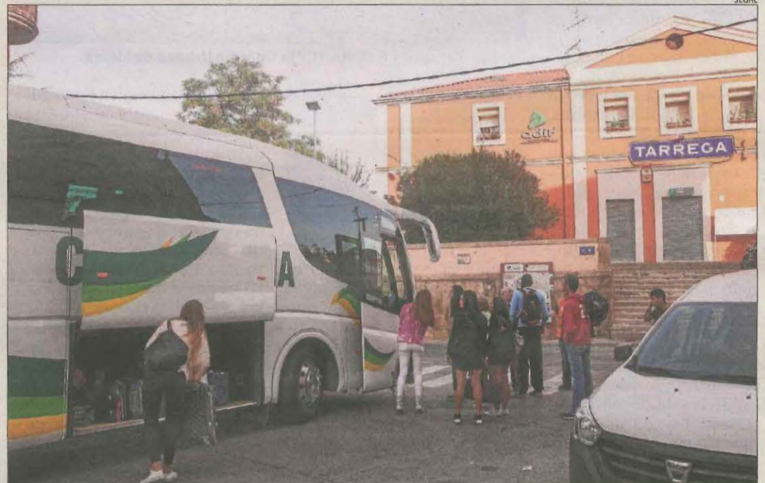
Un autobús recull passatgers del tren a Tàrrrega en un dels múltiples transports alternatius.

Amb la compra dels 4 trens per a Lleida, Ferrocarrils va anunciar també l'adquisició d'uns altres 14 trens per a l'aeroport de Barcelona per 187 milions.