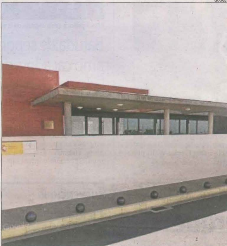
Quarter de la Guàrdia Civil a Tamarit de Llitera.

L'agressor va entrar a l'habitatge al forçar una finestra de la casa de la víctima, que viu sola