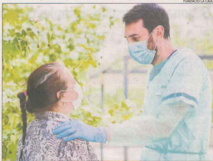
Imatge d'un psicòleg amb una pacient durant la pandèmia.

BARCELONA | Els centres educatius amb alumnes amb deficiències auditives reclamen les 64.000 mascaretes transparents que va prometre el departament d'Educació, després que amb el començament del segon trimestre només hagin rebut unitats per a una part del professorat entre logopedes i docents. També es queixen del mateix dels serveis d'educació per a alumnes amb necessitats especials.