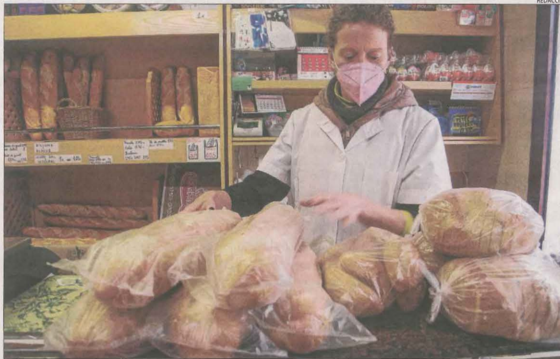
Una fleca de Tornabous prepara el pa que repartirà a domicili.

Totes les comarques de Lleida presenten un alt risc de rebrot, de la mateixa manera que la resta de Catalunya, sense excepcions. Tanmateix, el Solsonès, amb 2.908 punts, i les