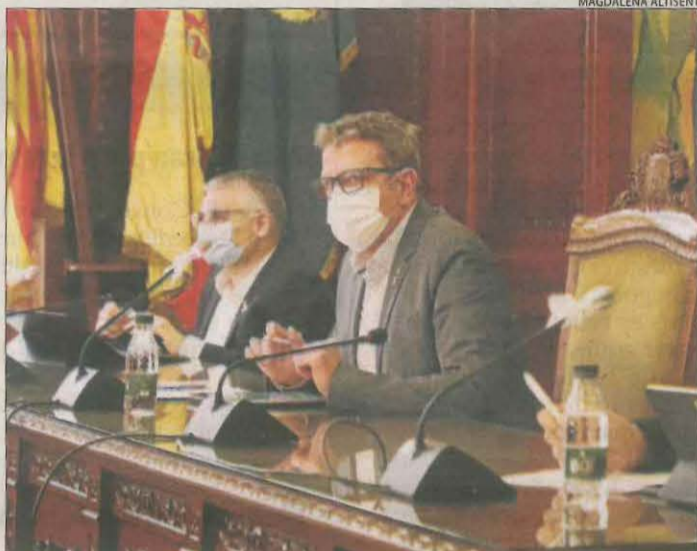
Imatge de la taula presidencial durant el ple d'ahir.

■ Tots els grups van votar a favor de la moció de Cs per donar suport econòmic als càmpings de la demarcació i desplegar més sistemes d'alerta davant de possibles inundacions.