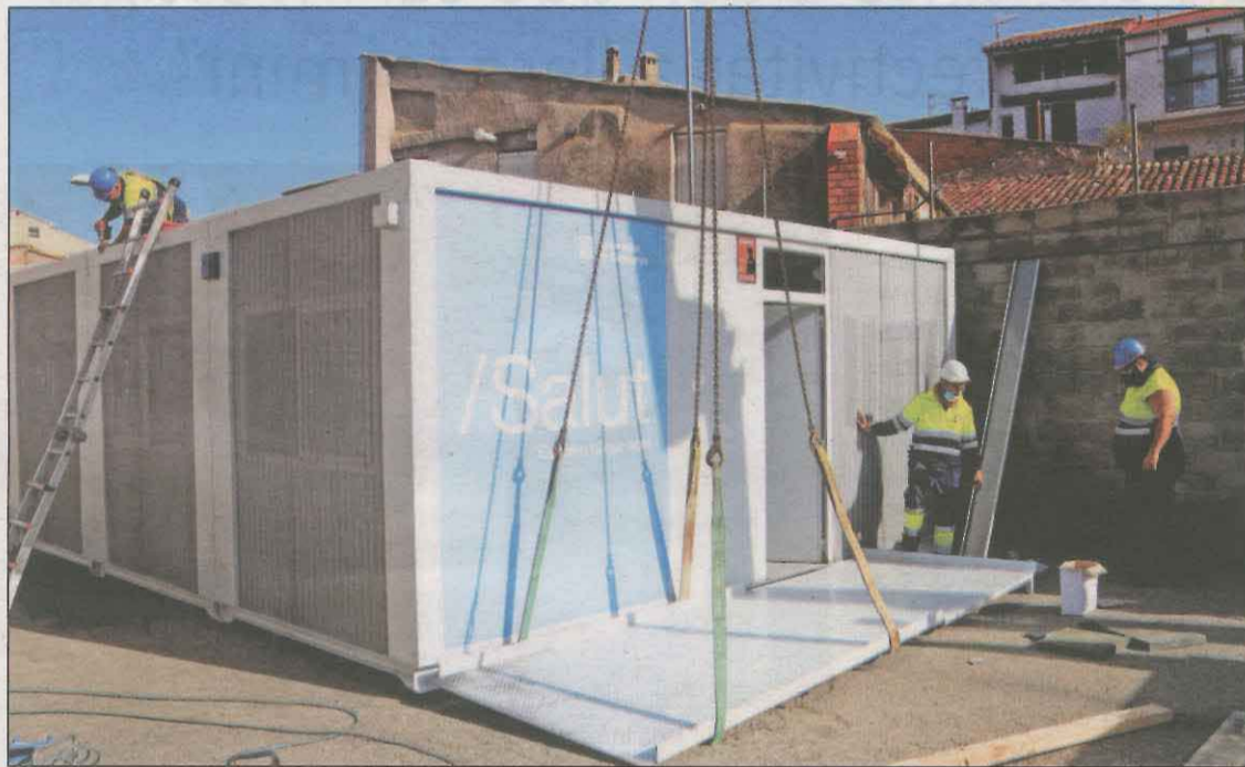
Salut està instal·lant un mòdul prefabricat al costat del CAP d'Oliana

El desplegament de mòduls s'emmarca en el Pla d'Enfortiment i Transformació de l'Atenció Primària, que va més enllà de l'impacte que genera el Covid-19, i que suposa una inversió de 910.000 euros a l'Alt Pirineu. La majoria dels mòduls tenen 45m2 de superfície i consten d'una consulta destinada a patologies respiratòries, dos punts per a la realització de PCR i un espai