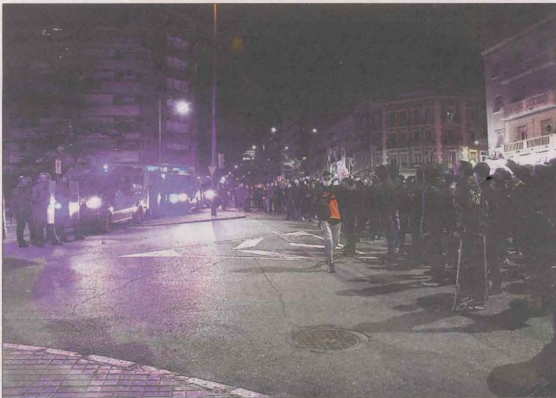
Los manifestantes se encararon a los agentes policiales delante de la Guàrdia Urbana

La manifestación convocada ayer en Lleida para exigir la libertad de Pablo Hasel acabó de nuevo con disturbios contra la Policía Nacional y los Mossos d'Esquadra. Los manifestantes lanzaron objetos y piedras contra los agentes frente a la Subdelegación del Gobierno. Cerca de 800 personas, según fuentes policiales, se congregaron en la plaza Ricard Vinyes donde iniciaron la protesta. El SEM atendió a un manifestante tras resultar herido. Y, además, un menor fue detenido. LLEIDA | PÁG.16-17