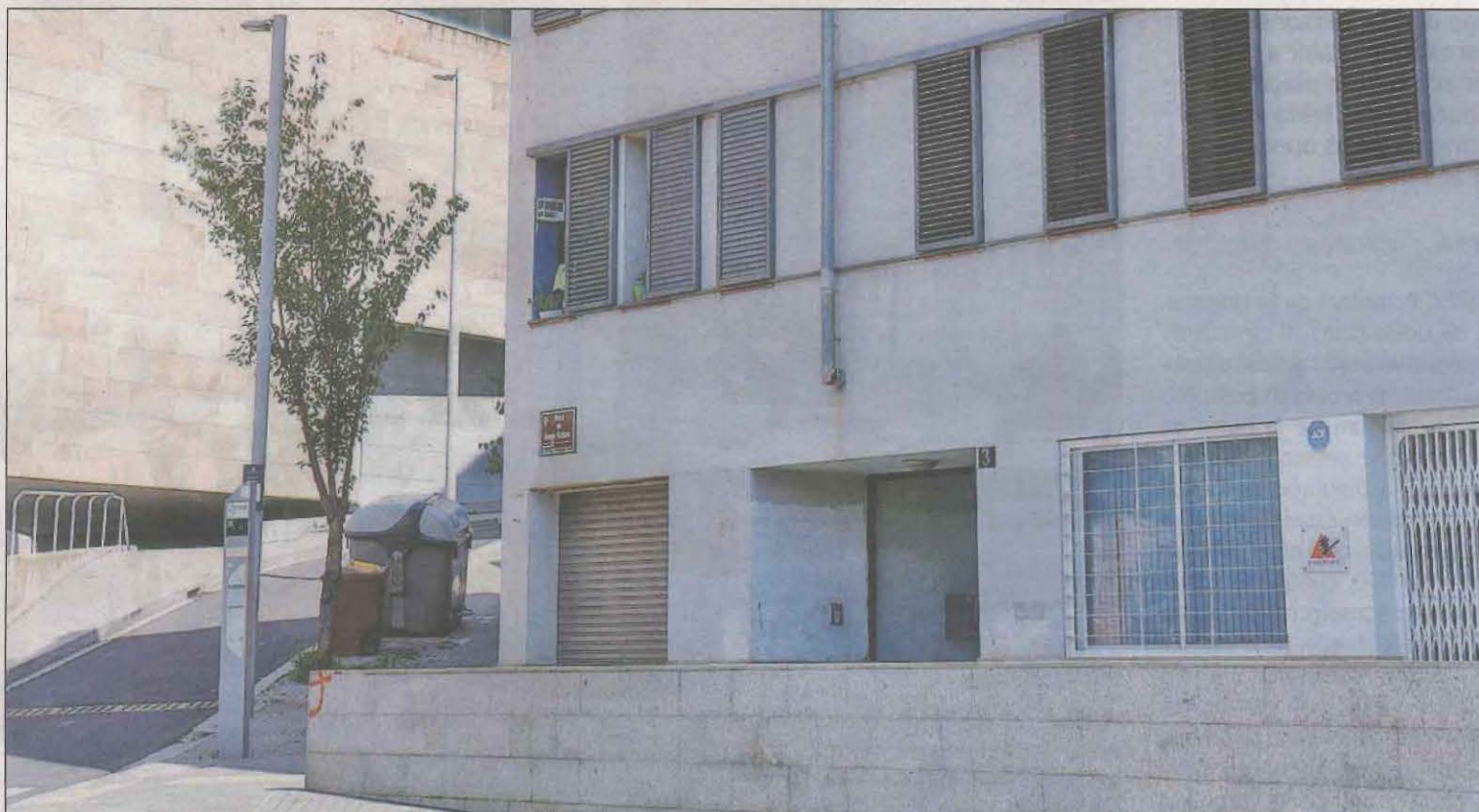
Imatge d'arxiu d'un edifici situat a la capital del Segrià