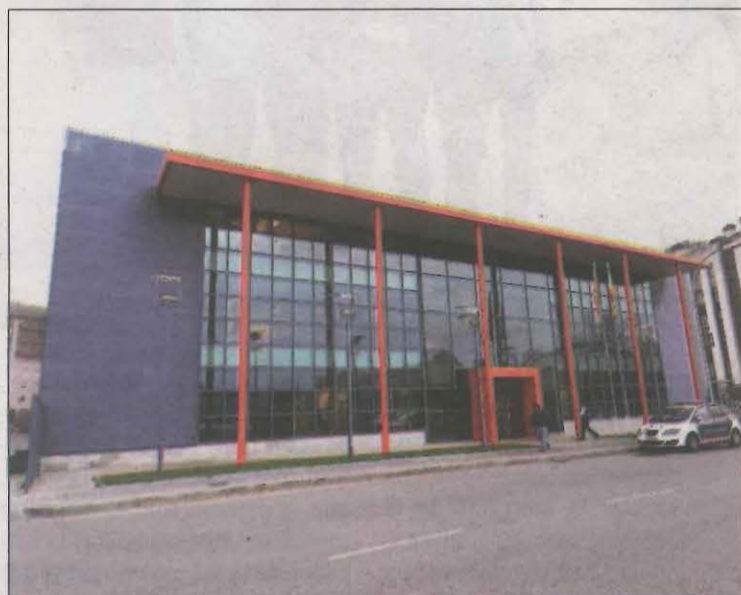
La policia catalana va obrir una investigació per trobar-lo

Com a conseqüència, l'agent va patir rascades i contusions en un lateral del cos. El motorista va aconseguir fugir, però va poder ser identificat gràcies a la matrícula de la moto. Posteriorment, els Mossos van obrir una investigació i ahir va ser localitzat i detingut pels volts de les 7.15 hores a la plaça dels Vents d'Alcarràs. Segons la policia, en el moment de la detenció l'home va mostrar una actitud violenta, amenaçant greument als agents que anaven a arrestar-lo. El detingut, que té nombrosos antecedents, passarà pròximament a disposició judicial davant del jutjat d'instrucció en funcions de guàrdia de Lleida.