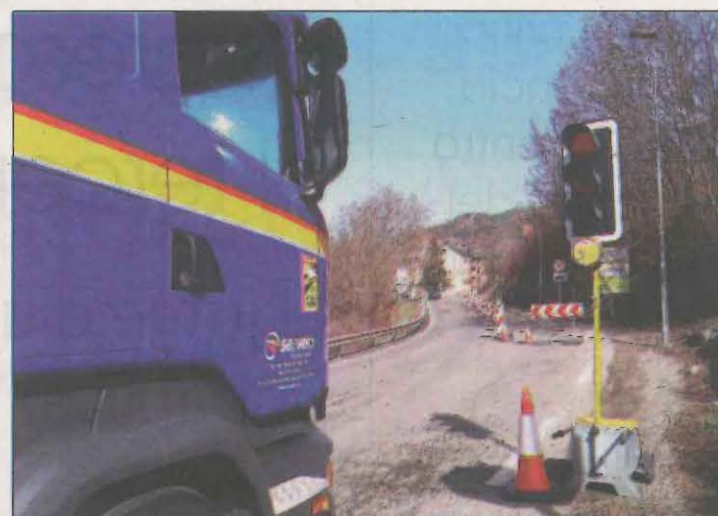
S'ha instal·lat un semàfor per regular el pas

les propostes de regulació de les plantes fotovoltaïques a la comarca. Navarra va dir que en sis mesos l'estudi ha d'estar acabat.