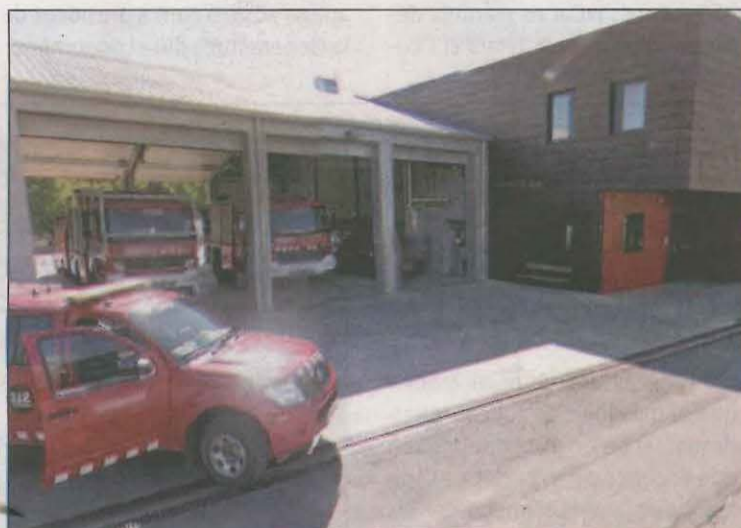
Imatge del parc de Bombers de Tremp