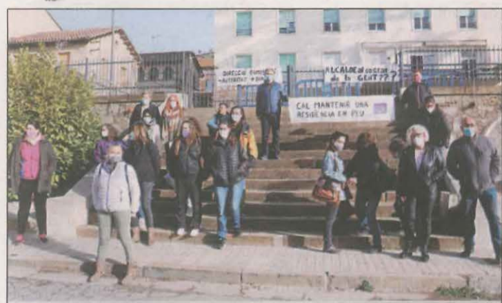
Una trentena de persones van participar en la protesta

Les treballadores de la Residència Verge de Ribera, de la Pobla de Segur es van concentrar ahir davant del centre per denunciar les "indignes" condicions laborals que l'Ajuntament els imposa. A la concentració, en què van participar una trentena de persones, no s'hi van poder unir les cuidadores que es trobaven treballant al centre. Aquestes volien fer una aturada de cinc