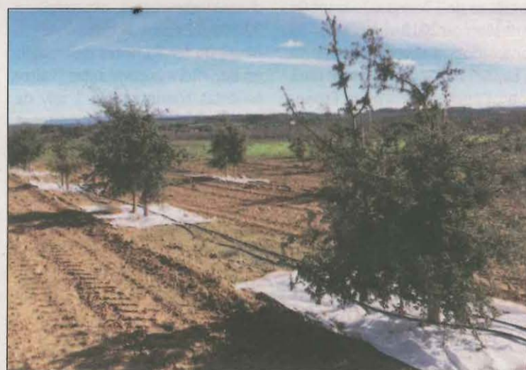
La tòfona negra és un dels fongs comestibles més preuats

El Centre de Ciència i Tecnologia Forestal de Catalunya i la Universitat de Lleida han donat a conèixer els resultats d'un estudi per adaptar millor el cultiu de la tòfona negra a les condicions derivades del canvi climàtic, com ara episodis de sequera. S'ha publicat a la revista científica 'Mycorrhiza' i es basa en l'aplicació de tècniques com l'encoixinat de color blanc, que redueix l'escalfament i manté la humitat del sòl, i el reg, que n'augmenta la disponibilitat d'aigua. L'estudi conclou que cal seguir investigant sobre l'ús de tipus d'encoixinats i altres factors que intervenen en el cul-