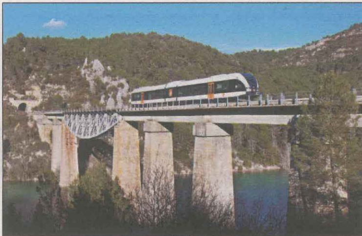
Imatge del tren de la línia Lleida-La Pobla de Segur

Ferrocarrils de la Generalitat de Catalunya (FGC) i Naturgy han signat un acord de col·laboració pel qual l'empresa energètica utilitzarà les instal·lacions ferroviàries d'FGC a Lleida per desenvolupar un projecte per investigar, en un futur, l'ús d'hidrogen com a combustible net per als trens no electrificats. Aquesta iniciativa s'emmarca en l'estratègia de les dues companyies de fomentar la mobilitat sostenible i apostar per les energies renovables per lluitar contra el canvi climàtic i la contaminació atmosfèrica. El projecte consisteix en la producció i emmagatzematge d'hidrogen d'origen renovable a Lleida i la seva utilització, com a combustible a uns futurs trens de la línia de la Pobla de Segur.