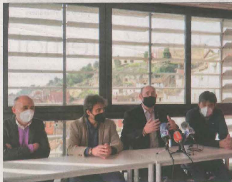
L'alcade i la UdL van presentar ahir el projecte

La construcció de la planta pilot és una actuació coordinada entre dues de les operacions d'aquest projecte que es va iniciar al 2017. El seu objectiu estratègic