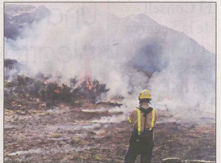
Moment en què els efectius realitzaven ahir la crema