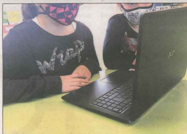
Es vol convertir les aules en espais autosuficients

El propòsit de l'Escola és disposar de la infraestructura necessària i convertir les aules en autosuficients per poder dur a terme el