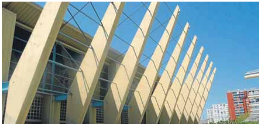
El poliesportiu Sergio Manzano serà un dels nous centres de votació el 14-F