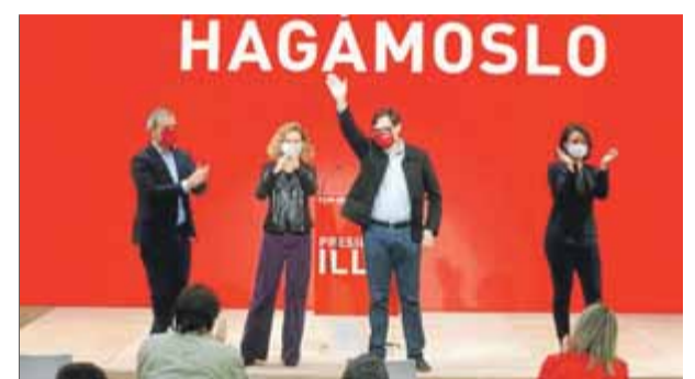
Salvador Illa en l'acte d'ahir del PSC a Barcelona