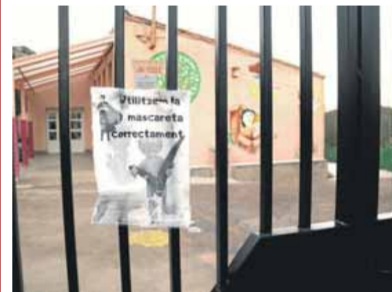
Per precaució s'ha descartat votar a l'escola ■ ACN