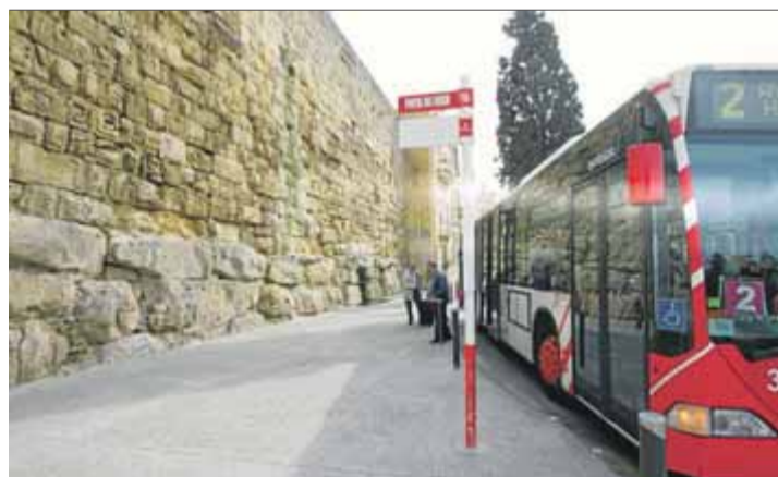
Tarragona tindrà busos llançadora gratuïts per anar a votar

tació i ventilació suficient. L'Ajuntament ja ha habilitat un web específic perquè l'electorat pugui consultar el cens i la mesa on li toca anar, amb el mapa corresponent. En total, hi haurà 159 meses electorals a la ciutat, que mobilitzaran, doncs, comptant uns 9 membres per cadascuna, suplents inclosos, unes 1.400 persones, a què cal afegir els apoderats dels partits, interventors i funcionaris que hauran de participar in situ en el procés electoral.