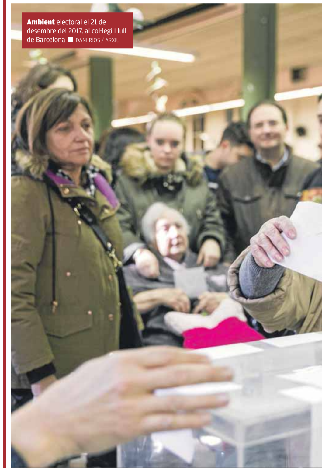
Ambient electoral el 21 de desembre del 2017, al col·legi Llull de Barcelona

Els protocols sanitaris establerts per la pandèmia han provocat tots aquests canvis, que tenen un cost que s'afegeix al ja reglat en concepte d'indemnitzacions i a partir d'un càlcul