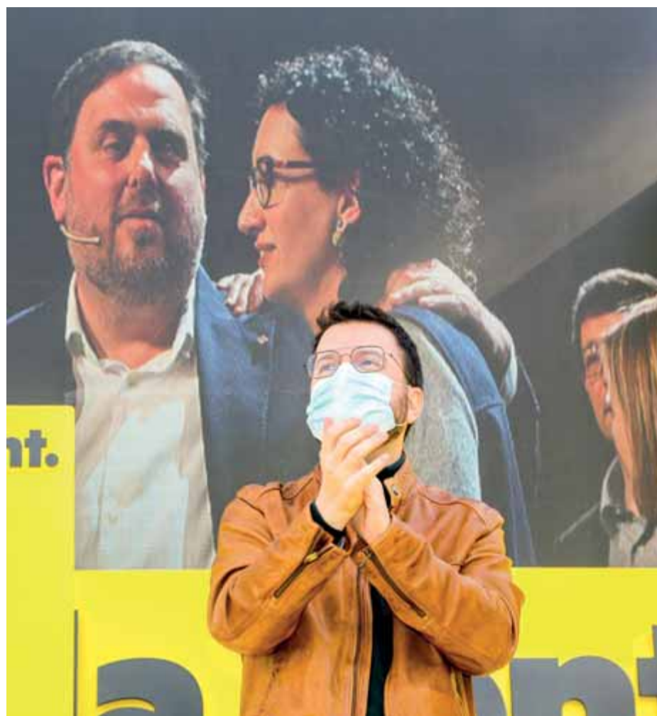
Aragonès, ahir a Lloret de Mar, amb la imatge de Junqueras i Rovira de fons

La secretària general d'ERC va reconèixer que a partir del 3-O el moviment independentista va perdre el lideratge polític i que des d'aleshores té