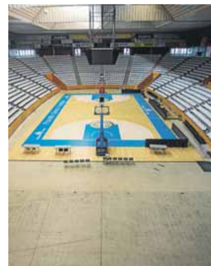
El pavelló de Girona-Fontajau ■ QUIM PUIG

Quatre canvis d'emplaçament i un cas d'unificació de dues meses. Aquestes són les principals variacions que es trobaran els electors de la capital de demarcació gironina i que l'Ajuntament ja ha fet públiques al web municipal, on cada ciutadà ja pot consultar quin és el punt de votació que li toca. L'Ajuntament justifica el canvi d'alguns punts de votació als barris perquè els espais tradicionals de votació no complien les mesures de seguretat imposades. En aquests casos s'han buscat espais més grans, amb més accessos i que es puguin ventilar bé, i les instal·lacions que responen més a aquestes exigències són edificis com els pavellons de Fontajau, Vila-roja, Montfalgars, Palau 1 o l'Auditori Palau de Congressos, on es reubicaran meses d'aquests barris. A banda, l'Ajuntament de Girona explica que està previst incrementar la neteja que es farà durant tot el dia de la votació, amb material de protecció, com gel, guants, EPI (que s'haurà d'utilitzar en el tram horari de votació Covid). A cada local electoral hi haurà un responsable de seguretat sanitària. Les cues s'hauran de fer al carrer, de manera que entraran les persones de manera regulada i ordenada guia-