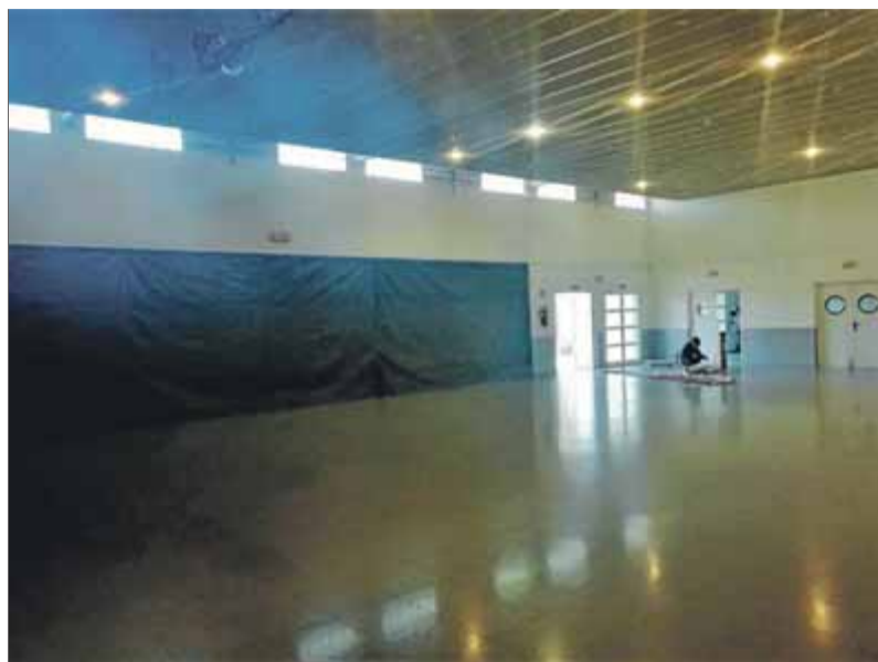
La sala polivalent del centre cívic, on s'instal·larà el col·legi electoral ■ R.E.