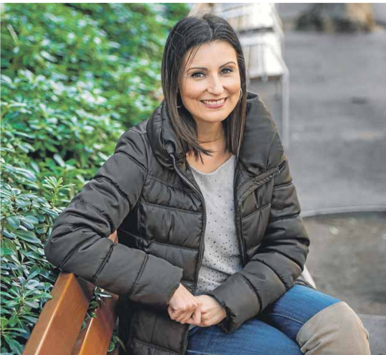
Lorena Roldán, feliç d'haver fet el salt de Ciutadans al PP

enviant insinuant que no serà segur votar.