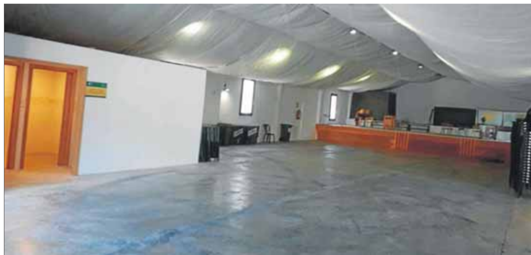
El local social de Vilaller, amb capacitat per a 485 persones, és l'espai que farà de col·legi electoral el 14-F ■ EPA

En aquest local es constituirà una sola mesa. Hi haurà dos vocals i un president. L'alcaldesa manté que, tot i que una de les persones que han sortit escollides en el sor-