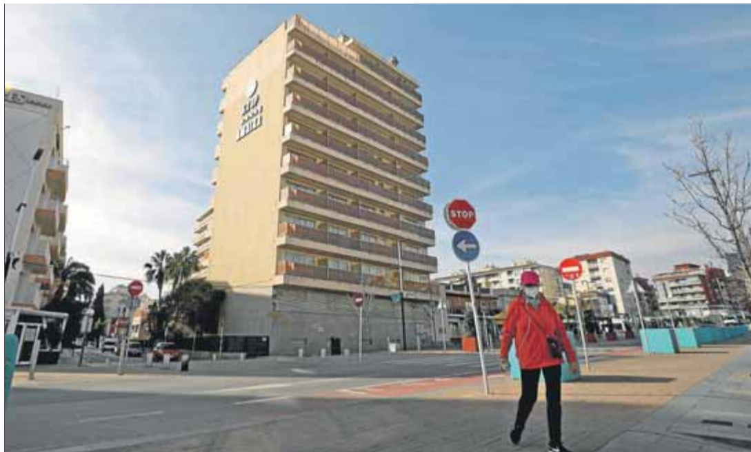
Les cues dels votants es faran a l'exterior i les meses seran als vestíbuls dels establiments

Així, els votants que fins ara exercien el seu dret a vot a l'escola Pia i a la biblioteca hauran de fer cua a l'exterior de l'hotel Amaika, i els que anaven a l'escola Freta ho faran a les instal·lacions del Volga. Només els qui tenen com a seu electoral la fàbrica Llobet i Guri mantindran el