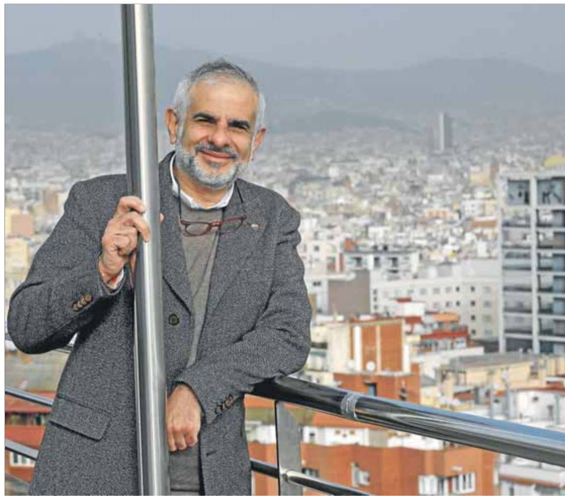
El cap de llista de Cs durant una pausa de l'entrevista que es va fer dissabte al matí ■ JUANMA RAMOS

Prefereixo pensar que llla em farà president a mi, en el cas que pugui articular una majoria. A més, és el més lògic de creure veient els resultats ac-