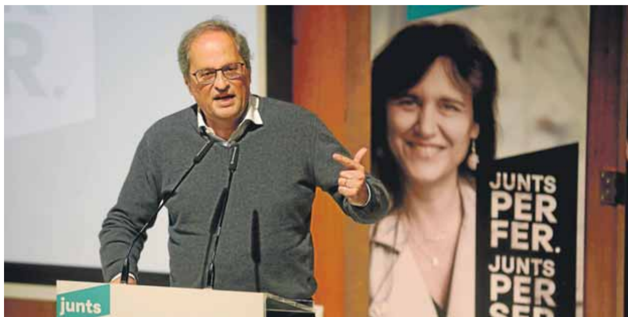
L'expresident Quim Torra, durant la seva allocució en l'acte de JxCat, ahir al vespre a Granollers

Segur que l'Estat hi adoptarà totes les actituds dilatòries que pugui, però nosaltres, Catalunya, mai hem de cedir la bandera de la negociació política, perquè és imprescindible per teixir majories socials al nostre país i perquè és imprescindible per obrir les portes de la comunitat internacional. A l'estranger se'ns reclama que Catalunya encapçali i lideri sempre la voluntat de negociació. Menystenir el diàleg i renunciar a aquesta bandera i regalar-la als enemics de la república catalana i de la llibertat, seria un error estratègic monumental. Si ho féssim, impediríem que se'ns obrissin portes de la comunitat internacional. ■