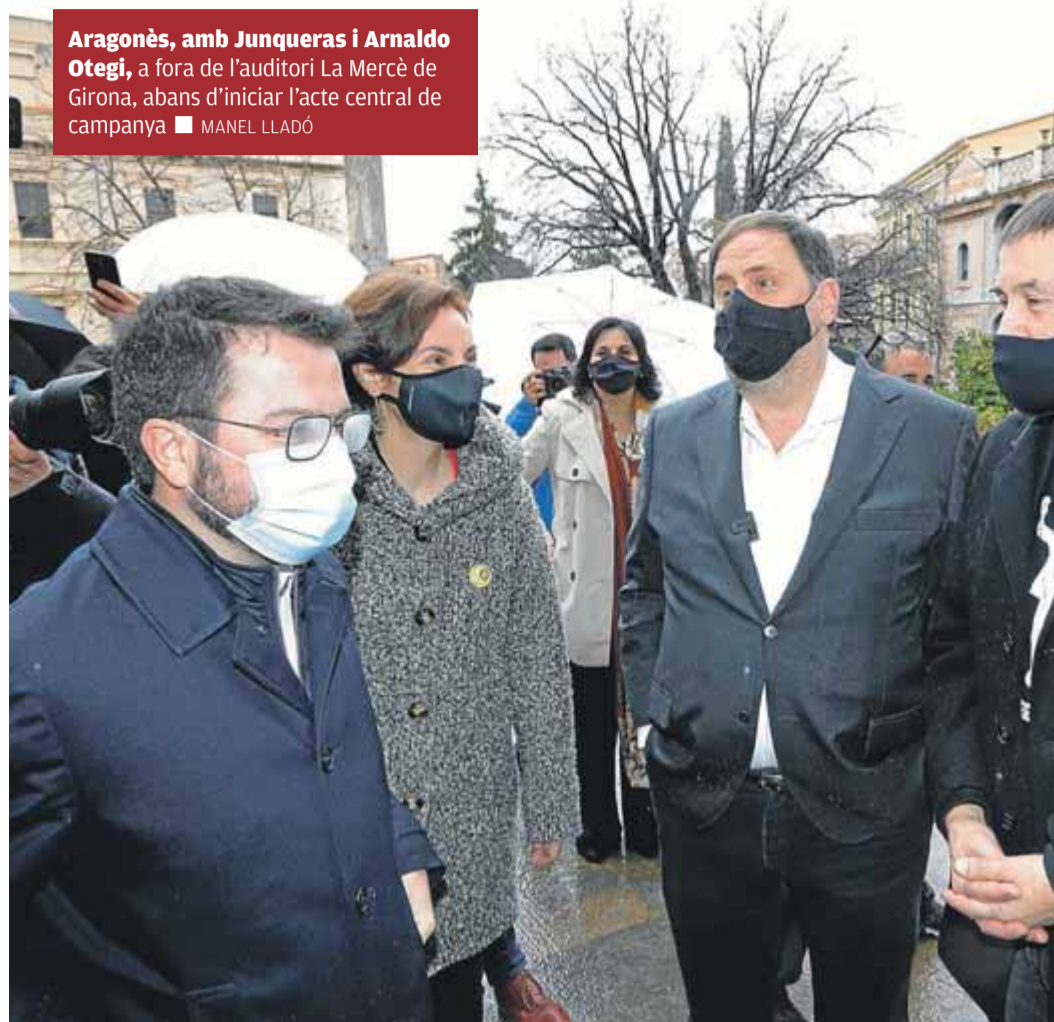
Aragonès, amb Junqueras i Arnaldo Otegi, a fora de l'auditori La Mercè de Girona, abans d'iniciar l'acte central de campanya

Al seu torn, el president del partit, Oriol Junqueras, i la consellera Dolors Bassa van fer també crides a la mobilització, i el primer va destacar que ERC ja havia aconseguit l'amnistia per als presos quan va guanyar les eleccions del 16 de febrer del 1936, fins i tot la del president Lluís Companys. "Us demano, us prego i crec que us puc exigir que el 14-F ompliu les urnes de democràcia, de llibertat, de dignitat, de república. No ens deixeu sols, nosaltres no ho hem fet mai, ni tancats a dins de la presó", va dir. Arribats a aquest punt, Junqueras va fer una doble referència a la seva situació personal. Així, va recordar que, al mòdul 2 de Lledoners, hi ha un al-