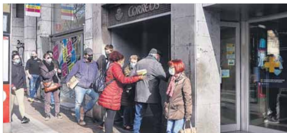
Cues de gent per sol·licitar el vot per correu, la setmana passada a Barcelona ■ JOSEP LOSADA

El representant de la UGT denuncia que des de dimecres passat s'ha prioritzat el repartiment de les trameses electorals. "A partir de dilluns, tindrem un problema per repartir tot el correu ordinari que s'ha deixat de banda per les eleccions", denuncia Valdés, que hi afegeix que la plantilla habitual haurà d'assumir aquest esforç extraordinari, ja que el personal de reforç haurà finalitzat el seu contracte. "Demanarem que es renovin els contractes temporals per poder fer-hi front", avança. ■