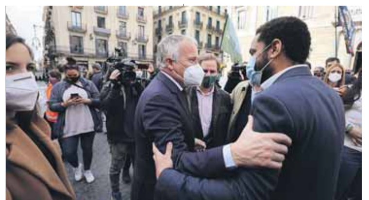
Bou, del PP, confraternitzant amb el cap de llista del partit ultra

Del balcó del Palau de la Generalitat hi penjava, com sempre, la pancarta amb el lema llibertat d’opinió i d’expressió. Només faltaria, Jusapol i els seus ahir es van poder expressar. ■