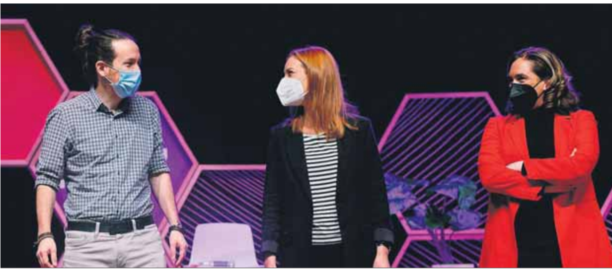
Pablo Iglesias, Jéssica Albiach i Ada Colau a l'acte d'ahir al matí al Casino L'Aliança del Poblenou