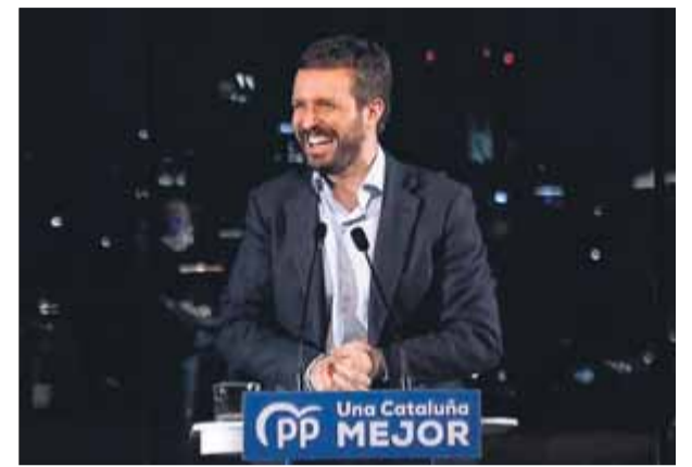
Pablo Casado fent broma abans de començar a parlar

guir el mateix traç, posant més l’accent en el risc que, segons ell, hi ha que el procés sobiranista agafi una nova embranzida en el cicle que s’obrirà després del 14-F. “En el proper Parlament ens podríem trobar un escenari més radical i extremista, si és possible, del que hem tingut ara per part de l’independentisme més totalitari”, va proclamar el cap de llista taronja, per a qui l’aparent desmobilització de l’electorat sobiranista obre una “oportunitat per assolir un govern constitucionalista a la Generalitat”. ■