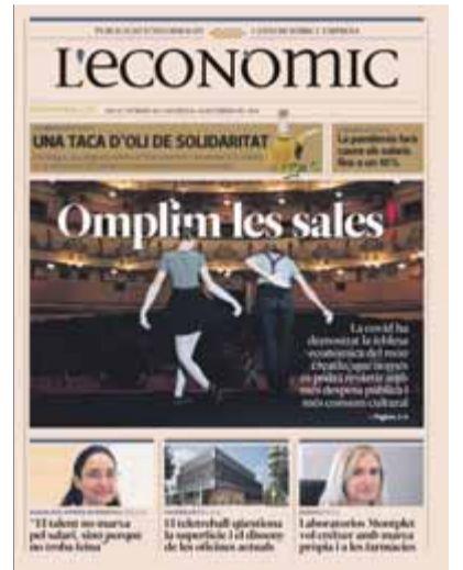
Portada de L'Econòmic

L'Econòmic d'aquest mes de febrer, que els lectors d'El Punt Avui rebran juntament amb el diari de demà, analitza en el reportatge d'obertura de la publicació la difícil situació que passa el món de la cultura, un dels sectors més colpejats per la crisi econòmica com a conseqüència de la Co-