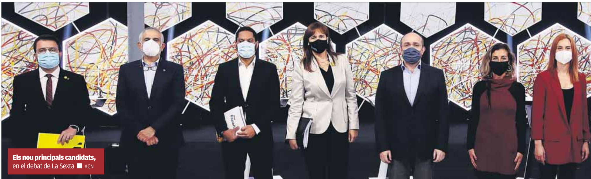
Els nou principals candidats, en el debat de La Sexta ■ ACN