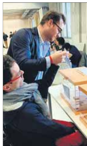
A les eleccions municipals i autonòmiques ja van poder votar

el seu dret al vot a les eleccions al Parlament. Mitjançant un comunicat Dincat, representant del sector de la discapacitat intel·lectual, es felicita que a finals del 2018 s'aconseguís recuperar aquest dret després d'una llarga lluita per modificar la llei electoral. L'entitat reivindica la