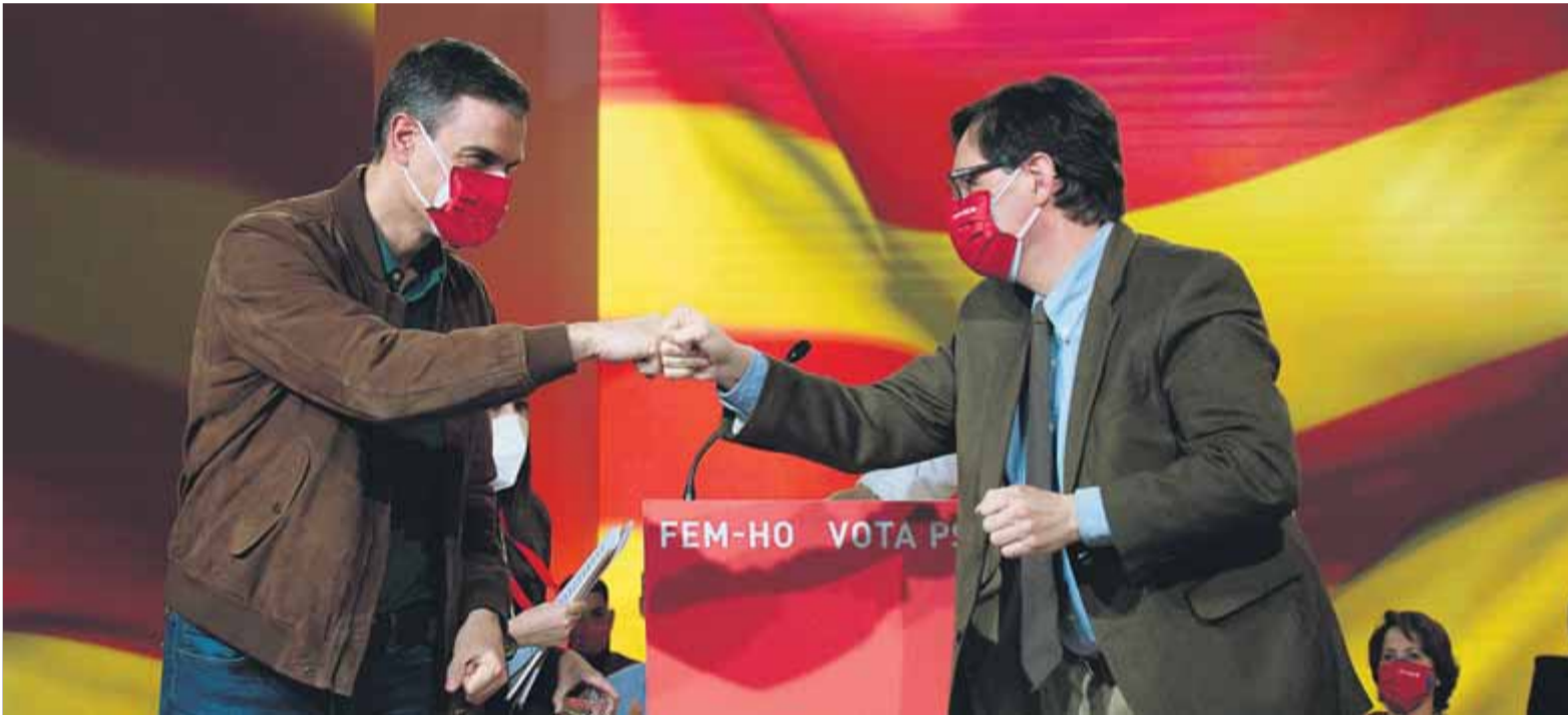
Pedro Sánchez feia costat a Salvador Illa en el míting de cloenda d’una campanya que el PSC ha fet telemàticament i amb un mínim aforament presencial

Reclama el vot dels que volen “tranquil·litat i estabilitat” i volien el canvi amb Ciutadans el 2017. Tot i negar-se a invertir cap independentista, el PSC s’ofereix com el reconciliador entre els blocs