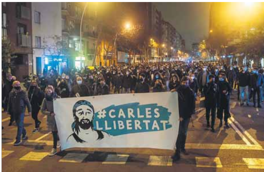
Manifestació de suport al veí de Sants de Barcelona, empresonat abans d'ahir arran de les mobilitzacions pel raper Hasél, a l'avinguda de Madrid, ahir