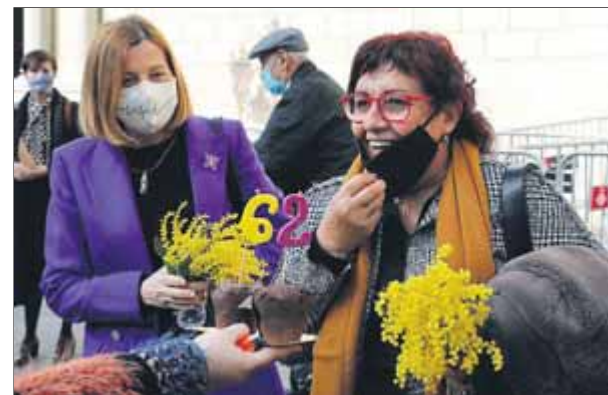
Carme Forcadell i Dolors Bassa, en un acte el 2 de febrer, a Barcelona

En els pròxims dies, doncs, el jutge ha de resoldre el fons del recurs en què la fiscalia considera que no hi ha hagut canvis substancials (poc temps tancades i sense tractament, addueix) per poder concedir a les preses polítiques el tercer grau, tal com va dir el Tribunal Suprem, al desembre. El Suprem tornarà a tenir la darrera paraula. Pel que fa