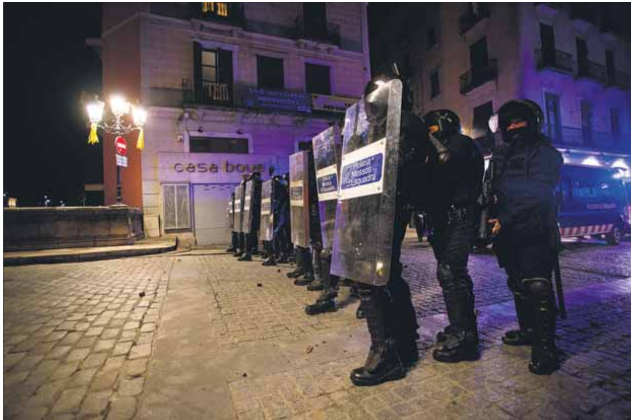
L'actuació dels Mossos en els últims aldarulls –a la foto, dimecres a Girona– ha estat qüestionada per la CUP