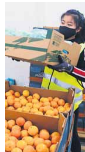
Una voluntària al magatzem de l'entitat

mateix import que comprar 600.000 litres més de llet", hi afegeix Fatjó, que no amaga la complexitat d'una rebuixa fiscal que dependria en últim terme d'una decisió política d'abast europeu. L'IVA que s'aplica varia segons el tipus d'aliments de l'ordre del 4% fins al 21%. "També és absurd que s'apliqui el