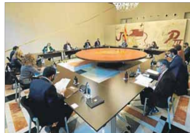
El paper que ha de fer el govern, punt de discòrdia

Junts reclama d'entrada un "front institucional" arreu, també al Congrés, però ERC no hi està gens d'acord, ja que s'estima més influir si pot en altres polítiques. Els de Puigdemont admeten que les institucions autonòmiques estan lligades de mans, tot i que creuen que el govern pot jugar un paper en les estructures d'estat. A més, exigeixen que ell i el Parlament facin respectar la seva sobirania. La CUP fa