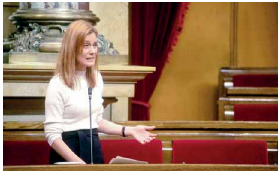
Jéssica Albiach, dimecres, en la Diputació Permanent del Parlament

gressista”. En roda de premsa telemàtica després de la celebració del consell nacional, Albiach va assegurar que, després de reunir-se amb ERC i el PSC, havien “constatat que mantenen els seus vetos creuats i que no poden fer un govern compartit.” Els comuns, que van rebre 195.345 vots en les eleccions del 14-F i tenen vuit diputats, vetarien així l’entrada de JuntsxCat a la Generalitat, amb 570.539 vots i 32 diputats, un menys que el PSC. I necessitarien la seva abstenció. Per a Albiach, “ara com