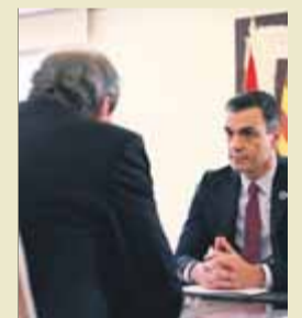
Torra i Sánchez

Desautoritzat. Fa un any se sabia que un membre de la Junta Electoral que havia participat en la persecució política contra els eurodiputats catalans exiliats cobrava de Cs.