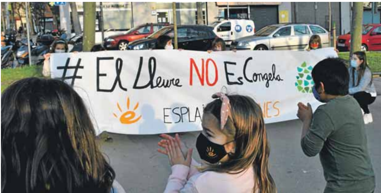
La canalla va reprendre ahir els casals i esplais de lleure. A la imatge, un acte d'ahir a la tarda de Fundesplai