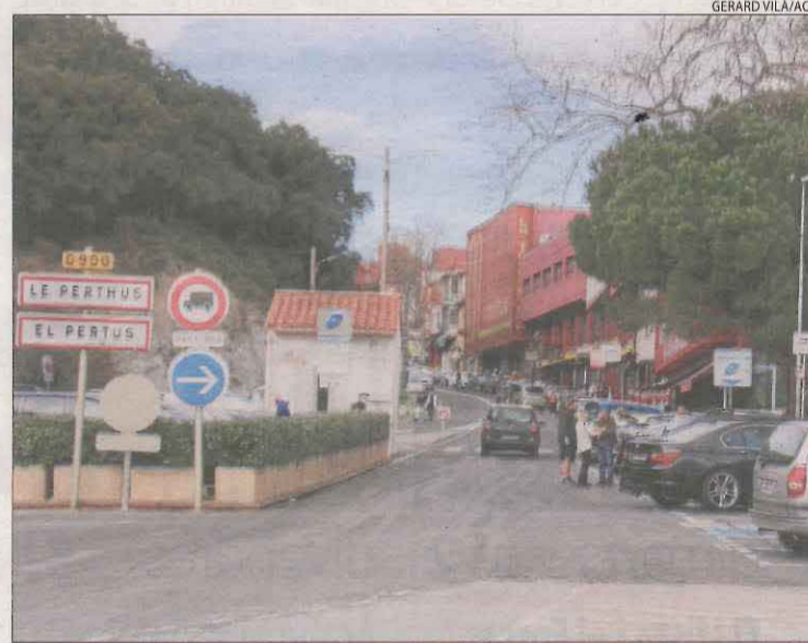
La carretera d'entrada al Pertús, ahir.

Reintroducció de controls policials també des d'ahir a la frontera entre Espanya i Portugal