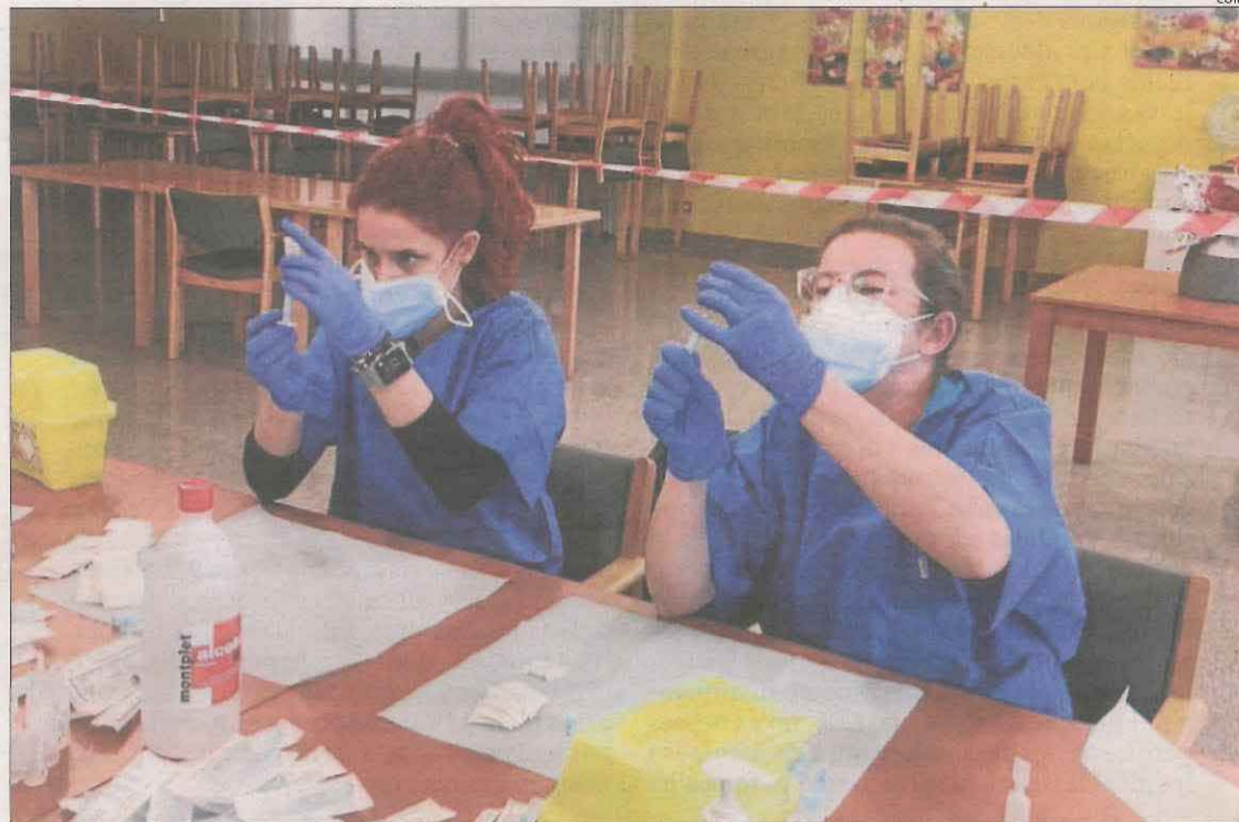
Infermeres preparant la dosi a la residència de la Fuliola.

A Lleida s'han administrat fins al moment 13.360 primeres dosis i 6.314 de la segona