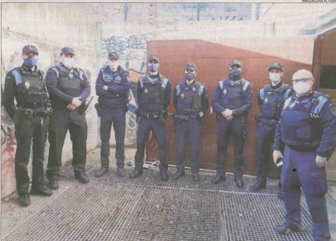
Alguns dels agents de la Guàrdia Urbana que van ser vacunats ahir a Lleida ciutat.