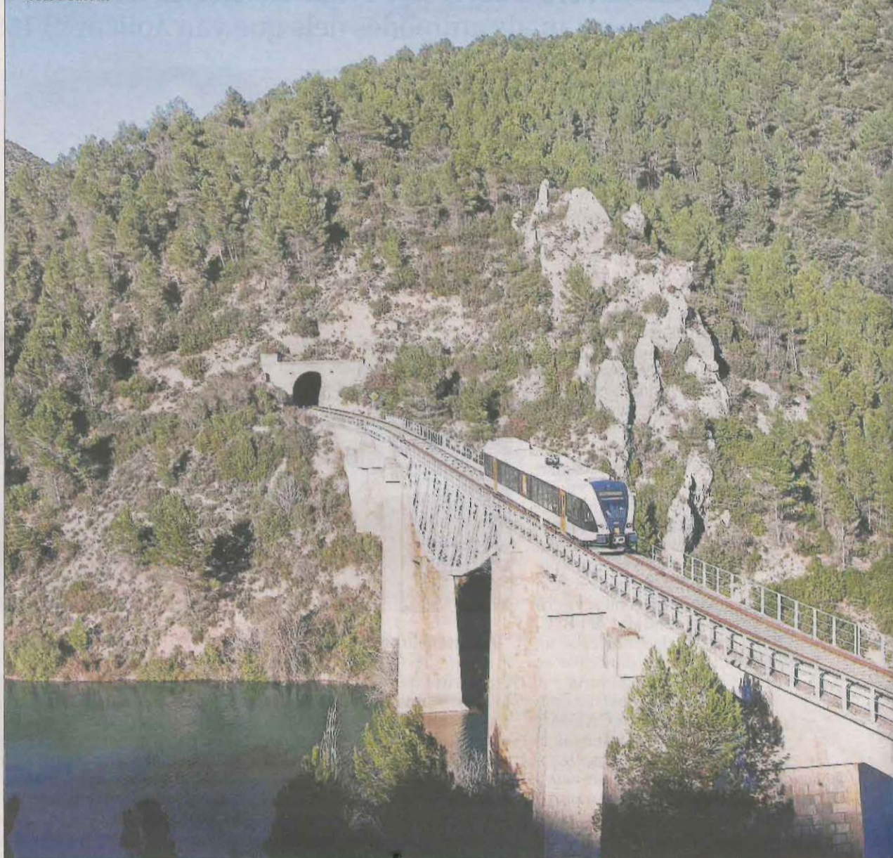
La línia de la Pobla és la porta d'entrada al Pirineu en ferrocarril.

Paco Garcia: D'una banda, és importantíssim el combat contra la despoblació. Per a això, cal assegurar una bona connectivitat física i telemàtica, així com una correcta prestació dels serveis bàsics de salut, ense-