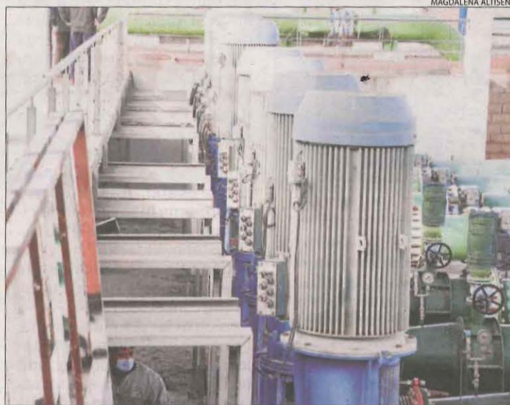
Les bombes de l'estació de Castelló de Farfanya, fora de servei.

Els treballs de muntatge començaran la setmana vinent, ja que hi ha peticions d'aigua per regar