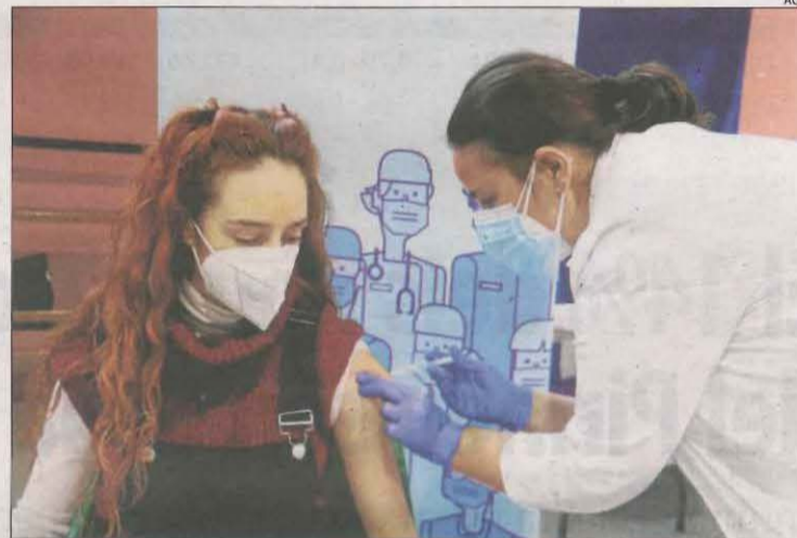
Vacunació al poliesportiu El Casal de Tremp