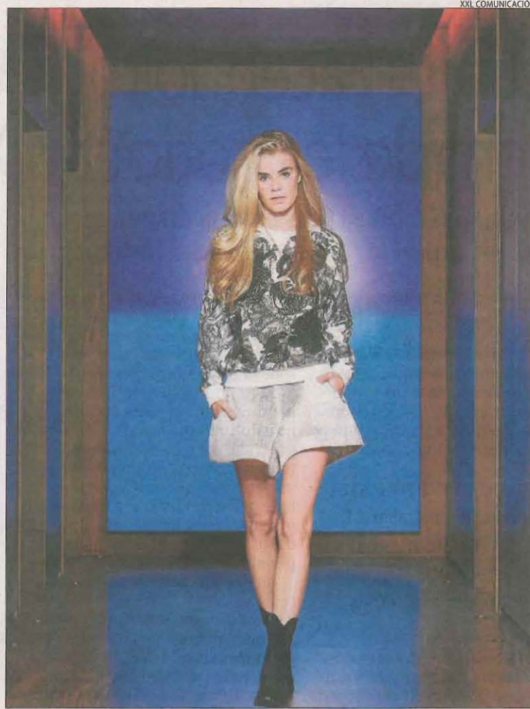
Una de les propostes de Custo Dalmau per a la tardor-hivern 2021.

L'ajuntament de Tàrrrega i el Consorci per a la Normalització Lingüística han renovat el conveni per desenvolupar el programa Aula de Llengua , amb el qual afavorir el coneixement del català i la inclusió social.