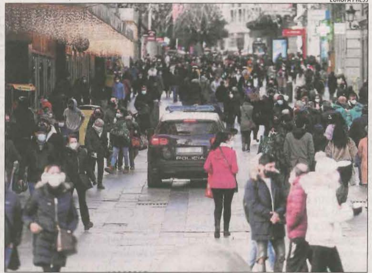
Imatge d'un cèntric carrer de Madrid durant la pandèmia.

En aquest sentit, els que veuen "dolent" o "molt dolent" la conjuntura econòmica són ja el