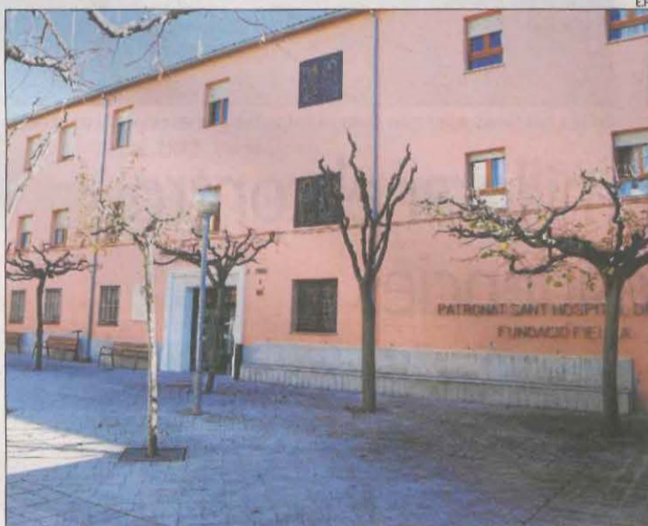
Imatge d'arxiu de la residència de Tremp.

LLEIDA | El patronat de la Fundació Fiella confia a recuperar aviat la gestió de la residència de Tremp, intervinguda des del 28 de novembre per un brot que es va causar la mort de 61 usuaris. Així ho apunta en una carta enviada a les famílies de residents en què no assumeix responsabilitats pel que ha succeït, expressa dolor pels morts i explica que la intervenció es mantindrà almenys dos setmanes més (es revisa de forma quinzenal). Destaca que "amb l'ajuda de GSS i Sant Joan de Déu Terres de Lleida hem recuperat entre tots, i molt significativament amb l'esforç dels treballadors, la normalitat