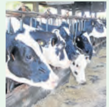
Els preus, un cavall de batalla.

l'octubre, les pèrdues directes pujaven a més de 100 milions d'euros, uns 12 a Lleida.