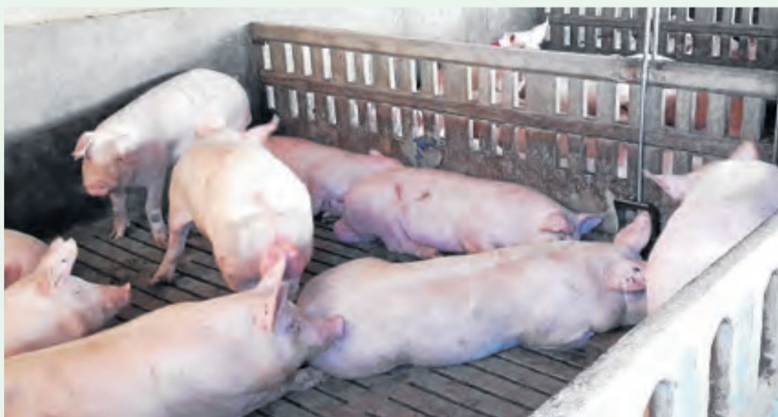
Auguren més incertesa en els preus a causa de factors com la PPA o la pujada dels costos de producció.

Les perspectives de mercat per al 2021 són ben diferents respecte a l'any passat, apunten des d'Unió de Pagesos. Si l'any 2020 començava amb un preu proper a 1,50 euros per quilogram de carn, aquest any el preu està al voltant d'1,10 euros el quilogram. L'import d'enguany està condicionat per un seguit d'incerteses com la propagació de la pesta porcina africana (PPA), les