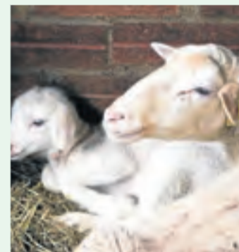
L'exportació, nota positiva.

Quant als preus de la carn de cabrum, van mostrar oscil·lacions semblants a les dels