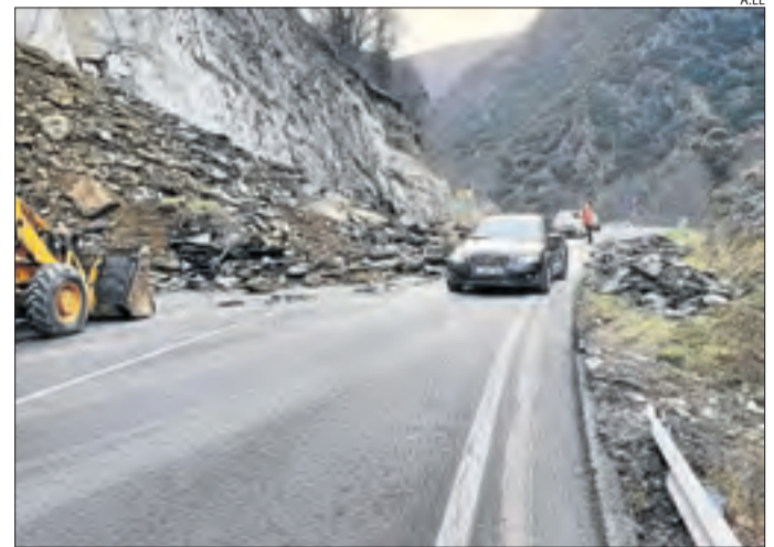
Pas alternatiu a la C-13 pel desprendiment de divendres.