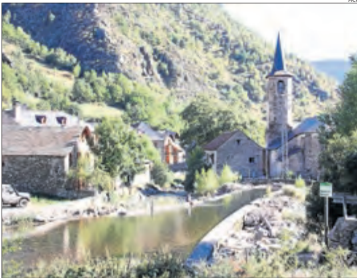
Vista d'arxiu del nucli d'Isil, a Alt Àneu.