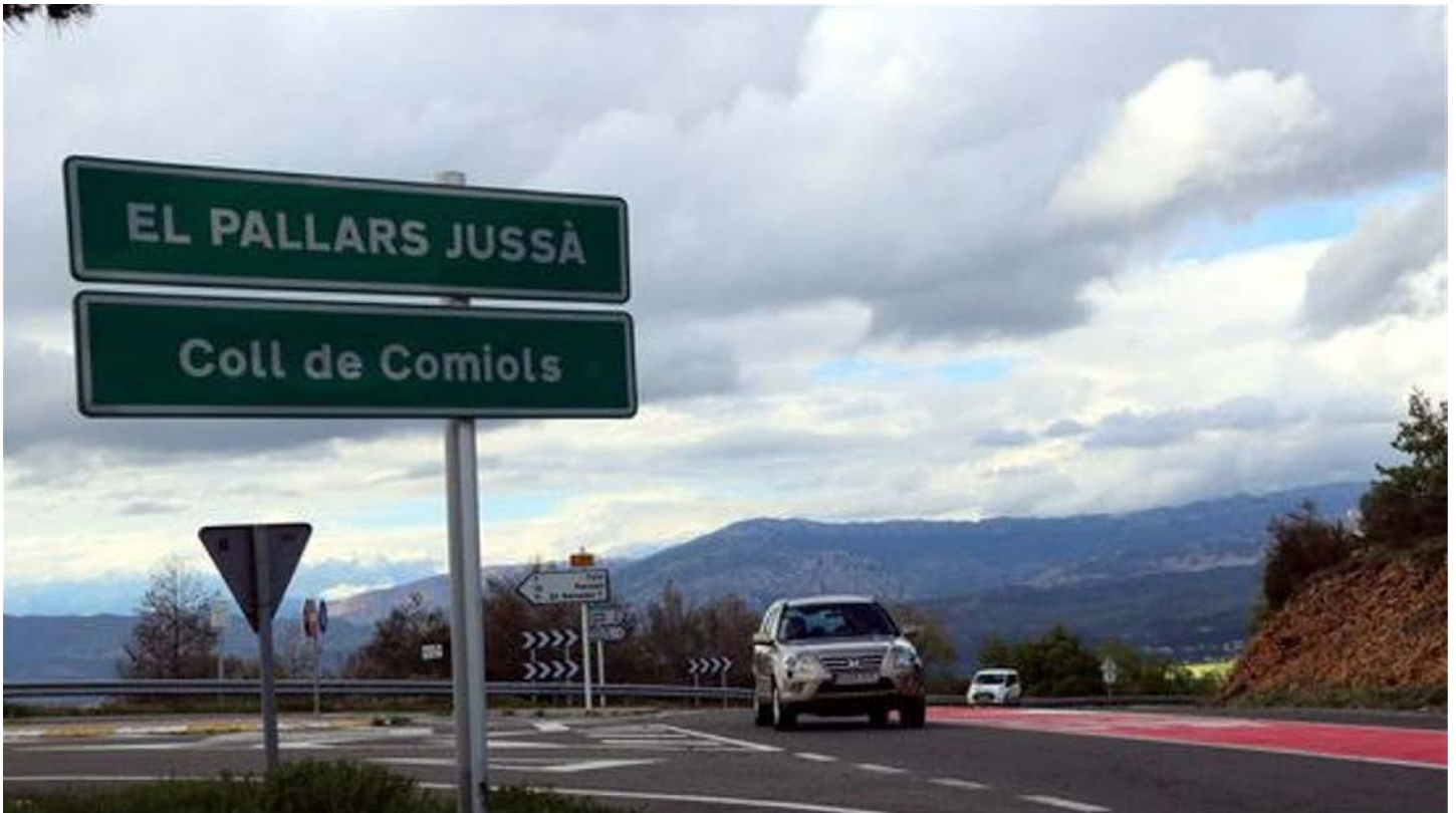
Imatge d'arxiu del coll de Comiols.

COMIOLS El Departament de Territori i Sostenibilitat té en licitació les obres de la variant d'Artesa de Segre, per un import de 5,2 MEUR, que permetrà millorar la seguretat viària i la mobilitat en aquest municipi. Aquesta actuació forma part del condicionament per afavorir les comunicacions de l'eix de Comiols, des d'Artesa de Segre fins a Isona. L'obra consistirà en la construcció d'una nova carretera, d'1,2 quilòmetres de longitud, que evitarà el pas per l'interior del nucli d'Artesa de Segre. Es preveu que els treballs comencin l'estiu vinent i tinguin un termini d'execució d'11 mesos.