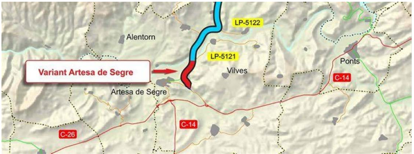
Mapa de les obres a Comiols TES

En el seu recorregut, comptarà amb enllaços a nivell als seus extrems, al sud amb la carretera C-14 i al nord amb l'L-512, amb un carril central addicional per a permetre els moviments de gir cap a l'esquerra. Pel que fa a estructures, cal es preveu l'execució d'un pas inferior sota la variant.