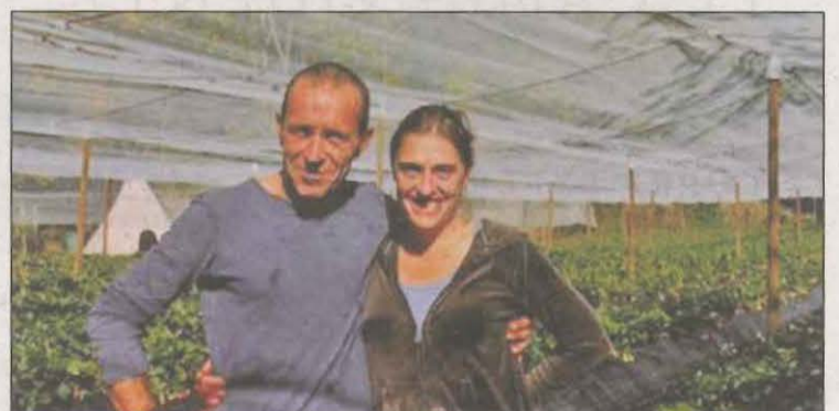
Maduixes Siscarri vol promoure el consum local