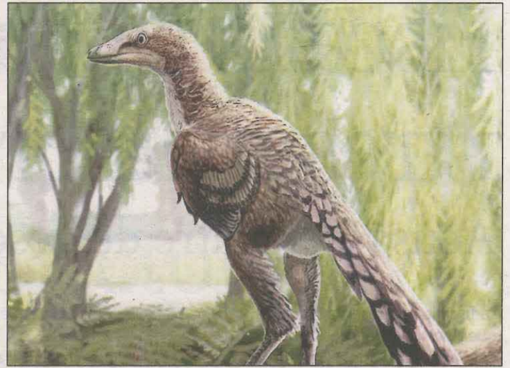
Dibuix que recrea el del dinosaure 'Tamarro insperatus'

joves, ja que la infecció per clamídia provoca esterilitat i malaltia inflamàtori de la pelvis. Així, s'ha detectat un 7,4% de pacients positius, que puja casi al 10% si s'hi afegeixen les parelles. Això vol dir que de cada 100, hi ha 10 persones que tenen la malaltia i no ho saben. Amb aquests resultats es parlarà amb el Departament de Salut per implantar un cribatge en joves asimptomàtics.