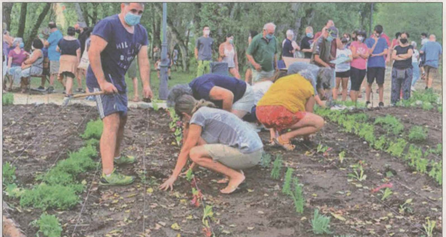
FOTO: / El projecte Senterada Comestible és un jardí d'aliments comunitari que vol recuperar varietats agrícoles i ornamentals tradicionals

La primera edició del 'Matchfunding Arrela't Alt Pirineu i Aran' ja ha seleccionat els 6 projectes guanyadors. Es tracta d'una convocatòria de finançament col·lectiu mixta en la qual les administracions públiques complementen les aportacions que fa la ciutadania a través del micromecenatge, aportant un euro per a cada euro recaptat, multiplicant així els fons recollits. En aquesta primera edició es compta amb un fons públic de 24.000 €, per activar un màxim de 6 projectes de l'Alt Pirineu i Aran que tinguin un impacte positiu i un retorn social al territori. Els sis projectes seleccionats són Donem vida al bosc - Integra Pirineus, Maduixes Siscarri, la Trumfeta de Cerdanya, Senterada Comestible, Boumort Indòmit, i Ecocentre Bioleta. Donem Vida al bosc Integra Pirineus és una campanya de comunicació per atraure la Responsabilitat Social Empresarial i destinar-la a la inserció sociolaboral de col·lectius de persones en risc d'exclusió i/o discapacitat a través de la Gestió Forestal Sostenible dels boscos del Pirineu. Maduixes Siscarri amb Gust de Pirineu es dedica al cultiu i distribució de maduixa ecològica, diversificant amb xordons (gerds) i altres productes d'horta fent una distribució de proximitat que promou el consum local i ajuda al petit comerç amb un producte singular. Espai rural La Trumferia de Cerdanya és un projecte que ofereix l'experiència d'un aperitiu rural on pots recollir un producte de la terra, descobrir com es cultivava i menjar-te'l. T'ofereim pagesia,