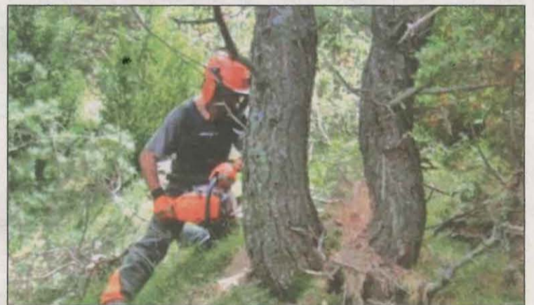
Integra Pirineus vol treballar per la reinserció laboral

els seus objectius. La campanya de micromecenatge, que es durà a terme a través de la plataforma goteo.cc/arrelat, està previst que s'iniciï el 2 de març. Aquesta iniciativa la promouen els Consells Comarcals de l'Alta Ribagorça, l'Alt Urgell, la Cerdanya, el Pallars Jussà, el Pallars Sobirà i el Conselh Generau d'Aran, les Oficines Joves, els serveis de promoció econòmica i treball d'aquestes comarques, l'Ateneu Cooperatiu de l'Alt Pirineu i Aran i el projecte Odisseu, amb el suport de la Diputació de Lleida, la Diputació de Girona, l'Institut per al Desenvolupament i la Promoció de l'Alt Pirineu i Aran (IDAPA), la DG de Joventut, el Consorci GAL Alt Urgell-Cerdanya i el Consorci Leader Pirineu Occidental amb col·laboració amb el Departament d'Agricultura, Ramaderia, Pesca i Alimentació i el Fons Europeu Agrícola de Desenvolupament Rural.